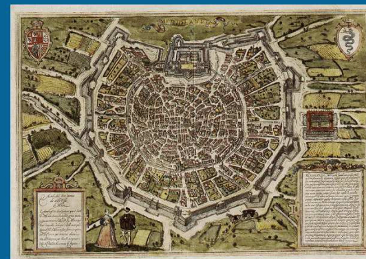
Χάρτης του Μιλάνου, 16ος αι. Herzogin-Anna-Amalia-Bibliothek, Weim

Το Δουκάτο του Μιλάνου αποτελεί σημαντική δύναμη κατά τη διάρκεια του 14ου αιώνα. Ιδιαίτερα η δυναστεία των Σφόρτσα, στις μορφές του Φραντσέσκο (1450-1466) και του Λουδοβίκου (1452-1508), ενθαρρύνει τις ουμανιστικές σπουδές και φιλόδοξα καλλιτεχνικά προγράμματα στην πόλη. Στο Μιλάνο δημιουργούν προσωπικότητες, όπως ο αρχιτέκτονας Μπραμάντε, ο λόγιος Δημήτριος Χαλκοκονδύλης, ο μουσικός Γκαφφούριο, ο γλύπτης Φιλαρέτε και ο ποιητής Φίλελφος.