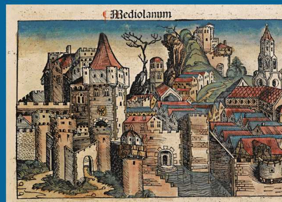
Το Μιλάνο του 1493. Ξυλογραφία από Χρονικό της Νουβέλλης