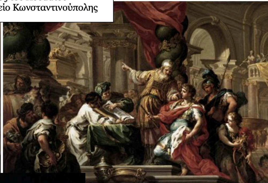
Ο Αλέξανδρος στο Ναό των Ιεροσολύμων. Σεμπαστιάνο Κόνκα, γύρω στα 1750