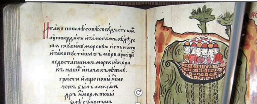
Ο Αλέξανδρος καταδύεται στη θάλασσα μέσα σε γυάλινο σκάφος.* Έκδοση οριστικού μυθιστορήματος (17 ος αιώνας) με Αθήνα