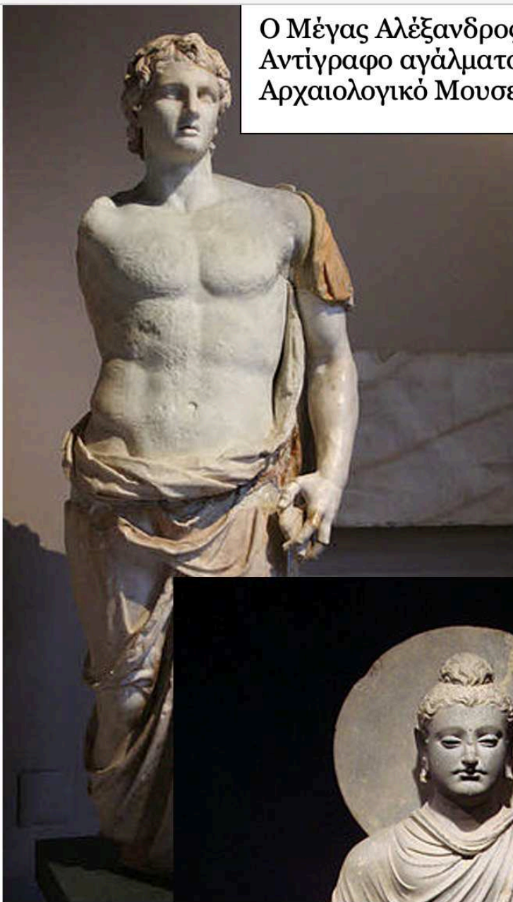
Ο Μέγας Αλέξανδρος με μιάτιο (3 ος αι. π.Χ.) Αντίγραφο αγάλματος του Λύσιππου Αρχαιολογικό Μουσείο Κωνσταντινούπολης