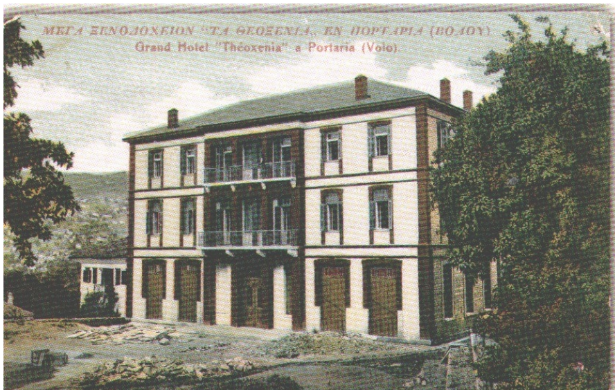
Το ξενοδοχείο "Θεοξένεια" που ιδρύθηκε στις αρχές του 20ου αιώνα.