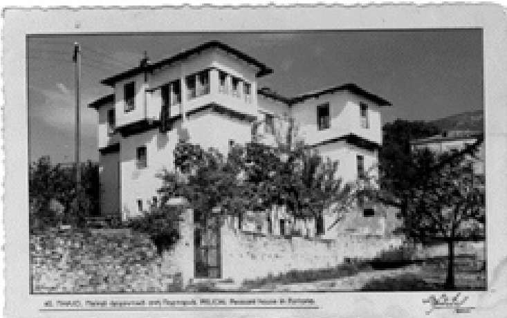
Καρτ -ποστάλ με αρχοντικό της Πορταριάς