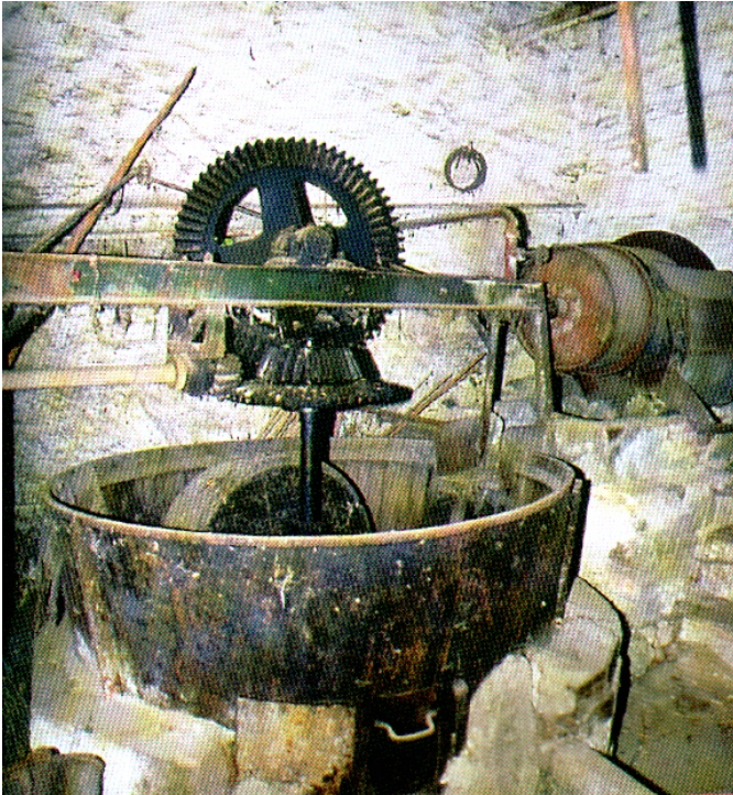
Παραδοσιακό λιοτριβ στο Κατηχώρι