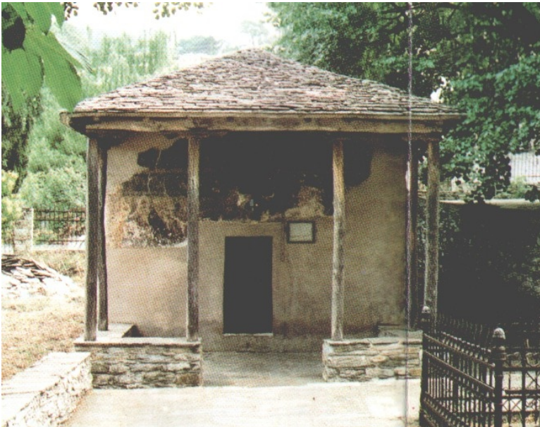
Παναγία Πορταρέα περίπου το 1200 μ.Χ.