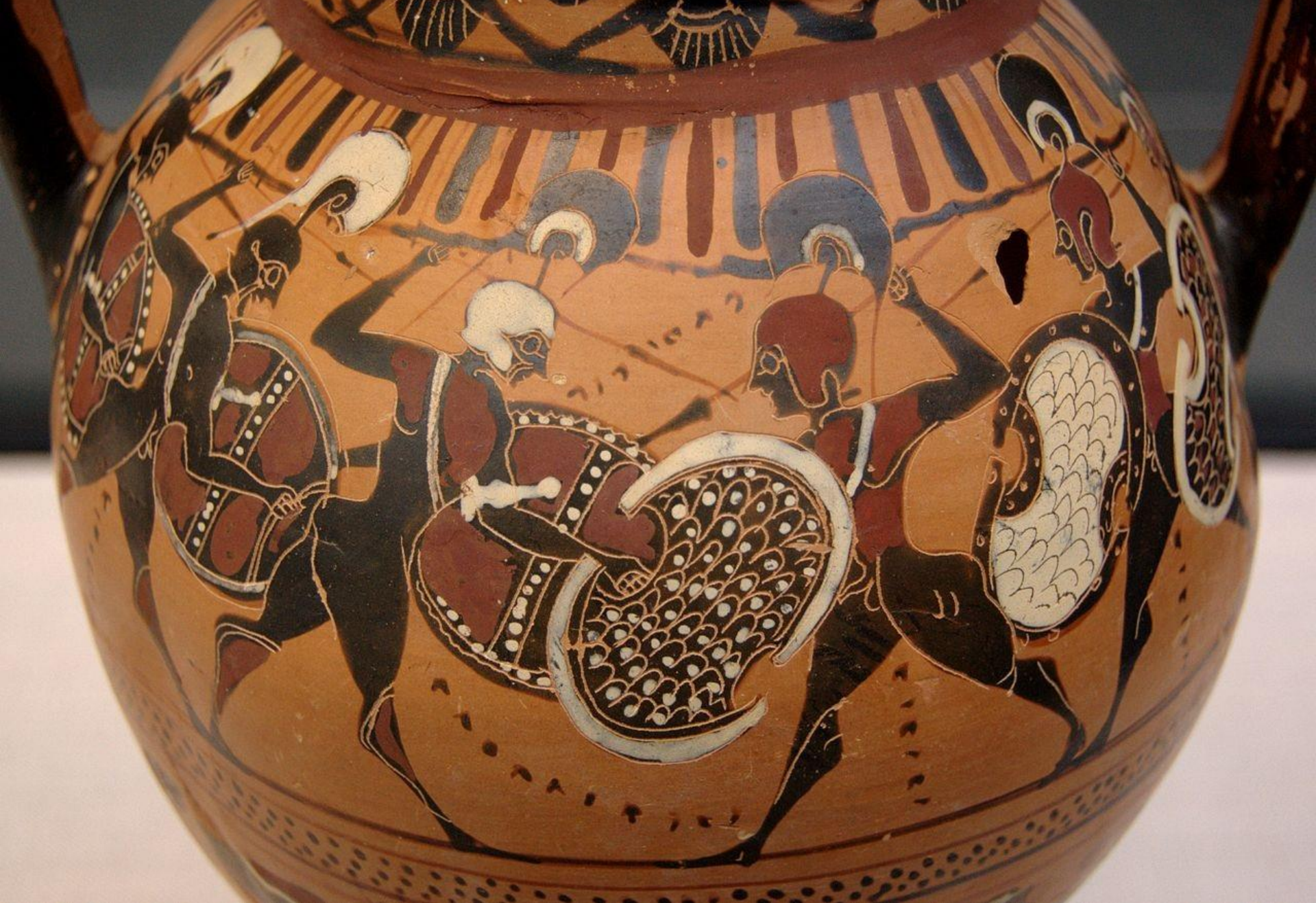
Μελανόμορφος αττικός αμφορέας με παράσταση εμφύλιας σύγκρουσης στην Αρχαία Ελλάδα