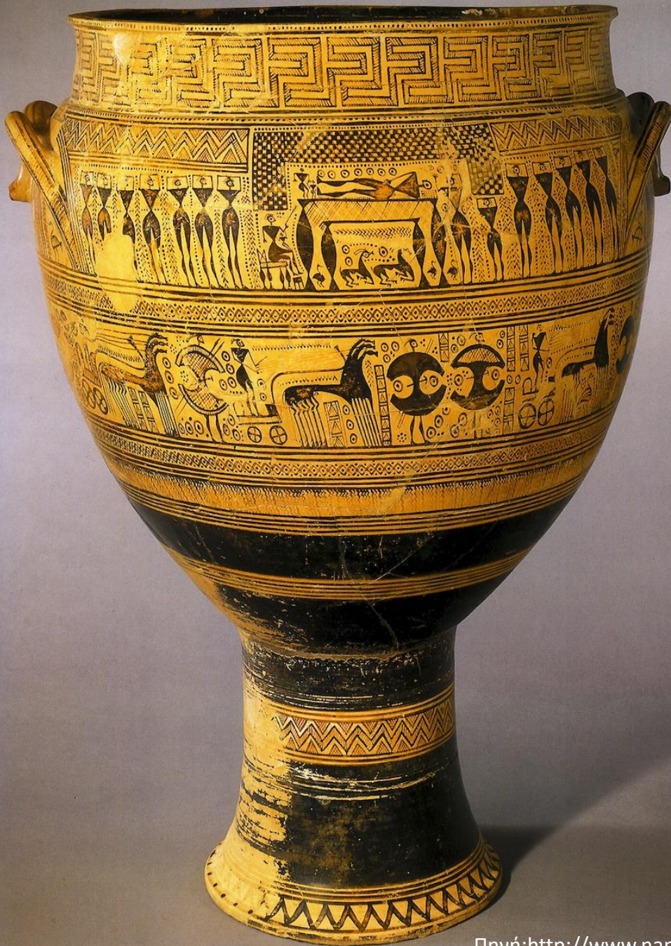
Αττικός γεωμετρικός κρατήρας. Από το Δίπυλο, Κεραμεικός. Του «Ζωγράφου του Hirschfeld» 750-735 π.Χ. Εθνικό Αρχαιολογικό Μουσείο