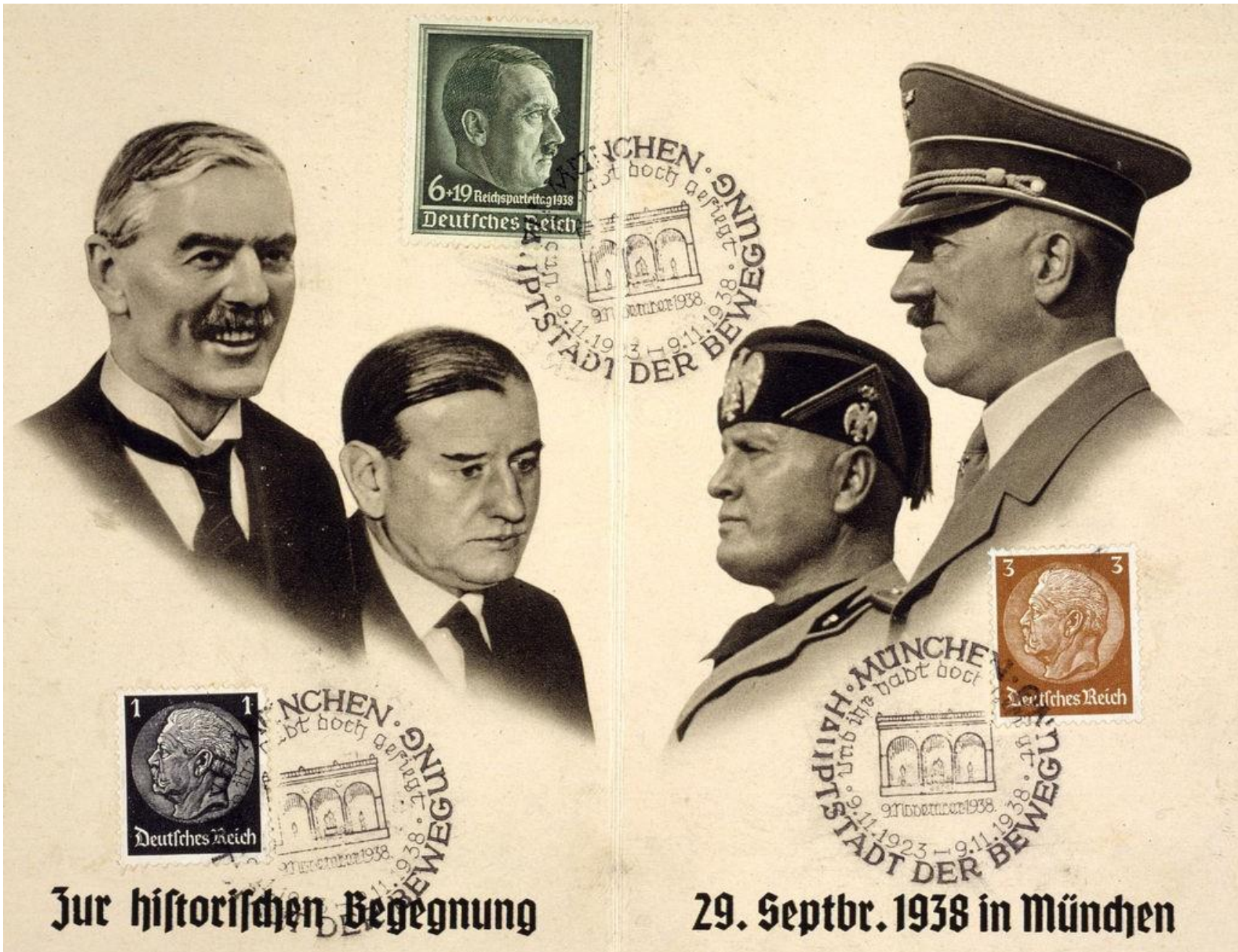
Καρτ ποστάλ σε ανάμνηση της υπογραφής της συμφωνίας του Μονάχου