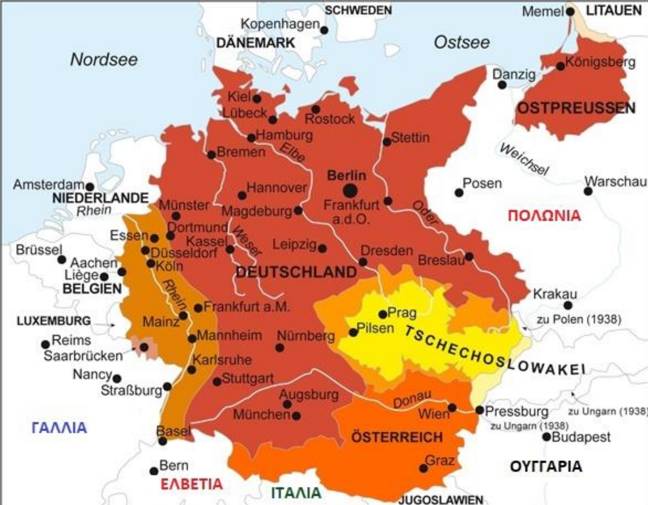
Αλλαγές συνόρων και εδαφών 1935-39