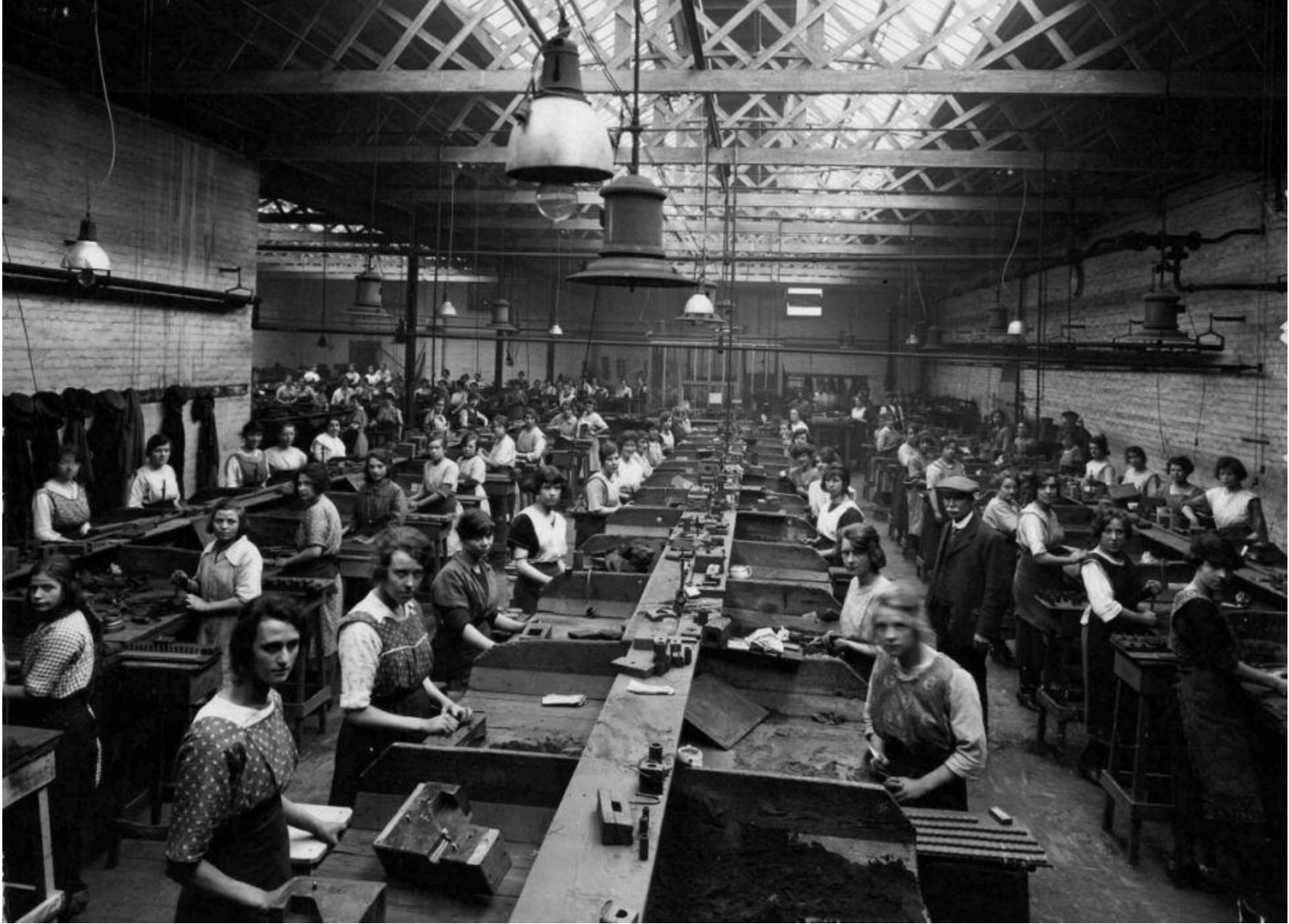
Γυναίκες σε εργοστάσιο μεταλλουργίας στην Μεγάλη Βρετανία. Κατασκευάζουν μήτρες για χύτευση μετάλλου