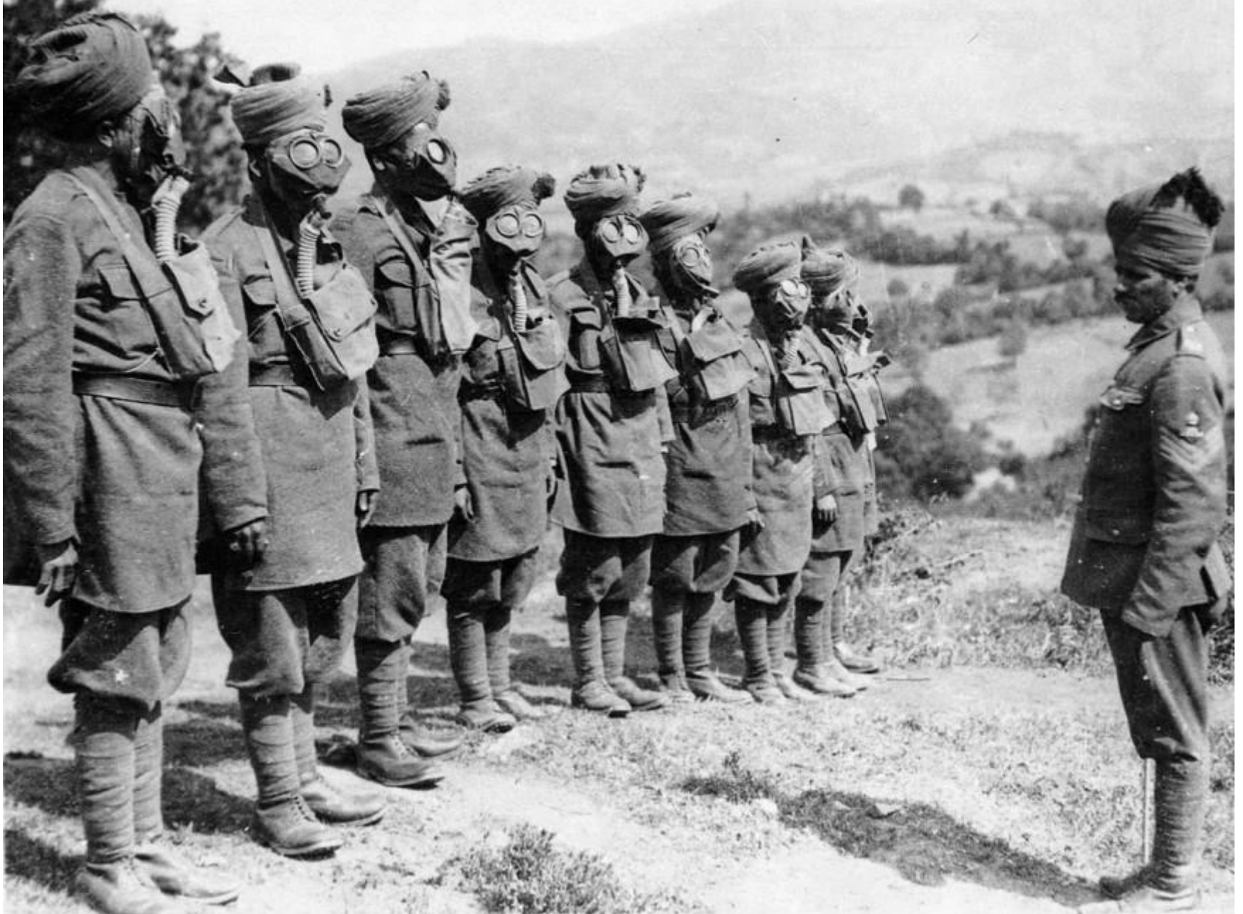
Ινδοί στρατιώτες στο μακεδονικό μέτωπο κατά τον Α΄ Παγκόσμιο Πόλεμο