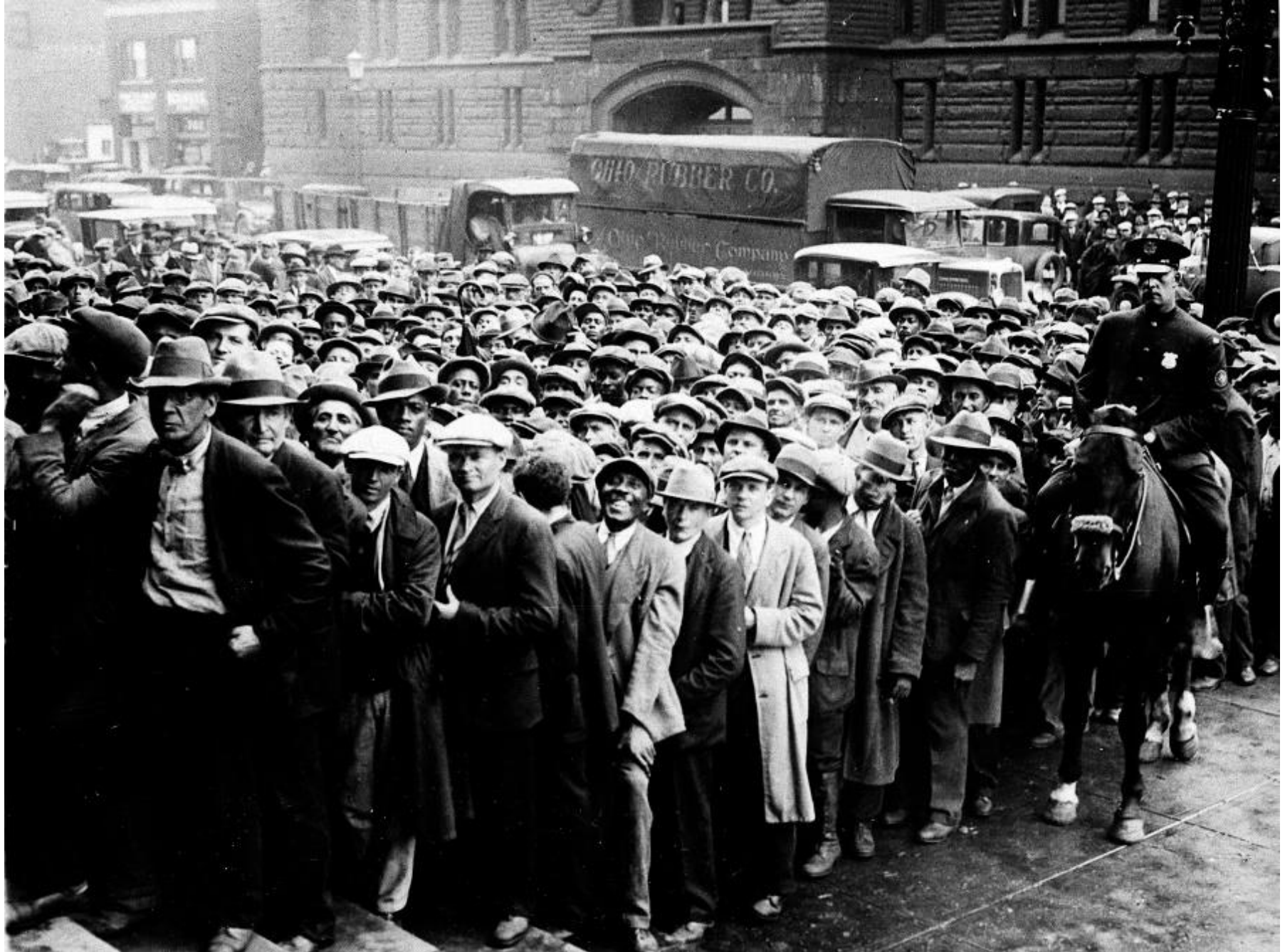
Η Μεγάλη Ύφεση: εκατομμύρια άνεργοι στις ΗΠΑ μετά το 1929