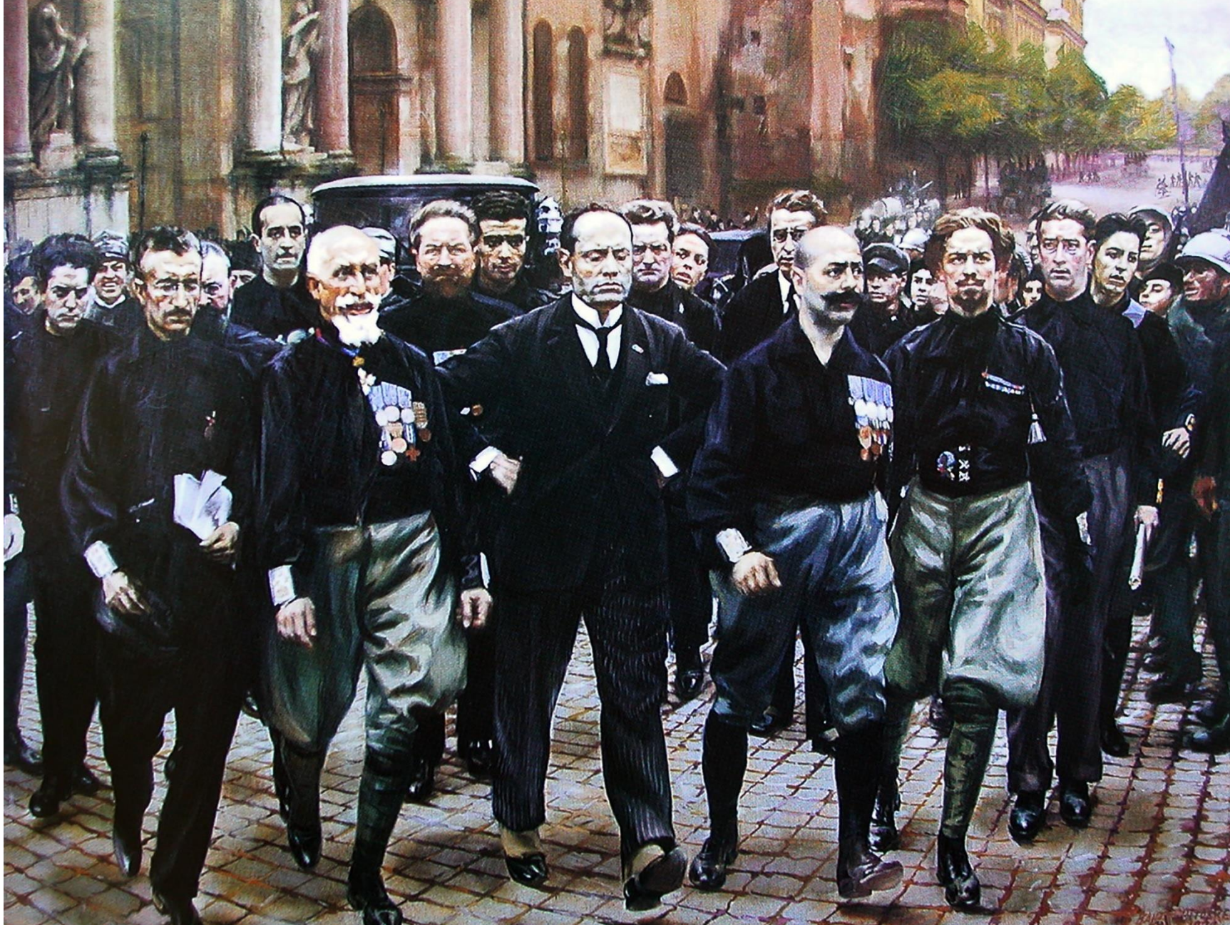
Ο Μουσολίνι και οι μελανοχίτωνες στην πορεία προς την Ρώμη, Πίνακας του Giacomo Balla