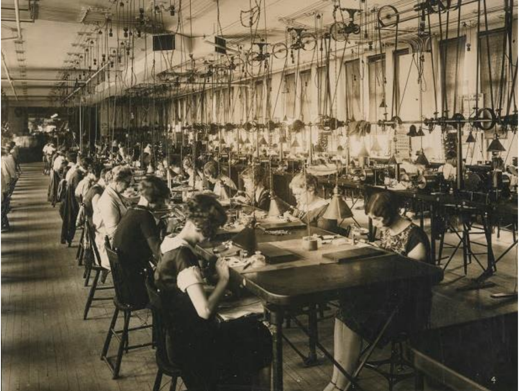
Γυναίκες σε εργοστάσιο την δεκαετία του 1920