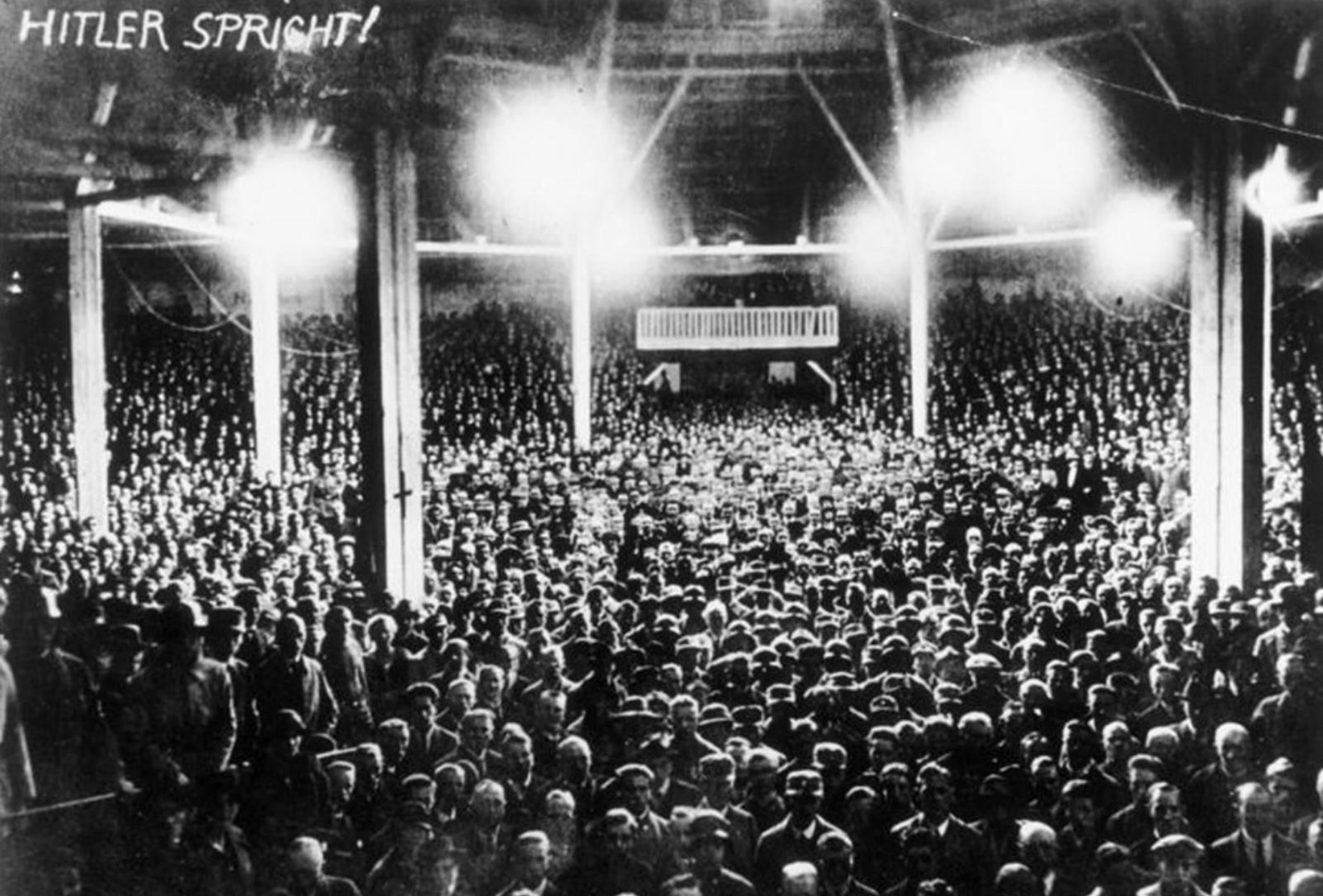
Συγκέντρωση οπαδών του Χίτλερ στο Μόναχο, 1923

https://www.derstandard.at/story/2000120587703/lenin-der-rechten-adolf-hitler-zwischen-buergerlich-und-revolutionaer