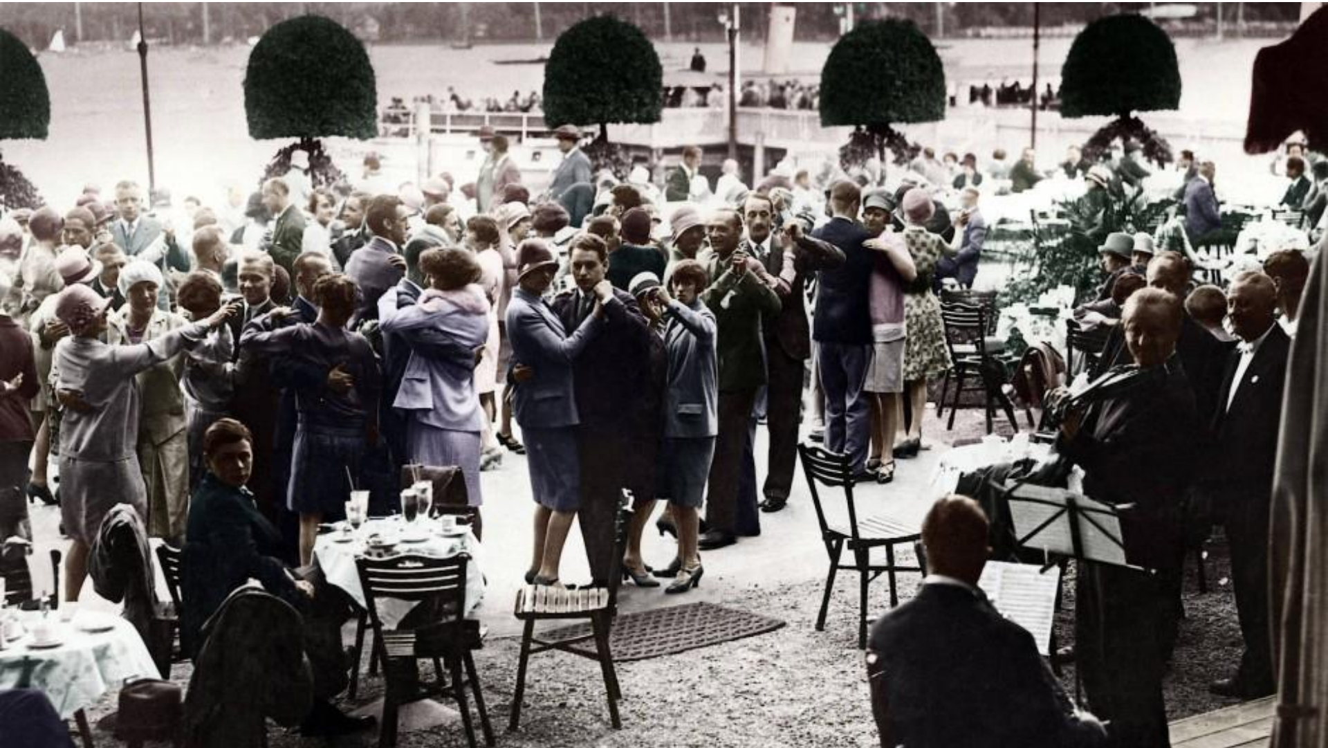
Επιχρωματισμένη φωτογραφία εποχής