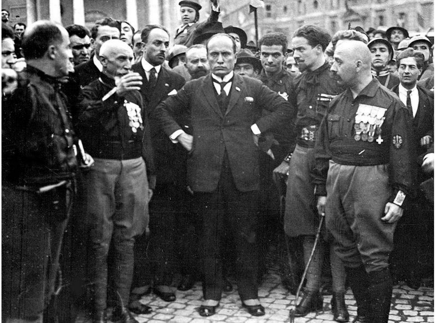
Ο Μουσολίνι και οι μελανοχίτωνες στην πορεία προς την Ρώμη, 1922