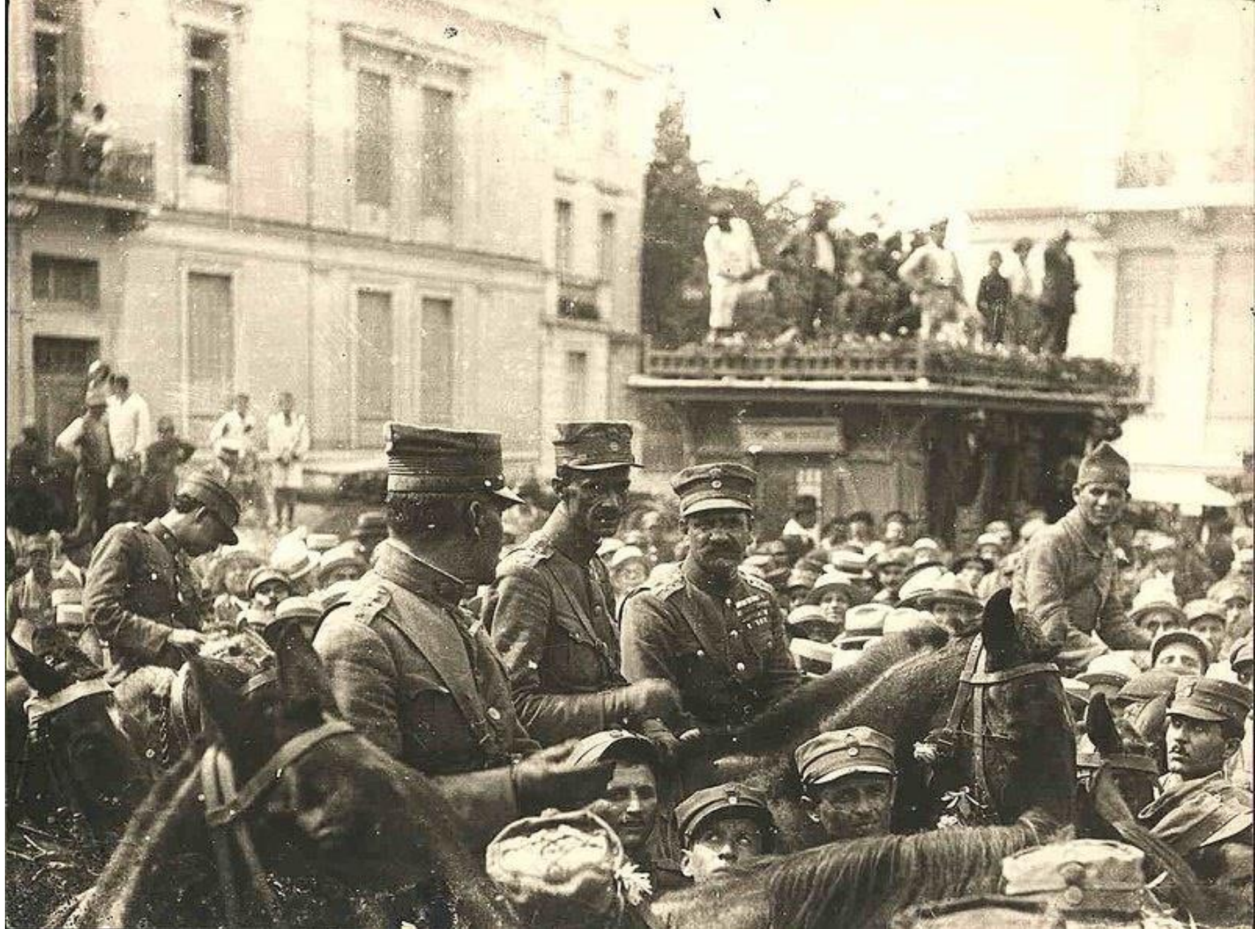
Γονατάς (δεξιά), Πλαστήρας (κέντρο) και Πρωτοσύγκελος (αριστερά) κατά την είσοδό τους στην Αθήνα