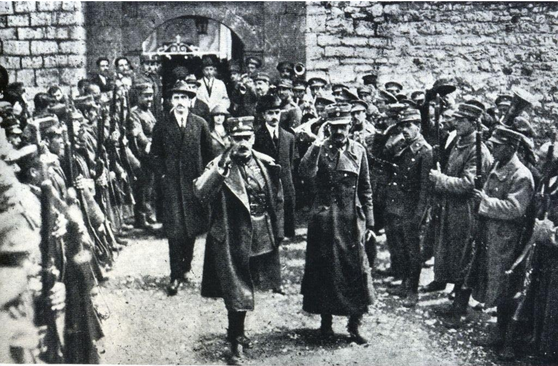
Η ηγεσία της επανάστασης: Γονατάς (κέντρο), Πλαστήρας (δεξιά) και ο πολιτικός σύμβουλος της επανάστασης Γεώργιος Παπανδρέου ο πρεσβύτερος (αριστερά), κατά τη διάρκεια επίσκεψης στη γενέτειρα του Αθανασίου Διάκου, Μουσούνισα