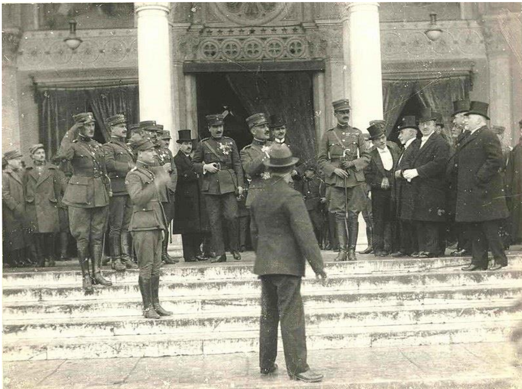
Πλαστήρας, Γονατάς και Σακελλαρόπουλος μπροστά στη Μητρόπολη της Αθήνας