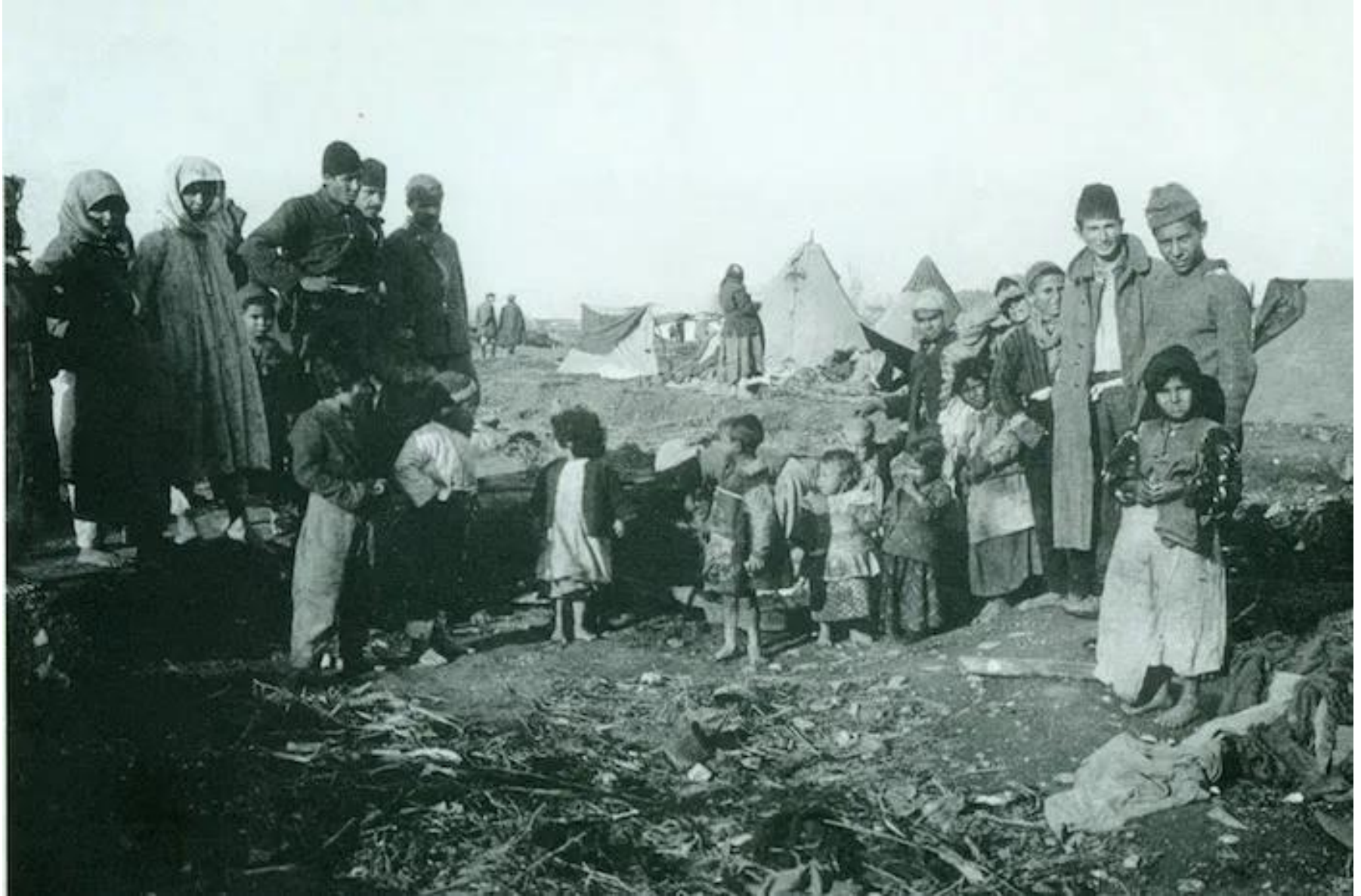
Πρόσφυγες από τον Πόντο σε καταυλισμό στην Θεσσαλονίκη το 1922