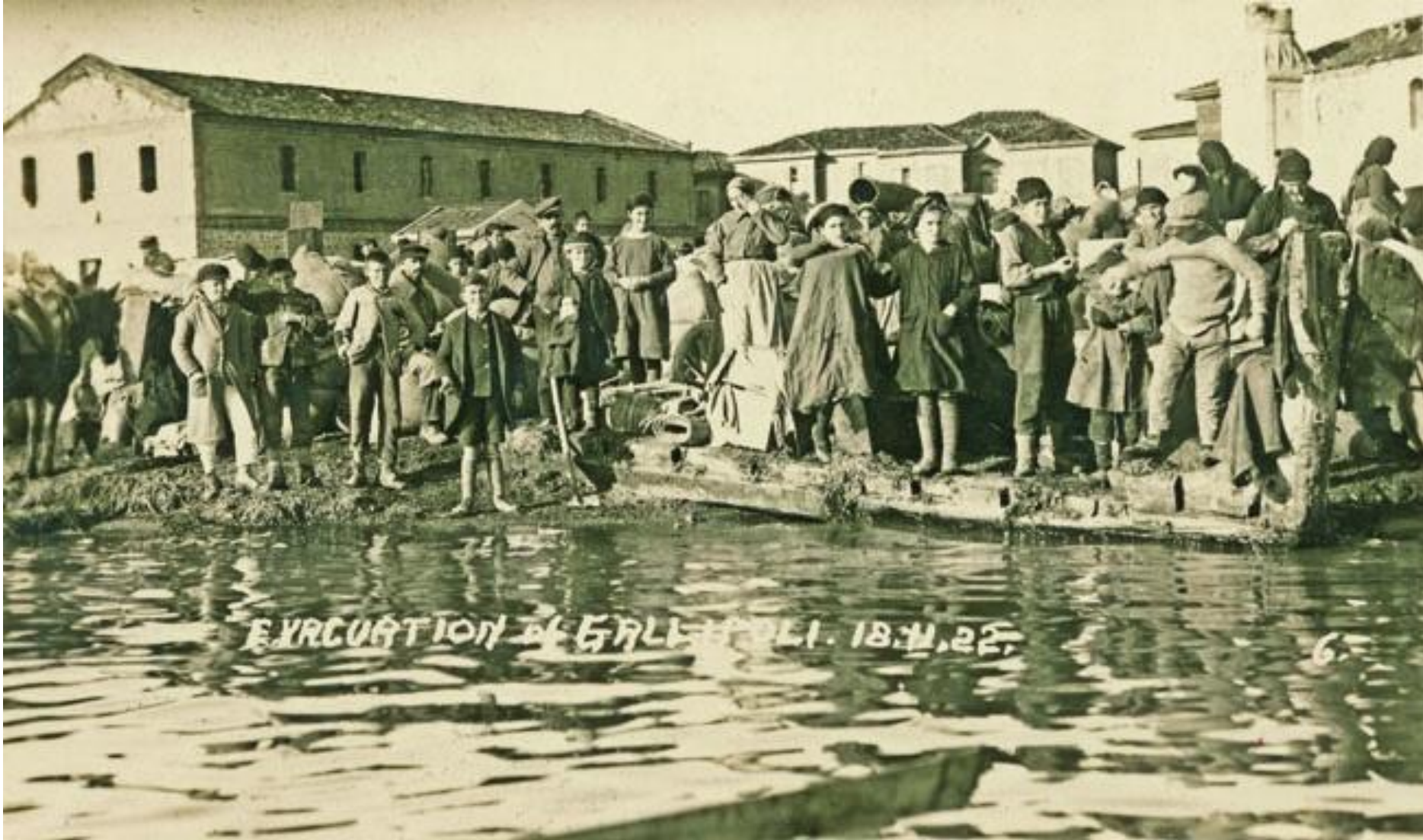
Εκκένωση της Καλλίπολης στην Ανατολική Θράκη, 18.11.1922

Πηγή εικόνας: https://www.greek-genocide.net/index.php/overview/documentation/130-eastern-thrace