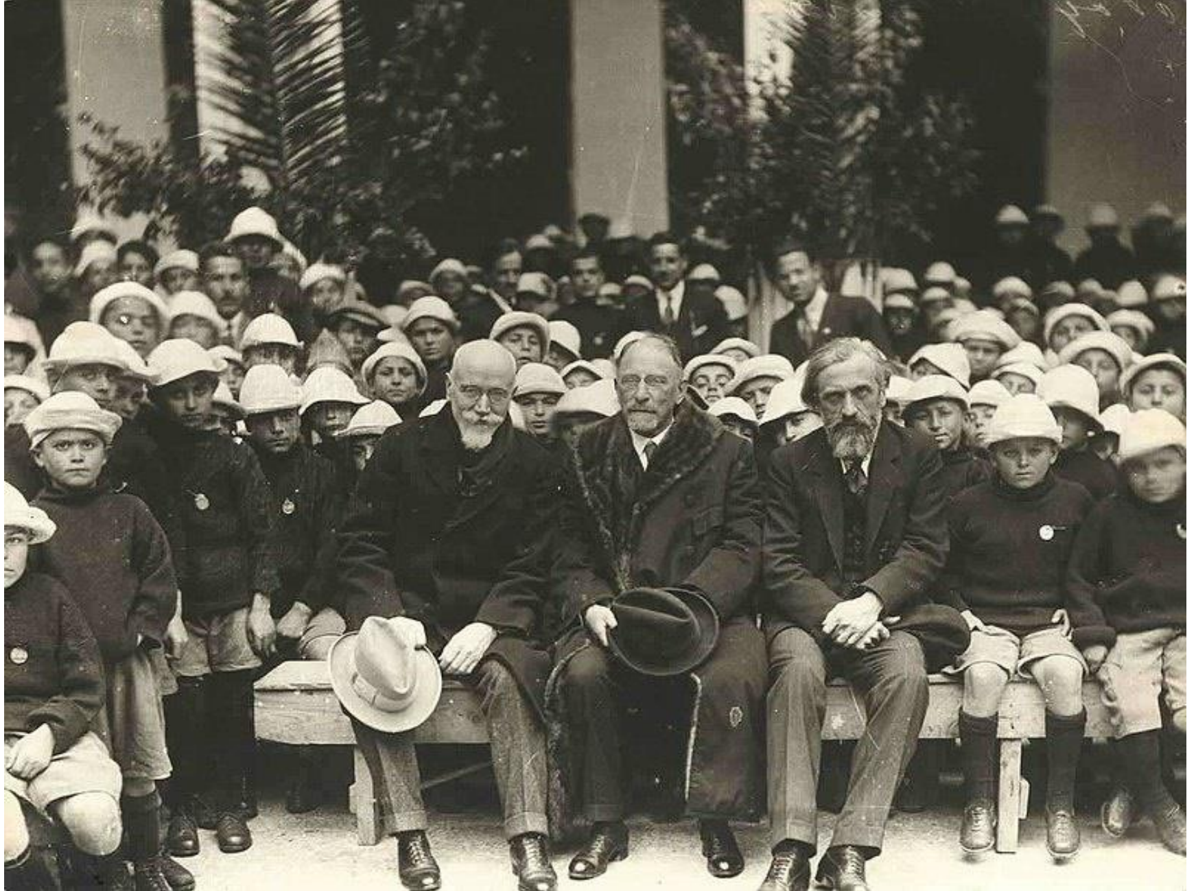
Ο Ελευθέριος Βενιζέλος και ο υπουργός πρόνοιας Δοξιάδης με προσφυγόπουλα από την Μ. Ασία, 1924