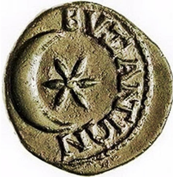
Αρχαίο νόμισμα της πόλης του Βυζαντίου

Κείμενα, συγγραφή, ιστορική έρευνα, εικόνες: Γαρίτατζης Χαράλαμπος (ΠΕ07) Φιλολογική επιμέλεια: Γεώργιος Σπανός (ΠΕ02)