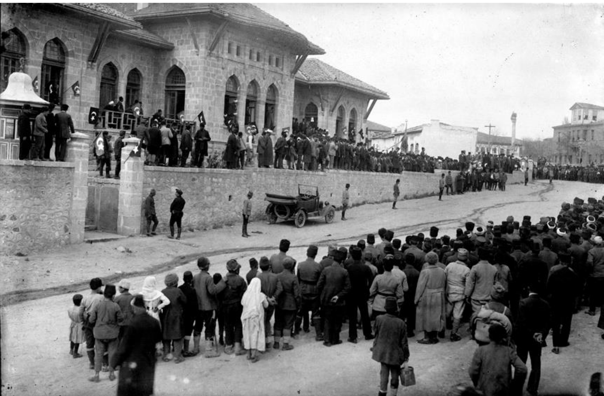
Φωτογραφία από την πρώτη τουρκική Εθνοσυνέλευση, 1920