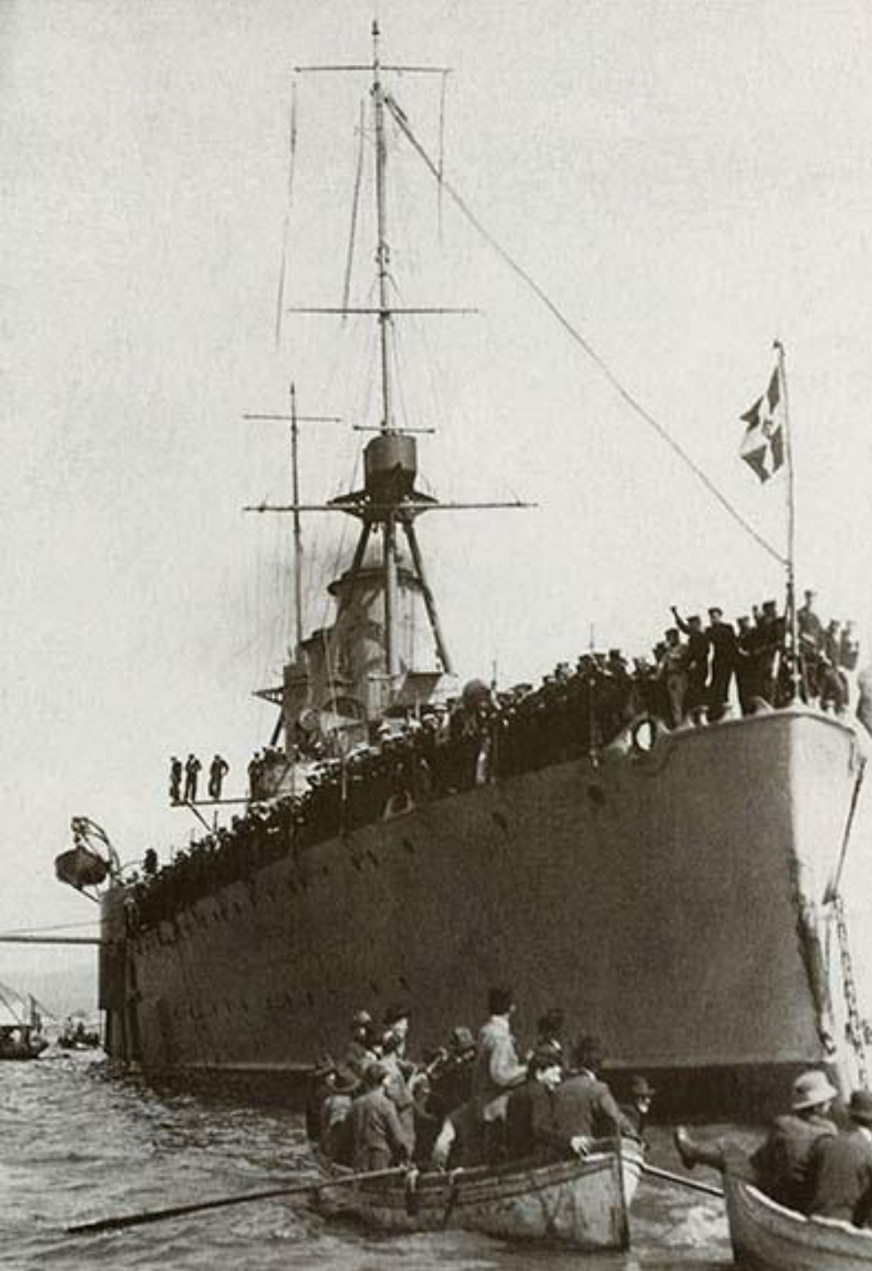
Το θωρηκτό «Γεώργιος Αβέρωφ» στο λιμάνι της Σμύρνης, 1919