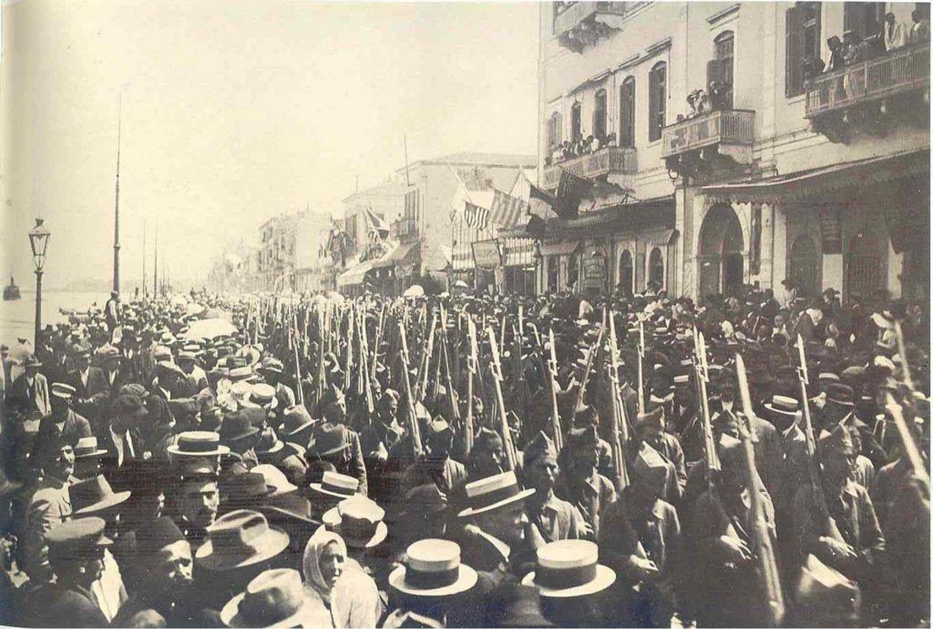
Ο Ελληνικός στρατός παρελαύνει στην Σμύρνη