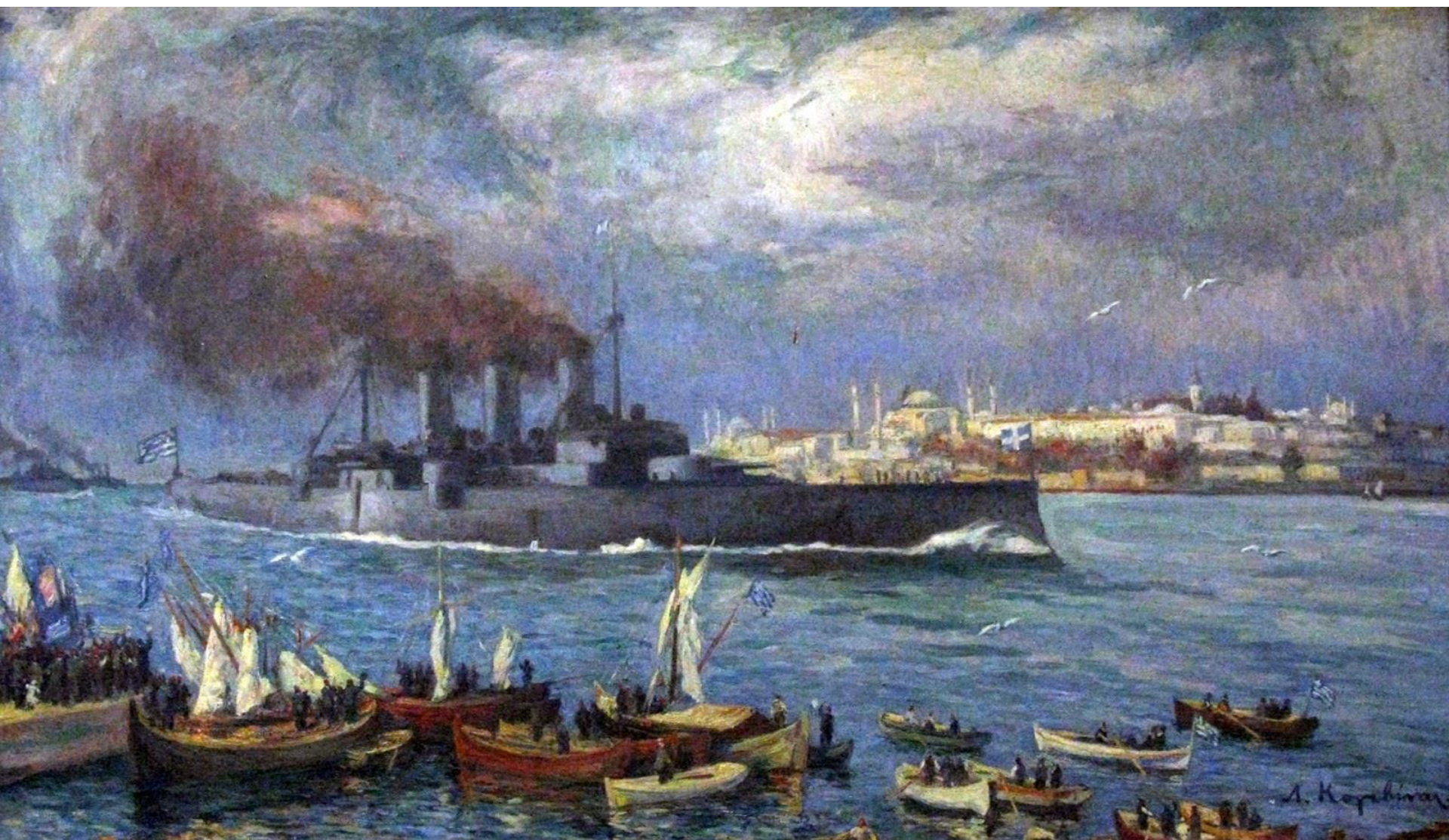
Το θωρηκτό Αβέρωφ εισέρχεται στην Κωνσταντινούπολη Πίνακας του Λυκούργου Κογεβίνα, 1919 – Εθνικό Ιστορικό Μουσείο, Αθήνα https://lcivelekoglu.blogspot.com/2015/11/97-yil-once-bugun-istanbul-sadece.html