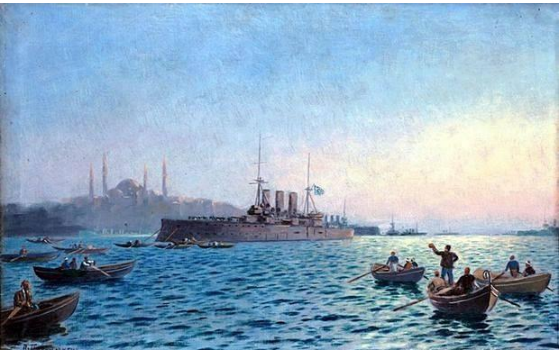
Το θωρηκτό Αβέρωφ στην Κωνσταντινούπολη Πίνακας του Αιμίλιου Προσαλέντη, Πινακοθήκη Αβέρωφ, Μέτσοβο