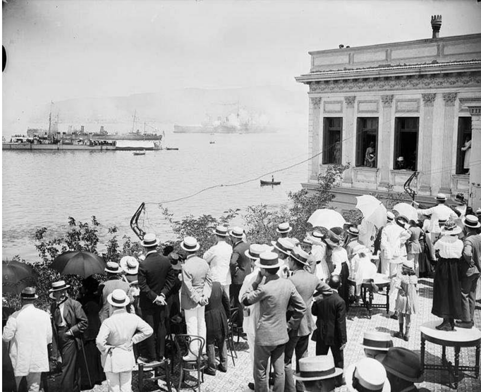
Έλληνες της Σμύρνης παρακολουθούν την είσοδο του ελληνικού στόλου