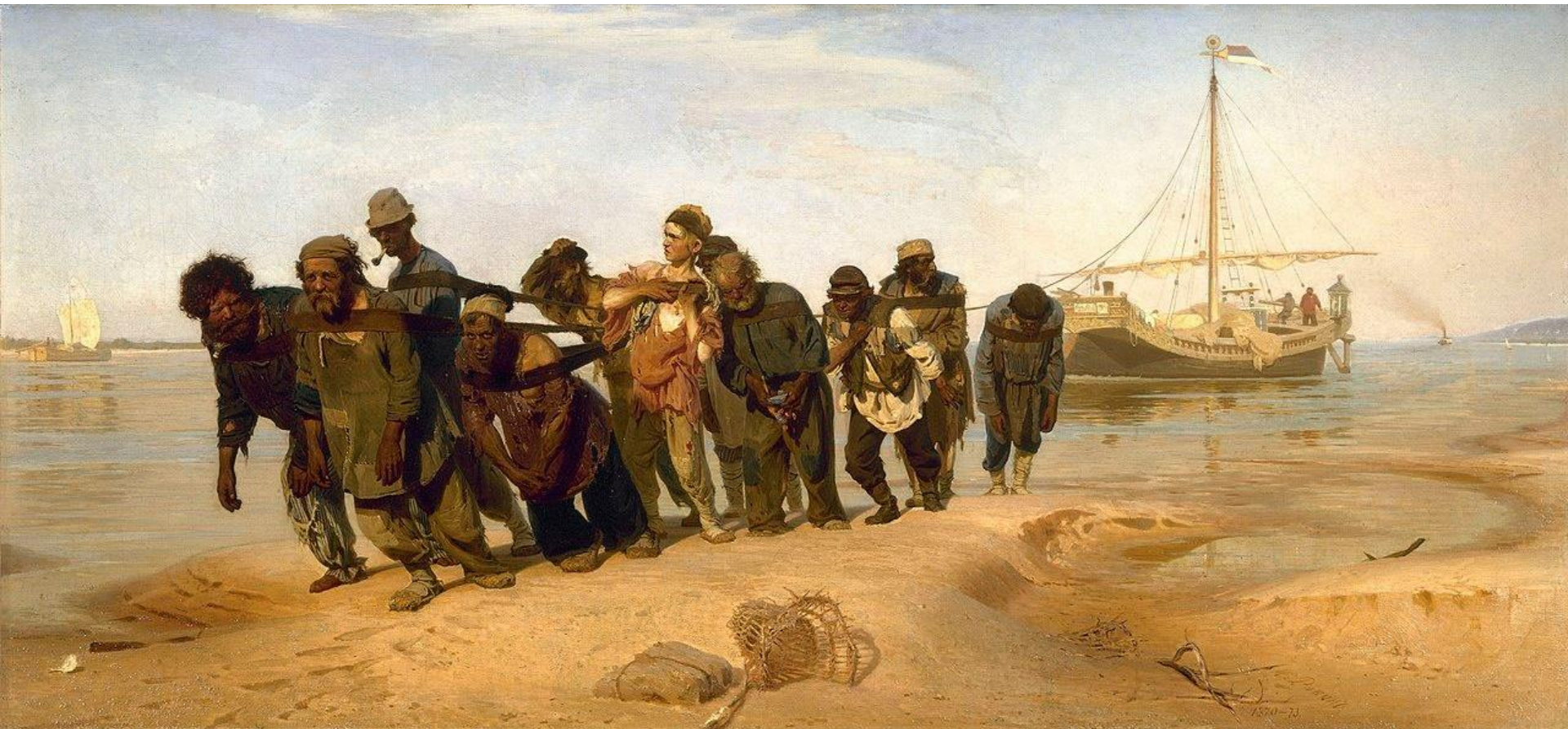
Ρώσοι χωρικοί σέρνουν πλοίο στον Βόλγα ποταμό - Πίνακας του Ιlya Repin Ρωσικό Εθνικό Μουσείο, Αγία Πετρούπολη