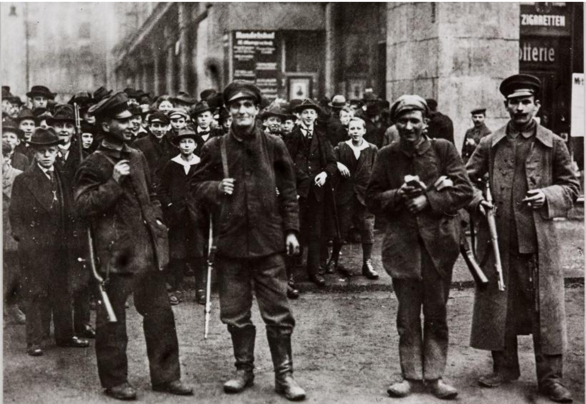
Γερμανοί επαναστάτες τον Νοέμβριο του 1918 στην Κολωνία

https://arbeitsunrecht.de/november-1918-revolution-in-der-frontstadt-koeln/