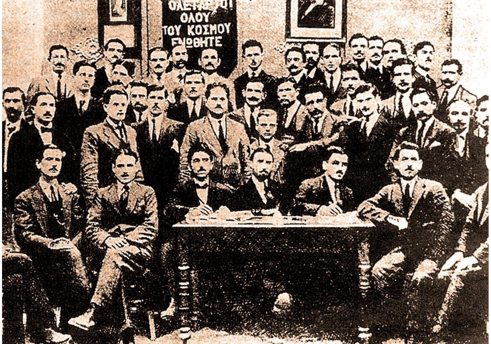
Το 2 ο συνέδριο του Σ.Ε.Κ.Ε.