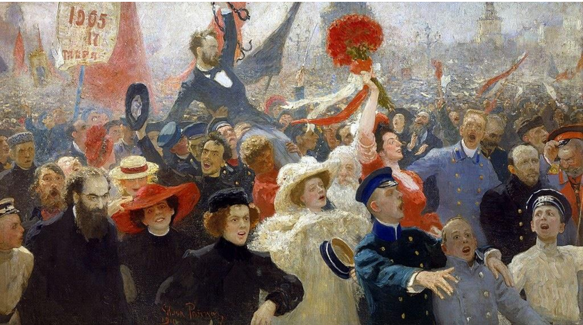
Πορεία διαμαρτυρίας τον Οκτώβριο του 1905 - Πίνακας του Ιlya Repin Ρωσικό Εθνικό Μουσείο, Αγία Πετρούπολη