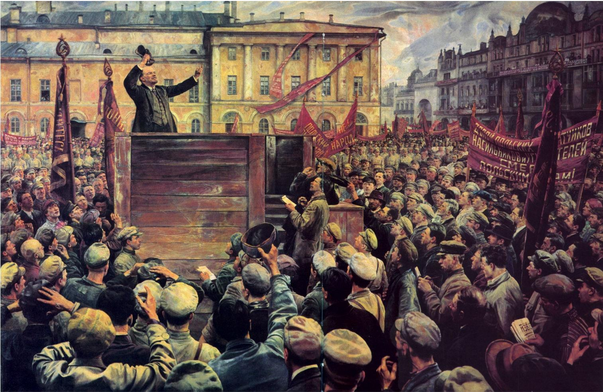
Ο Λένιν μιλάει σε εργάτες στην Αγία Πετρούπολη – Πίνακας του Isaak Brodsky