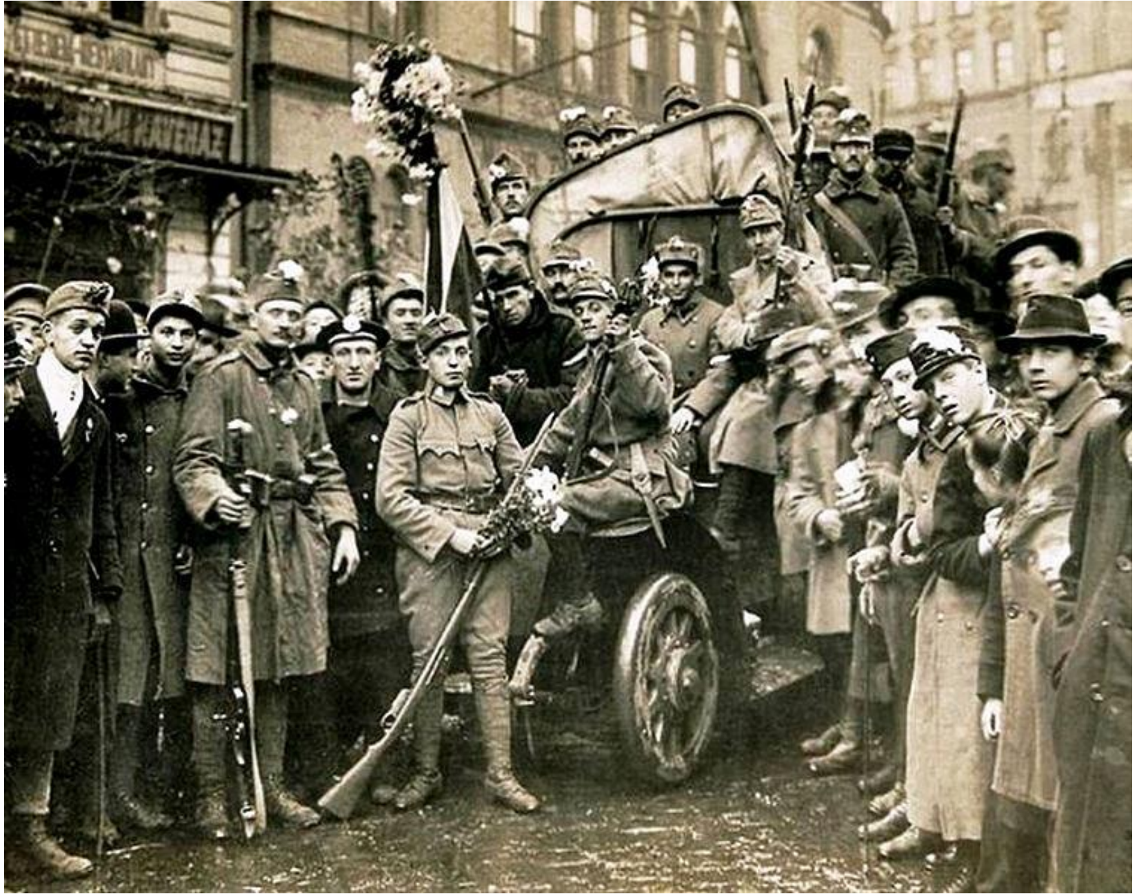
Επαναστατημένοι Ούγγροι στρατιώτες στη Βουδαπέστη το 1918