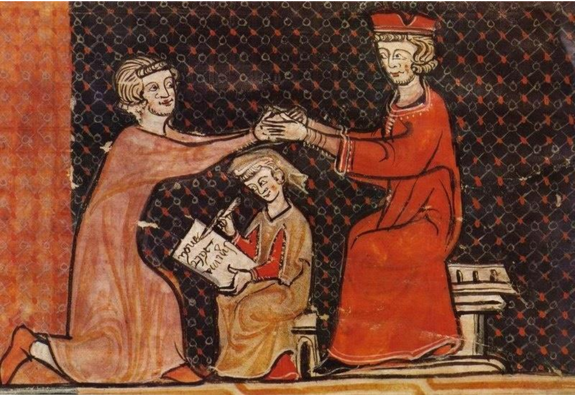
Η τελετή της περιβολής – Από μεσαιωνικό χειρόγραφο του 1293