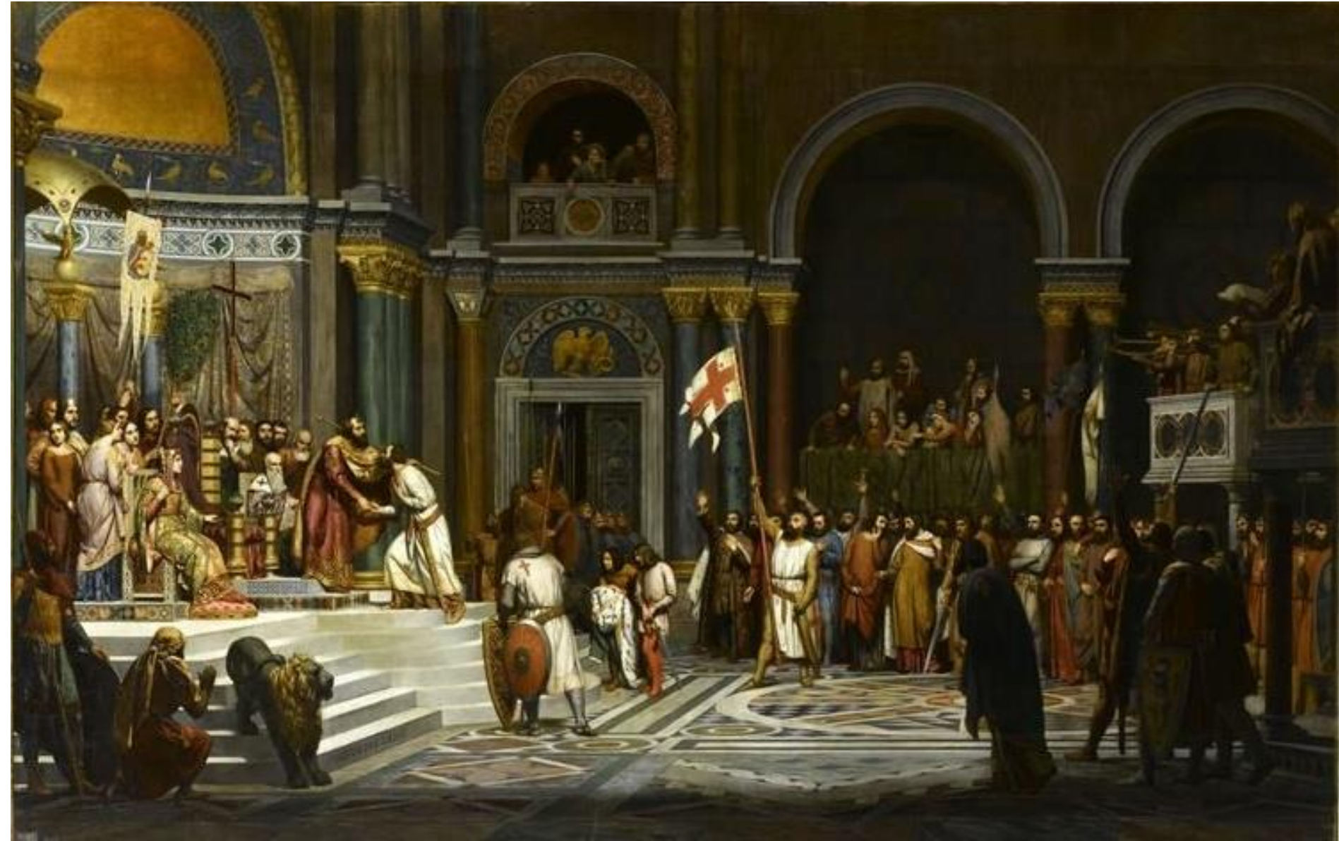
Ο Godfroy de Bouillon (1061-1100), Δούκας του Basse-Lorraine συνάπτει συμμαχία με τον αυτοκράτορα Αλέξιο Α΄ Κομνηνό – Πίνακας του Alexandre Hesse, 19 ος αι., Βερσαλλίες, Παρίσι

Πηγή εικόνας: https://www.pinterest.fr/pin/35289932077780804/