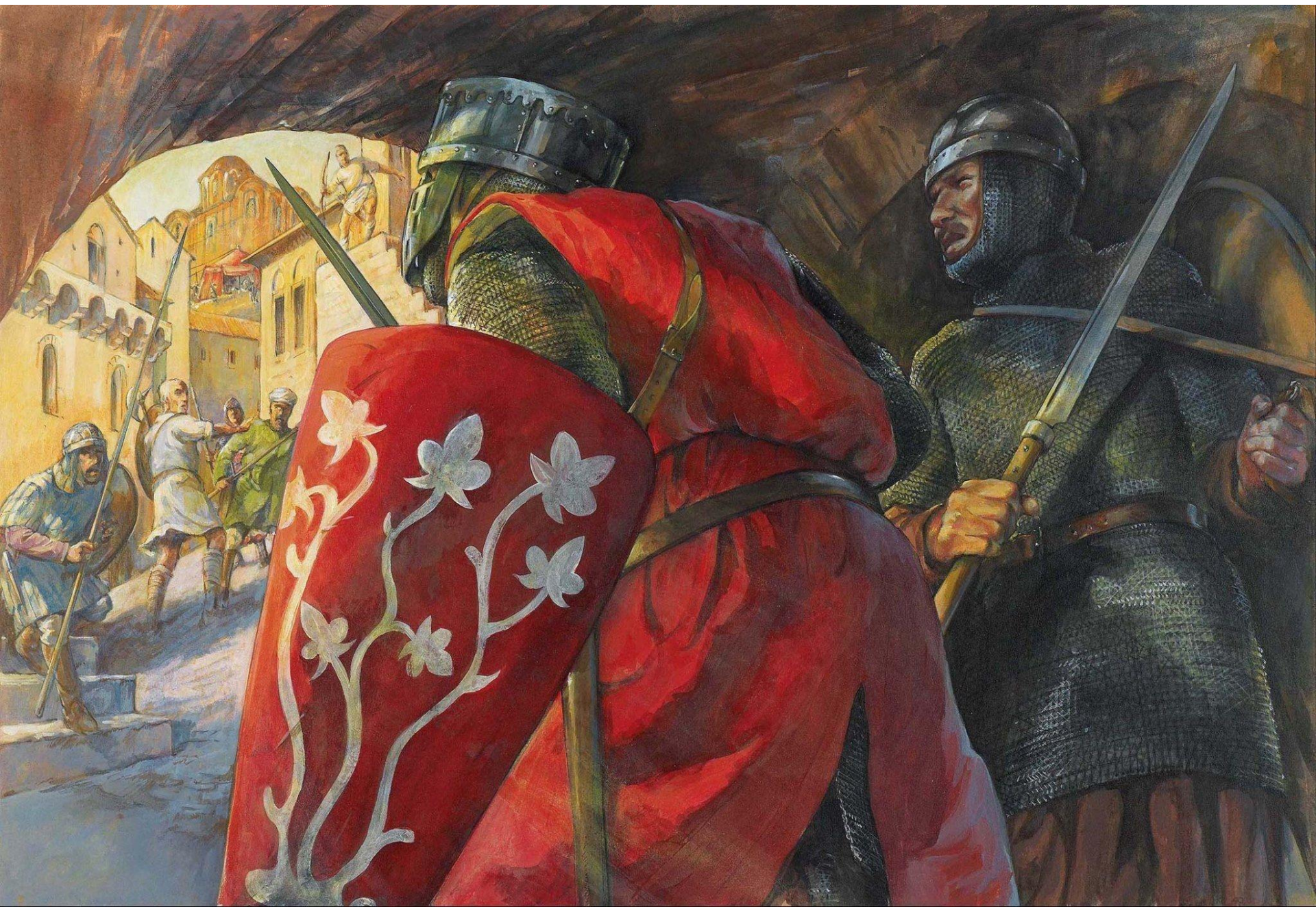
Ο Pierre d'Amiens και ο Aleaume de Clari εισέρχονται στην Κωνσταντινούπολη - Έργο της Christa Hook