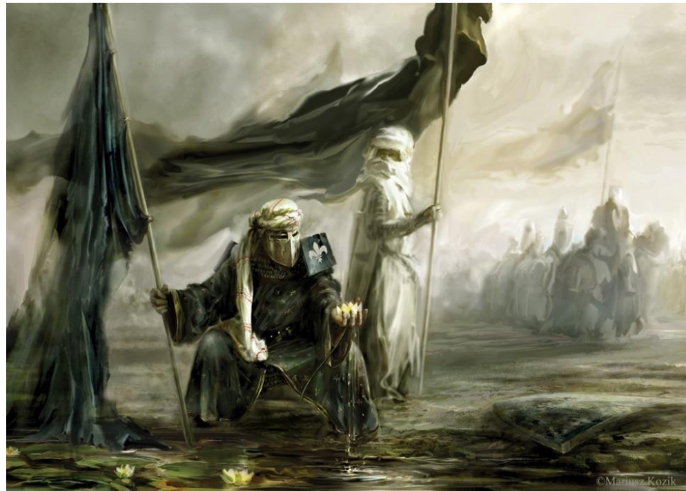
Έργο του Mariusz Kozik