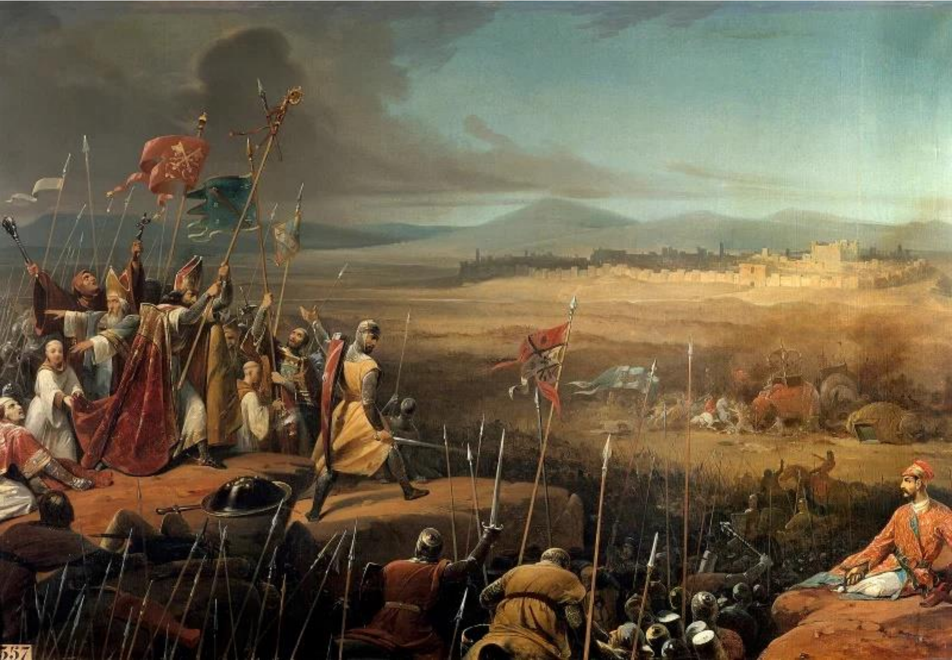
Μάχη στην Αντιόχεια (1098) – Πίνακας του Frederic Schopin, 1842, Βερσαλλίες, Παρίσι