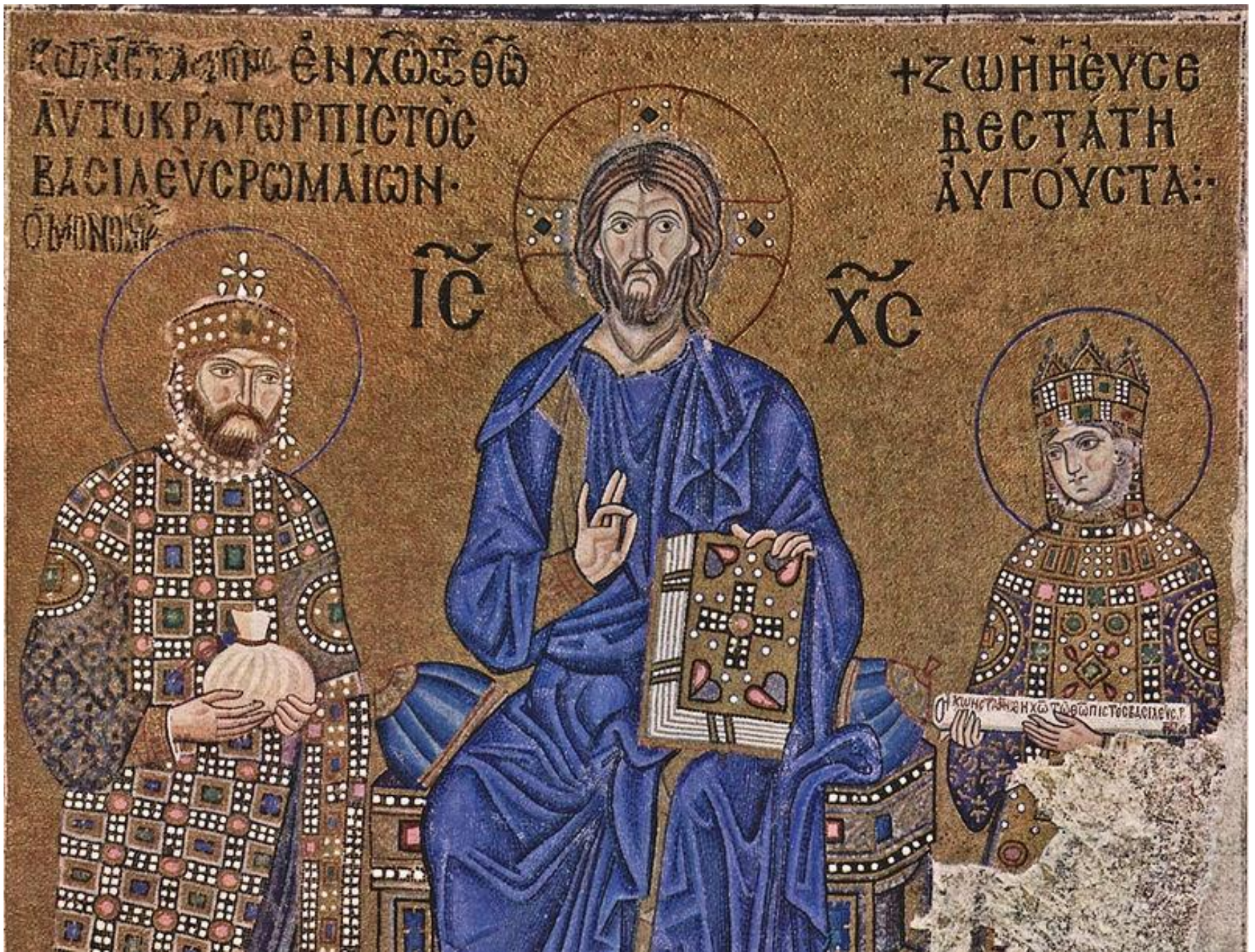
Κωνσταντίνος Θ' Μονομάχος με την αυτοκράτειρα Ζωή σε ψηφιδωτό της Αγίας Σοφίας, 1044