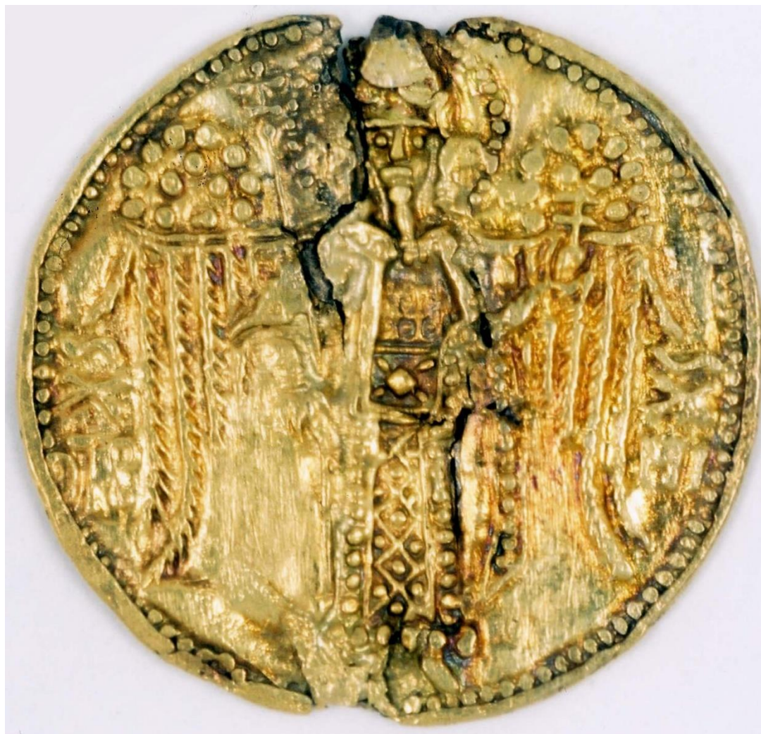
Χρυσή Βούλα του Δεσπότη της Ηπείρου Θωμά (1296-1318) Βρετανικό Μουσείο, Λονδίνο

Πηγή εικόνας: http://warfare.ga/14/Byzantine-Gold_Seal_Bulla-Thomas-Despot_of_Epirus-British_Museum_862_0729_1-lg.htm