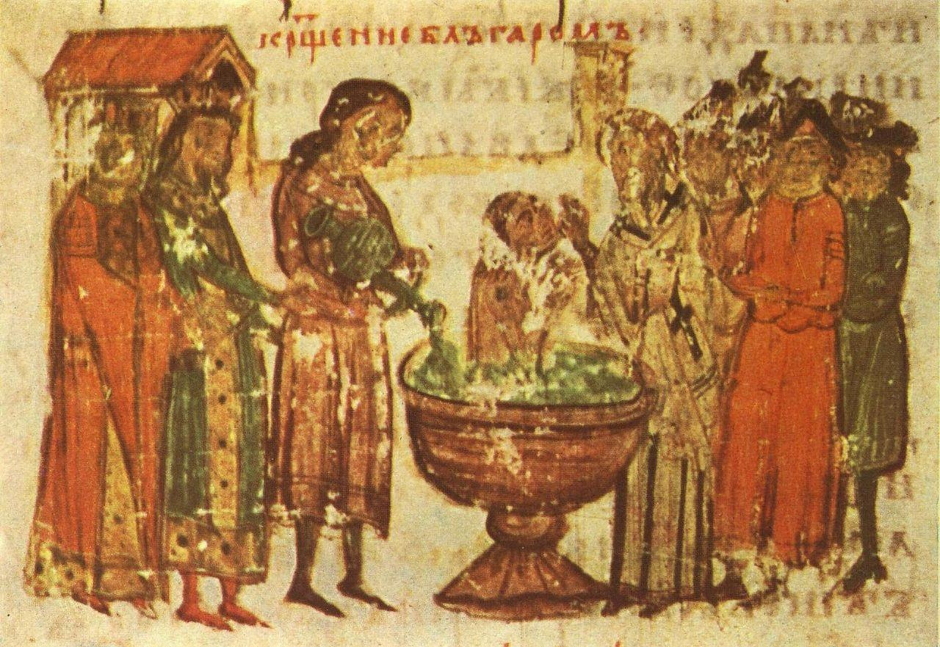
Το βάπτισμα του χαγάνου των Βουλγάρων Βόρη Α΄ από το χρονικό του Μανασσή