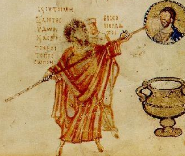
Εικονομάχοι καλύπτουν την εικόνα του Χριστού με ασβέστη. Ψαλτήρι Χλουντόφ (περί το 830). Μόσχα, Ιστορικό Μουσείο