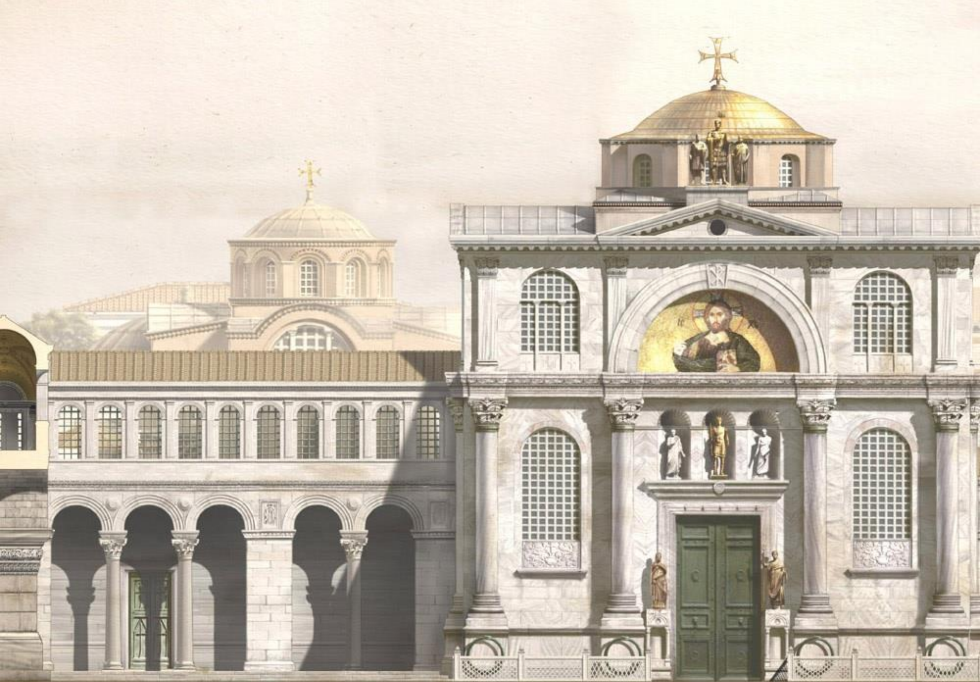
Αναπαράσταση της Χαλκής Πύλης – Έργο του Antoine Helbert