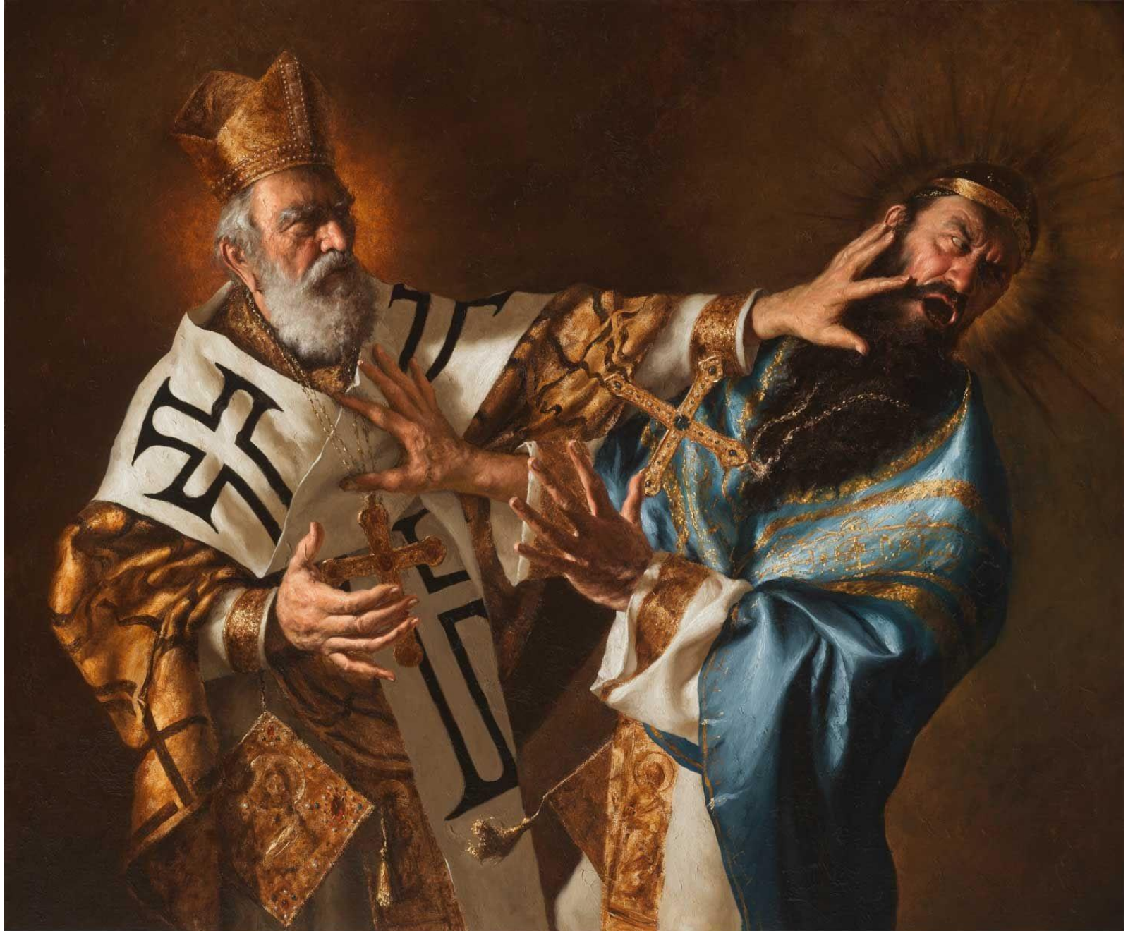
Ο Άγιος Νικόλαος χαστουκίζει τον Άρειο – Έργο του Giovanni Gasparro