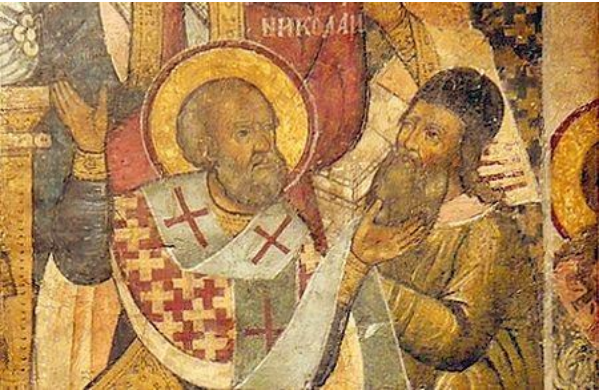
Ο Άγιος Νικόλαος χαστουκίζει τον Άρειο στη σύνοδο της Νίκαιας Τοιχογραφία σε ρωσική μονή της υστεροβυζαντινής περιόδου