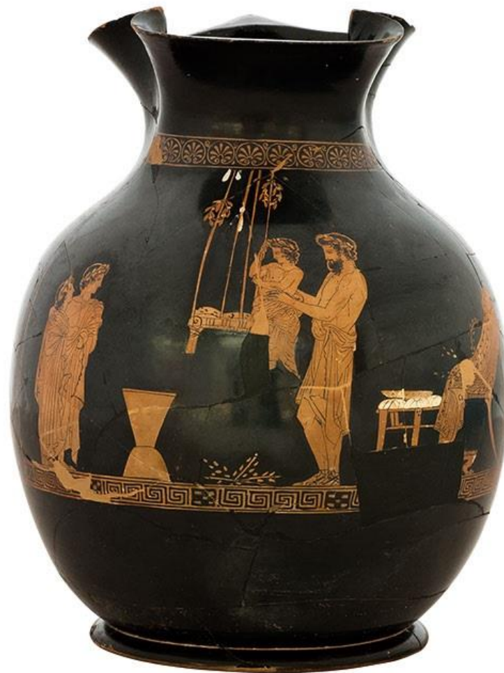
Αττικός ερυθρόμορφος χους. Άνδρας ετοιμάζεται να καθίσει παιδί σε αιώρα. Πιθανώς από το Κορωπί Αττικής. Του Ζωγράφου της Ερέτριας. 425-420 π.Χ.