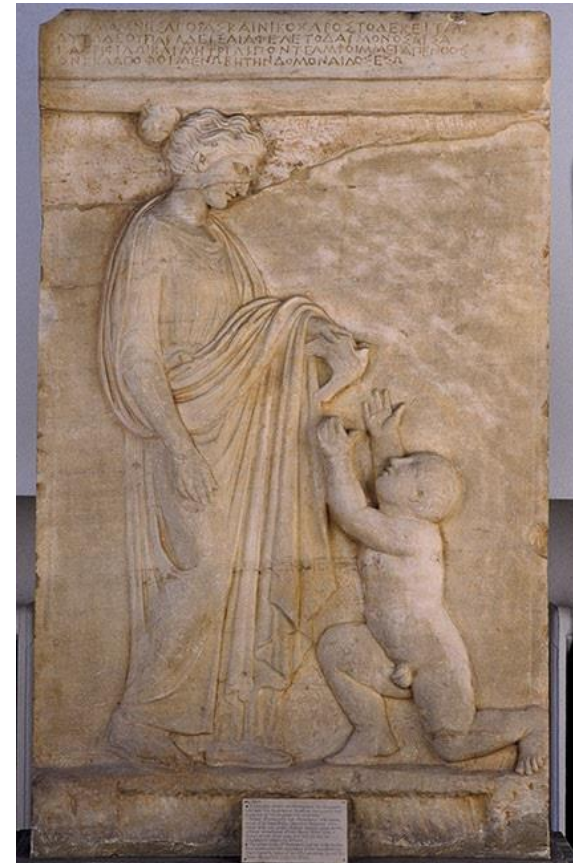
Μαρμάρινη επιτύμβια στήλη της Μνησαγόρας και του Νικοχάρους από τη Βάρη. 420-410 π.Χ.

Στην ώριμη κλασική τέχνη (450-390 π.Χ.) οι μορφές παριστάνονται σε ήρεμες στάσεις, ενώ κυρίως στα γυναικεία αγάλματα τα ενδύματα ελαφραίνουν και αναδεικνύουν την ομορφιά των σωμάτων.