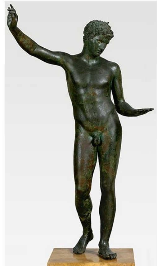
Χάλκινο άγαλμα έφηβου αθλητή, από τη θάλασσα του Μαραθώνα (340-330 π.Χ.)

Στην ύστερη κλασική εποχή (390-323 π.Χ.) οι μορφές κινούνται ελεύθερα στον χώρο, λυγίζουν, γίνονται πιο εύγλωττες, χειρονομούν, τα ενδύματα και τα χτενίσματα είναι πιο πολύπλοκα και η έκφραση των συναισθημάτων πολύ πιο έντονη.