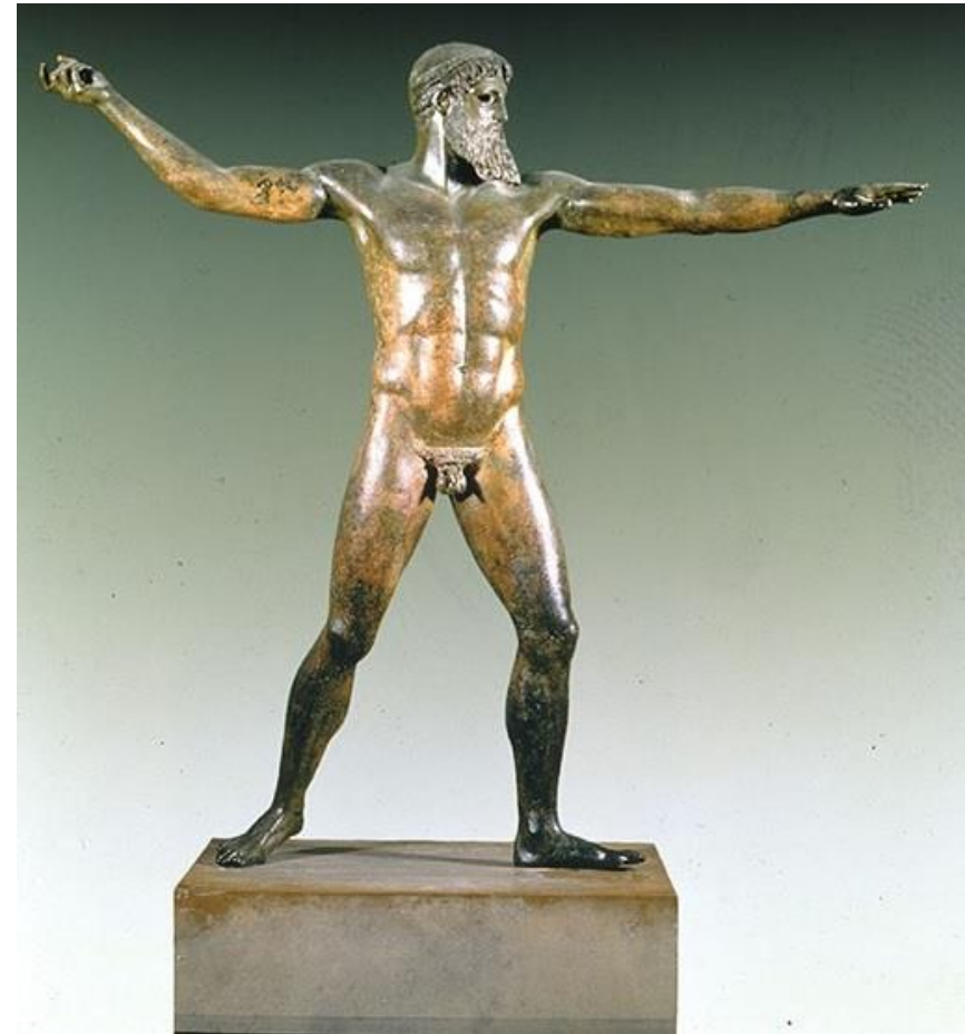
Χάλκινο άγαλμα Διός ή Ποσειδώνος. Βρέθηκε κοντά στο ακρωτήριο Αρτεμίσιο, στη βόρεια Εύβοια. (≈ 460 π.Χ.)