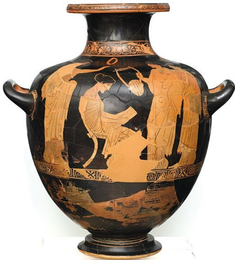
Αττική ερυθρόμορφη υδρία. Ανάγνωση ποίησης της Σαπφούς. Από τη Βάρη Αττικής. Ομάδα Πολυγνώτου. 440-430 π.Χ.