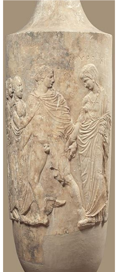
Εικόνα δεξιά: η μαρμάρινη επιτύμβια λήκυθος της Μυρρίνης, Αθήνα, 420-410 π.Χ.