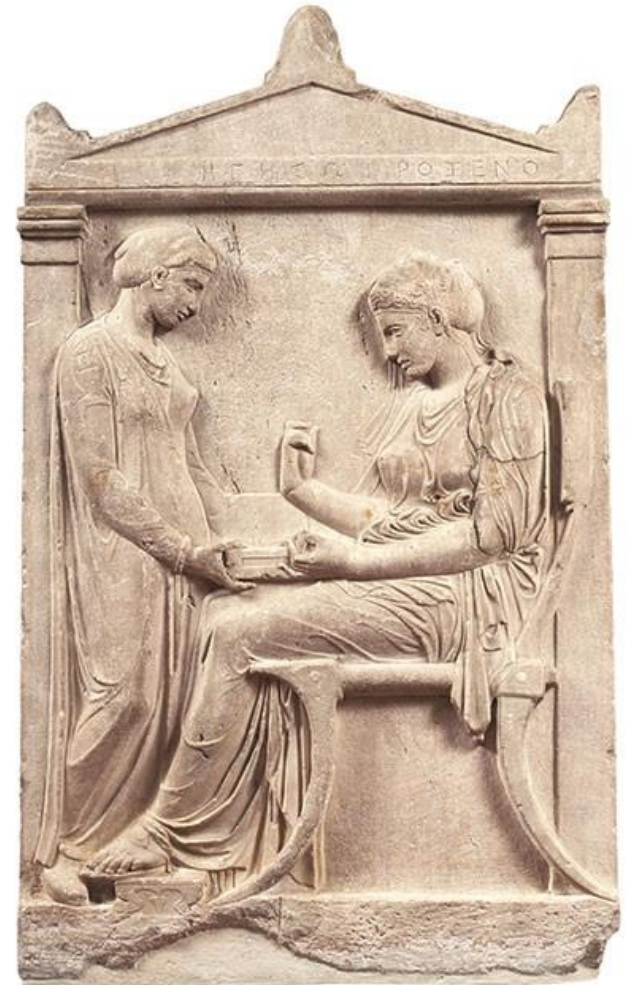
Η μαρμάρινη επιτύμβια στήλη της Ηγησούς, από τον Κεραμεικό της Αθήνας 410–400 π.Χ.