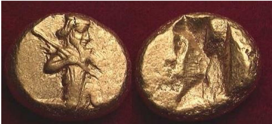
Χρυσός δαρεικός στατήρας, 450-330 π.Χ.

Η αυτοκρατορία πρέπει να έχει ένα ενιαίο νόμισμα, έτσι καταργεί τους δαρεικούς , τα παλιά βαριά περσικά νομίσματα και τα αντικαθιστά με τη δραχμή.