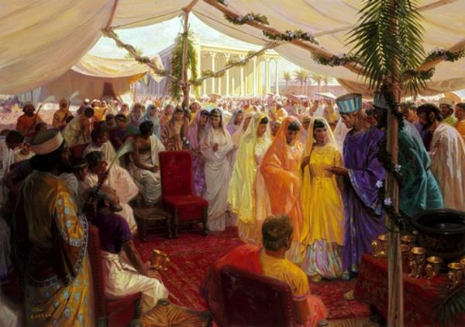
ΟΙ ΜΑΖΙΚΟΙ ΓΑΜΟΙ ΣΤΑ ΣΟΥΣΑ – Πίνακας του Tom Lovell