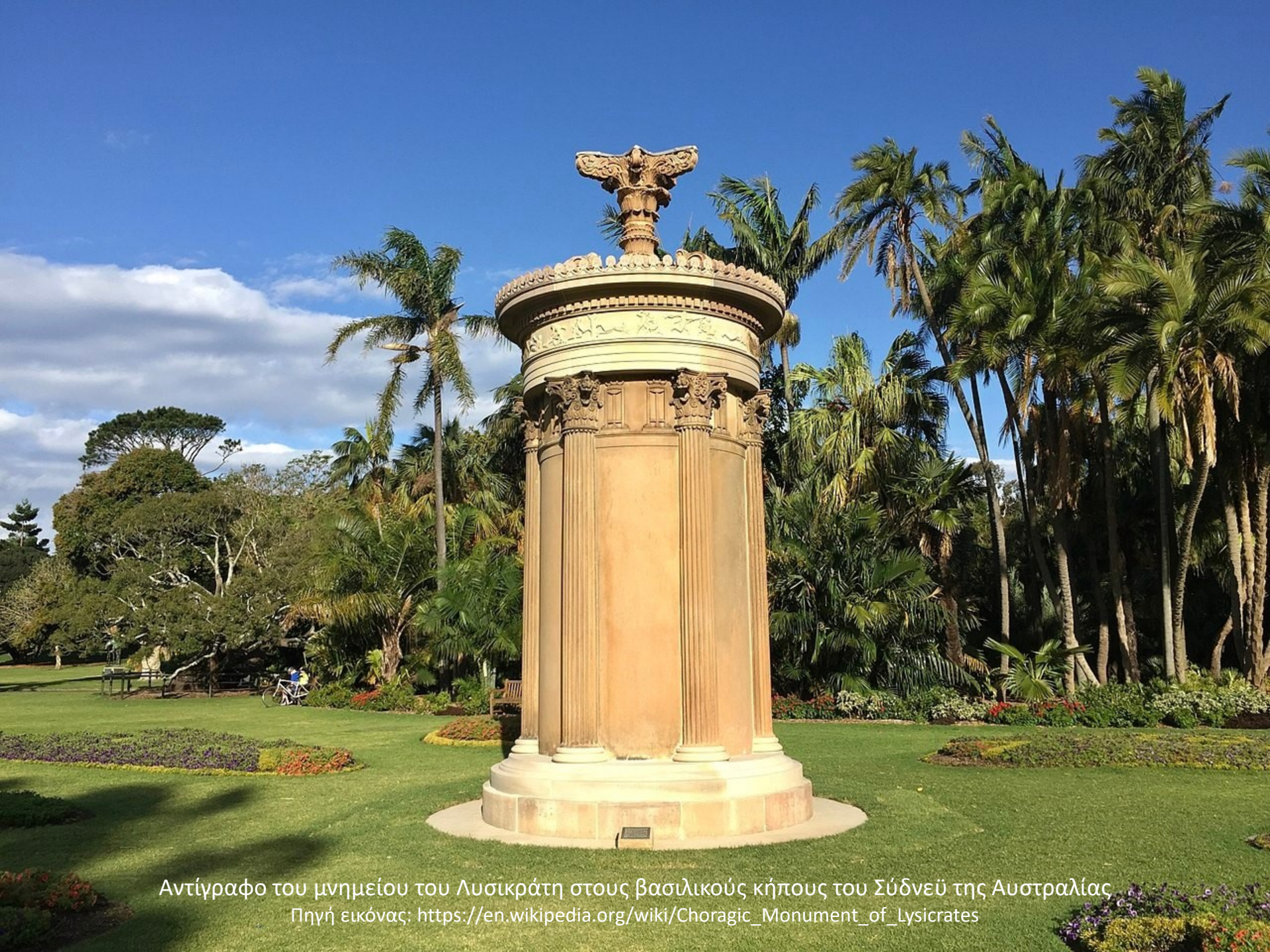
Αντίγραφο του μνημείου του Λυσικράτη στους βασιλικούς κήπους του Σύδνεϋ της Αυστραλίας