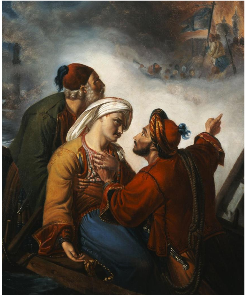
Μεταφορά τραυματία από τη μάχη Άγνωστου καλλιτέχνη Συλλογή Ιδρύματος Ε. Κουτλίδη Εθνική Πινακοθήκη-Μουσείο Αλεξάνδρου Σούτσου Παράρτημα Ναυπλίου

μάνα μ', δεν κλαις τα νεάτα μου, και την παλικαριά μου, μον' κλαις τα 'ρημα τ' άρματα, τα έρημα τσαπράζια».