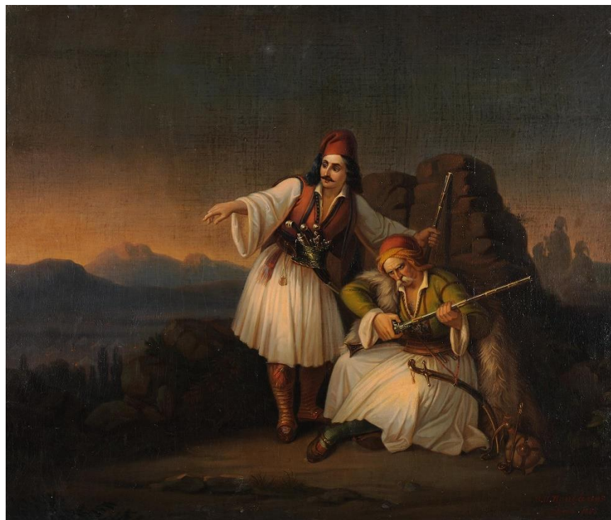
Δύο πολεμιστές, 1855

Τρία πουλάκια κάθονταν στην ράχην στο λημέρι, το 'να τηράει τον Αλμυρό, τ' άλλο κατά τον Βάλτο, το τρίτο το καλύτερο μοιριολογάει και λέγει: Κύριε μου, τι εγίνηκεν ο Χρίστος ο Μιλιόνης; Ουδέ στον Βάλτο φάνηκεν, ουδέ στην Κρύαν Βρύσιν' μας είπαν πέρα πέρασε κι επήγε προς την Άρταν, κι επήρε σκλάβον τον κατήν μαζί με δυο αγάδες. Κι ο μουσελίμης το 'μαθε, βαρεά τον κακοφάνη' τον Μαυρομάτην έκραξε και τον Μουχτάρ Κλεισούραν. «Εσείς αν θέλετε ψωμί, αν θέλετε πρωτάτα, τον Χρίστον να σκοτώσετε, τον καπιτάν Μιλιόνη' τούτο προστάζ' ο βασιλεάς, κι έστειλε φερμάνι». Παρασκευή ξημέρωνε, ποτέ να μη 'χε φέξει' κι ο Σουλεϊμάνης στάλθηκε να πάγει να τον εύρει. Στον Αρμυρό τον έφθασε κι ως φίλοι φιληθήκαν' ολονυκτίς επίνανε, όσον να ξημερώσει, κι όταν εφάνηκ' η αυγή πέρασαν στα λημέρια. Κι ο Σουλεϊμάνης φώναξε του καπιτάν Μιλιόνη' «Χρίστο, σε θέλ' ο βασιλεάς, σε θέλουν οι αγάδες». «Όσο 'ν' ο Χρίστος ζωντανός, Τούρκους δεν προσκυνάει». Με τα τουφέκια έτρεξαν ο ένας προς τον άλλον' φωτιάν εδώσαν στην φωτιάν, κι έπεσαν στον τόπο.