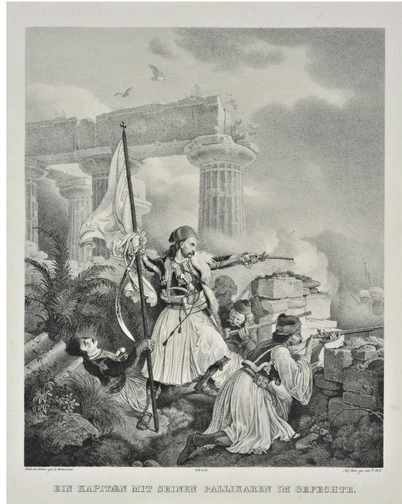
ΕΙΝ ΚΑΡΠΤΑΝ ΜΙΤ ΣΕΙΝΕΝ ΠΑΛΛΙΚΑΡΕΝ ΙΜ ΟΕΦΕΧΤΕ.

Προσκύνα, Λιάκο, τον πασιά, προσκύνα τον βεζίρη, να πάρεις τον μουρασελέ, δερβέναγας να γένεις. Κι αυτείνος τ' απεκρίθηκε, χαμπέρια και του στέλλει «Όσο 'ν' ο Λιάκος ζωντανός, πασιά δεν προσκυνάει πασιά 'χ' ο Λιάκος το σπαθί, βεζίρη το τουφέκι». Κι Αλή πασιάς σαν το 'μαθε, πολύ του κακοφάνη, γράφει χαρτιά και προβοδά, προστάγματα και στέλνει. «Σ' εσέν' αγά δερβέναγα' σ' όλα τα τζεφτιλίκια τον Λιάκο να μου πιάσετε, τον Λιάκο να σκοτώστε». Βγήκε κι ο Γκέκας παγανιά και κυνηγά τους κλέφτες, κι επήγε και τους πλάκωσε στον λόγγο του λημέρι, κι αρχίσανε τον πόλεμον, τα βροντερά τουφέκια. Κοντογιακούπης φώναξε από το μετερίζι. «Παιδιά, γκαριέτι κάμετε, παιδιά ντε πολεμάτε, κι εσύ, Λιάκο μπολούμπαση, πολέμα σαν λιοντάρι». Κι ο Μουσταφάς λαβώθηκε στο γόνυ και στο χέρι. Ο Λιάκος έτρεξεν εμπρός με το σπαθί στο στόμα ημέραν, νύχτα πολεμούν, τρεις μέρες και τρεις νύχτες. Κλαίουν οι Αρβανίτισσες, τα μαύρα φορεμένες κι ο Βελη-Γκέκας γύρισε στο αίμα του πνιγμένος.