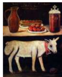
ΠΑΣΧΑΛΙΑΤΙΚΟ ΑΡΝΙ ΝΙΚΟ ΠΙΡΟΣΜΑΝΙ