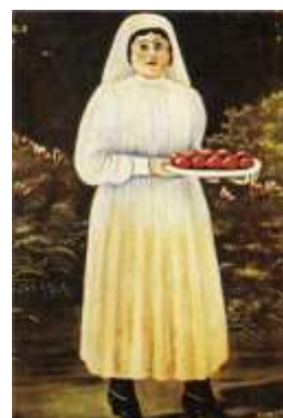
ΓΥΝΑΙΚΑ ΜΕ ΠΑΣΧΑΛΙΑΤΙΚΑ ΑΥΓΑ ΝΙΚΟ ΠΙΡΟΣΜΑΝΙ