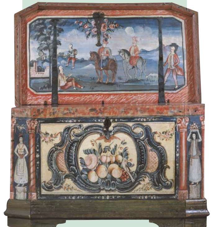
Ξύλινη ζωγραφιστή κασέλα με παράσταση έφιππων Οθωμανών και ευρωπαϊκά ντυμένων πεζών από τη Μυτιλήνη, τέλη 18ου αιώνα.