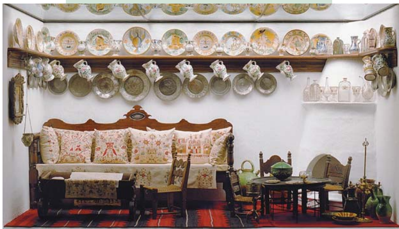
Αναπαράσταση καθιστικού σκυριανού σπιτιού με κεντήματα του 17ου-18ου αιώνα, κεραμικά και γυάλινα του 18ου αιώνα και ξυλόγλυπτα του 19ου αιώνα.