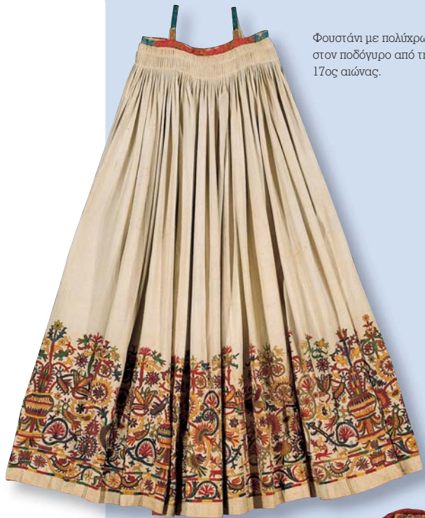
Φουστάνι με πολύχρωμα κεντήματα στον ποδόγυρο από την Κρήτη, 17ος αιώνας.