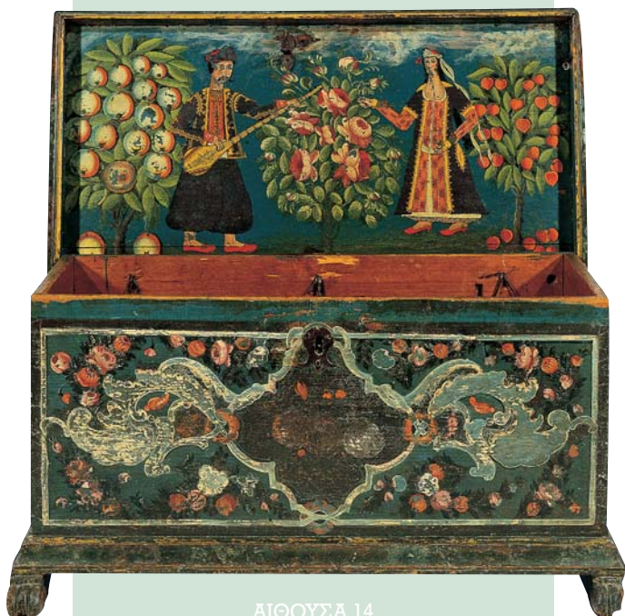
Ξύλινη ζωγραφιστή κασέλα με παράσταση ζευγαριού σε ανθισμένο κήπο από τη Μυτιλήνη, τέλη 18ου - αρχές 19ου αιώνα.