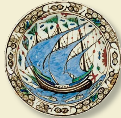
Πιάτο με παράσταση ιστιοφόρου από τη Νίκαια της Μικράς Ασίας, 1625-1650.

Βγάζω το καπέλο στους πελεκάνους, τους τεχνίτες που με τα εργαλεία τους πελεκούσαν την πέτρα, όχι μόνο για τους φεγγίτες αλλά και για τα άλλα λίθινα αντικείμενα στην ίδια αίθουσα.