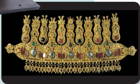
Νυφικό διάδημα από το Πωγώνι της Ηπείρου, 18ος αιώνας, ασήμι επίχρυσο, με χιτές, εγχάρκτες και διάτρητες λεπτομέρειες, σάρδιοι, κοράλια, τυρκουάζ, υαλόμαζα, νιέλλο.