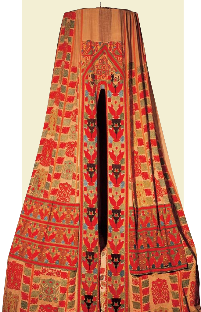
Πολίχρωμο κεντητό σπερβέρι από ροδίτικο σπίτι, 17ος-18ος αιώνας.