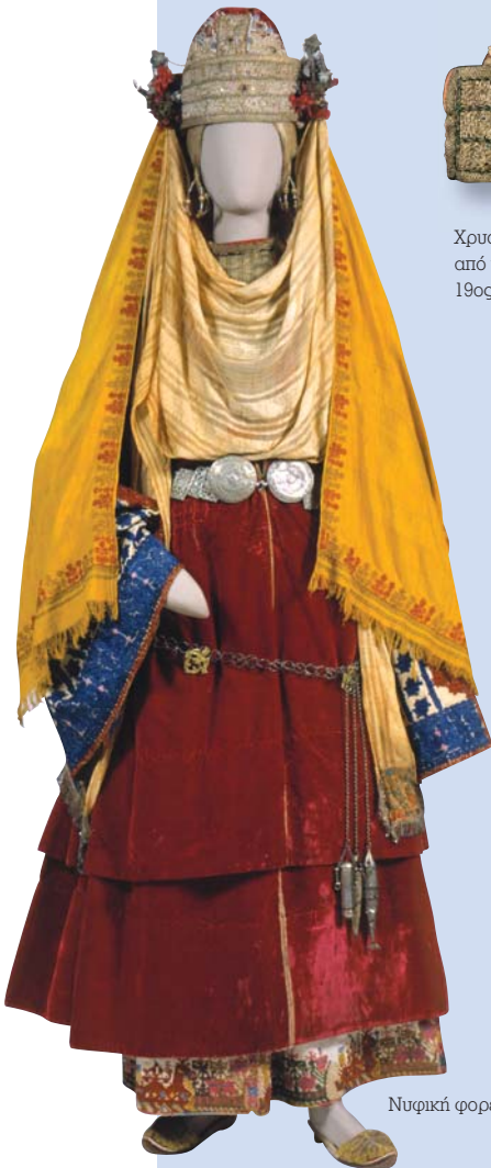
Νυφική φορεσιά από την Αστυπάλαια, 19ος αιώνας.