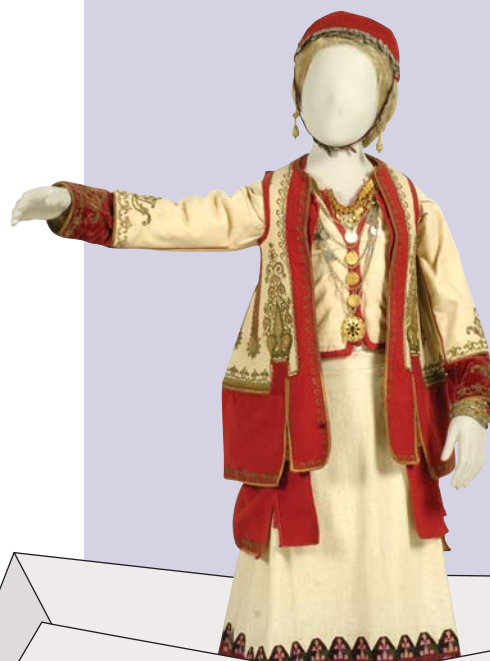
Κοριτσίστικη φορεσιά από την Αττική, τέλη 19ου αιώνα.

Χιλιάδες ερωτήσεις γέμισαν το μυαλό μου. Είχε σωθεί μόνο η φορεσιά της προγιαγιάς; Ή μήπως υπήρχαν κι άλλα πράγματα δικά της, για να ζωντανέψουν την εικόνα της, που ύστερα από τόσο καιρό έφτανε μάλλον θαμπιά και ξεθωριασμένη ως εμένα; Έπρεπε να ψάξω. Η περιήγηση στη Νεοελληνική συλλογή του Μουσείου Μπενάκη με είχε χωρίς αμφιβολία βοηθήσει. Όχι μόνο να μάθω πώς ζούσαν εκείνα τα χρόνια αλλά και να ξεκαθαρίσουν εντελώς τα πράγματα μέσα μου. Τώρα έβλεπα με χαρά πόσο αυτή η φορεσιά ταιριάζει με τις άλλες, μέσα στη σάλα του υδραϊκού αρχοντικού, αλλά και με όλες τις υπόλοιπες, στις προηγούμενες αίθουσες. Πόσο νόημα έχει τελικά η παρουσία της ανάμεσα στα τόσα αντικείμενα που εκπροσωπούν μια ολόκληρη εποχή, την εποχή της προγιαγιάς μου.