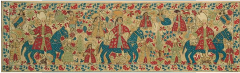
Νυφικό μαξιλάρι με παράσταση γάμου από τα Ιωάννινα, 17ος-18ος αιώνας.