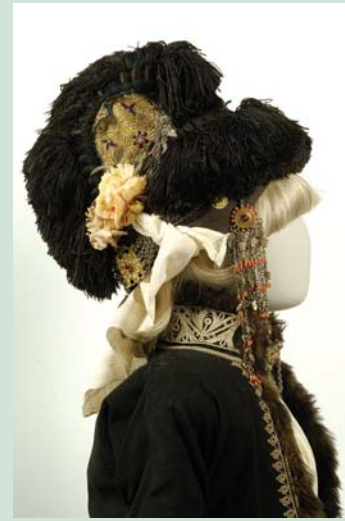
Νυφικός κεφαλόδεσμος από το Ρουμλούκι της κεντρικής Μακεδονίας, τέλη 19ου αιώνα.

Με το νερό σχετίζονται και τα πρασινωπά κανατάκια με τα περίεργα σχήματα στην προθήκη 1. Ανάμεσά τους ξεχωρίζω ένα που θυμίζει ..... και κάποιο άλλο που έχει τη μορφή ..... Θραύση θα έκαναν στα σπίτια του καιρού τους. Φτιάχτηκαν στο Τσανάκ - Καλέ στα Δαρδανέλια και αγοράστηκαν ως ενθύμια από Έλληνες ναυτικούς που έφταναν εκεί για να ανεφοδιάσουν τα καράβια τους.