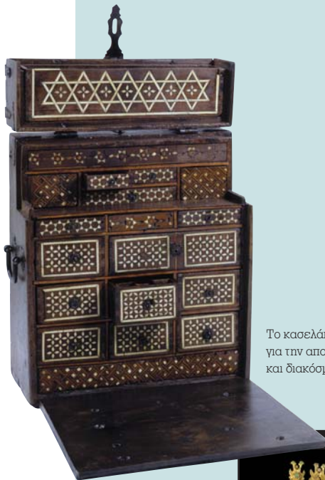
Το κασελάκι του χρυσοκόου με πολλά μικρά συρτάρια για την αποθήκευση των εργαλείων και υλικών και διακόσμηση από ένθετο κόκκαλο, 19ος αιώνας.