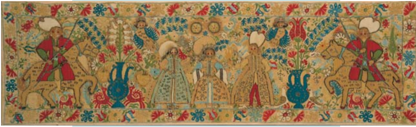
Νυφικό μαξιλάρι με παράσταση γάμου από τα Ιωάννινα, 17ος-18ος αιώνας.