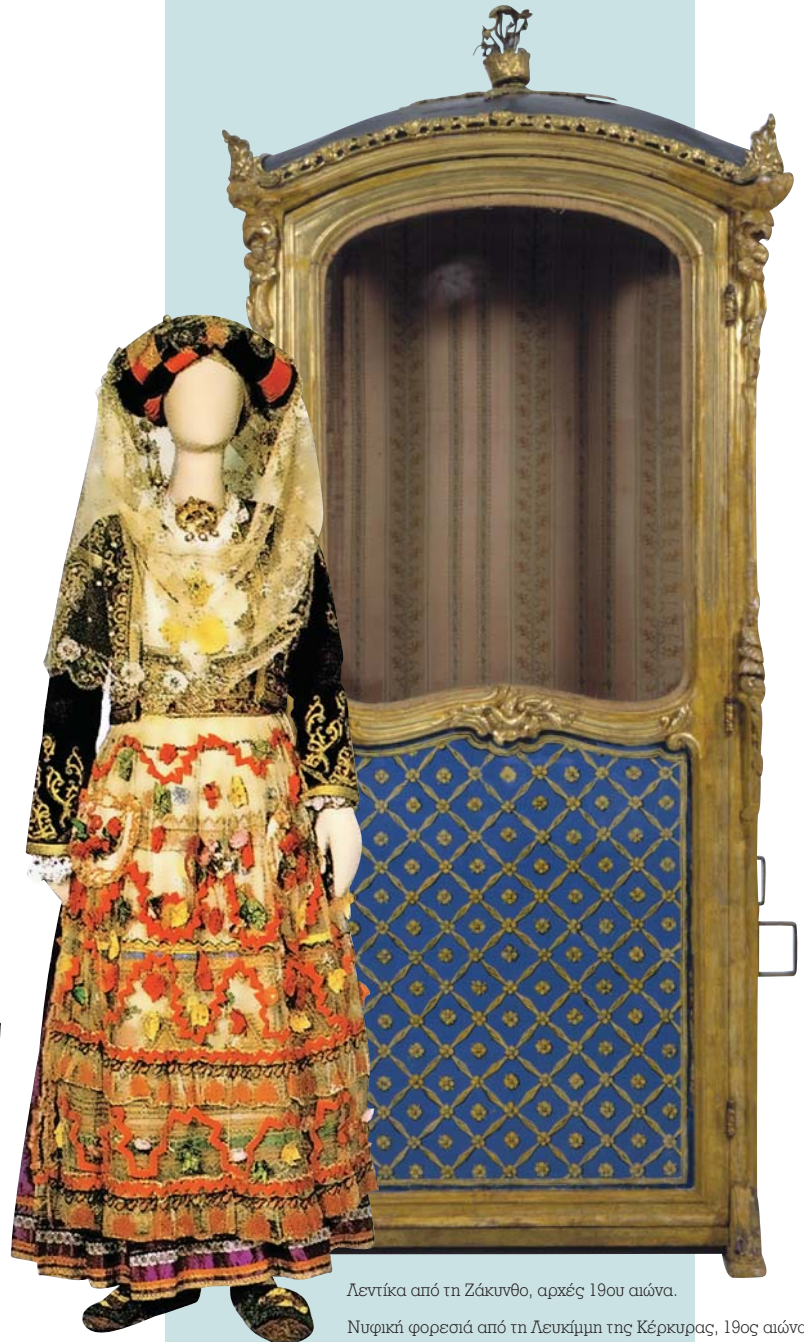
Λεντίκα από τη Ζάκυνθο, αρχές 19ου αιώνα.