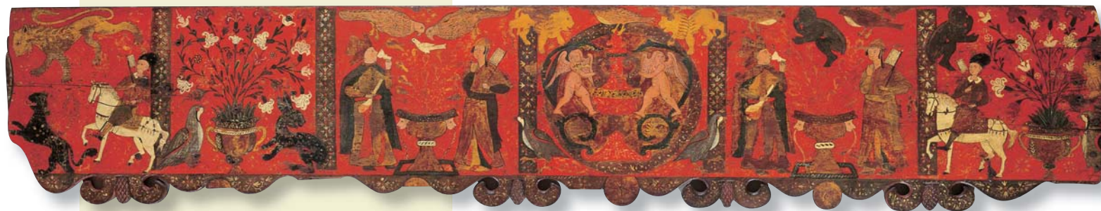
Ξυλόγλυπτη ζωγραφιστή επένδυση από τη Ρόδο, τέλη 17ου αιώνα.

Το ροδίτικο σπίτι φαίνεται ότι κρύβει πολλές ακόμη εκπλήξεις. Σαν κι αυτή, απέναντι από το "σπερβέρι", με τις ξυλόγλυπτες ζωγραφιστές επενδύσεις. Γίνεται να χωρέσει ένας ολόκληρος κόσμος πάνω σε τρία κομμάτια ξύλο; Για το ζωγράφο που δε δίστασε σε κόκκινο φόντο να συνδυάσει ..... .....φαίνεται ότι όλα γίνονταν.