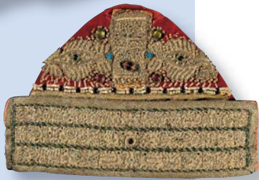
Χρυσοκεντημένη σκούφια με μαργαριτάρια από το νυφικό κεφαλόδεσμο της Αστυπάλαιας, 19ος αιώνας.