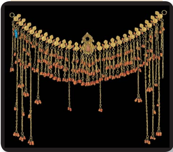
Επιμετώπο κόσμημα από τη Σαφράμπολη της Μικράς Ασίας, α΄ μισό 19ου αιώνα, ασήμι επίχρυσο, χιτά στοιχεία με συρματερό διάκοσμο, κοράλλια, υαλόμαζα.

Κοσμήματα σαν κι αυτά με τα χαρακτά κοράλλια και το σμάλτο στην προθήκη 2, πρώτη φορά βλέπω. Ξεφυλλίζω με βιασύνη τον οδηγό. Εδώ μου χρειάζεται οπωσδήποτε. Το δάχτυλό μου σταματά στη σωστή παράγραφο. Οι λίγες γραμμές που ακολουθούν με συναρπάζουν κυριολεκτικά.