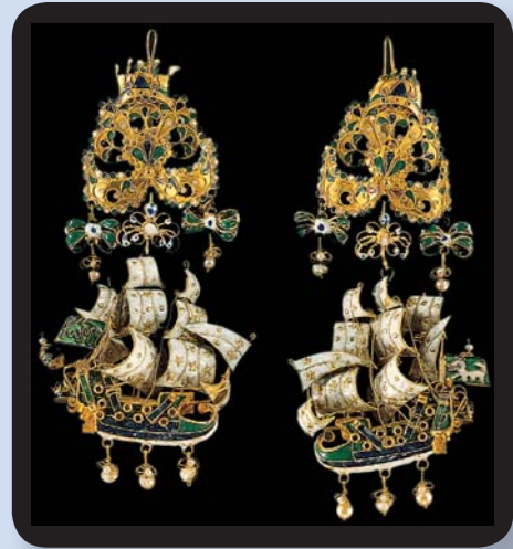
Σκουλαρίκια με κρεμαστές караβέλες από τη Σίφνο, μέσα 17ου αιώνα, χρυσός, πολύχρωμα σμάλτα, μαργαριτάρια.