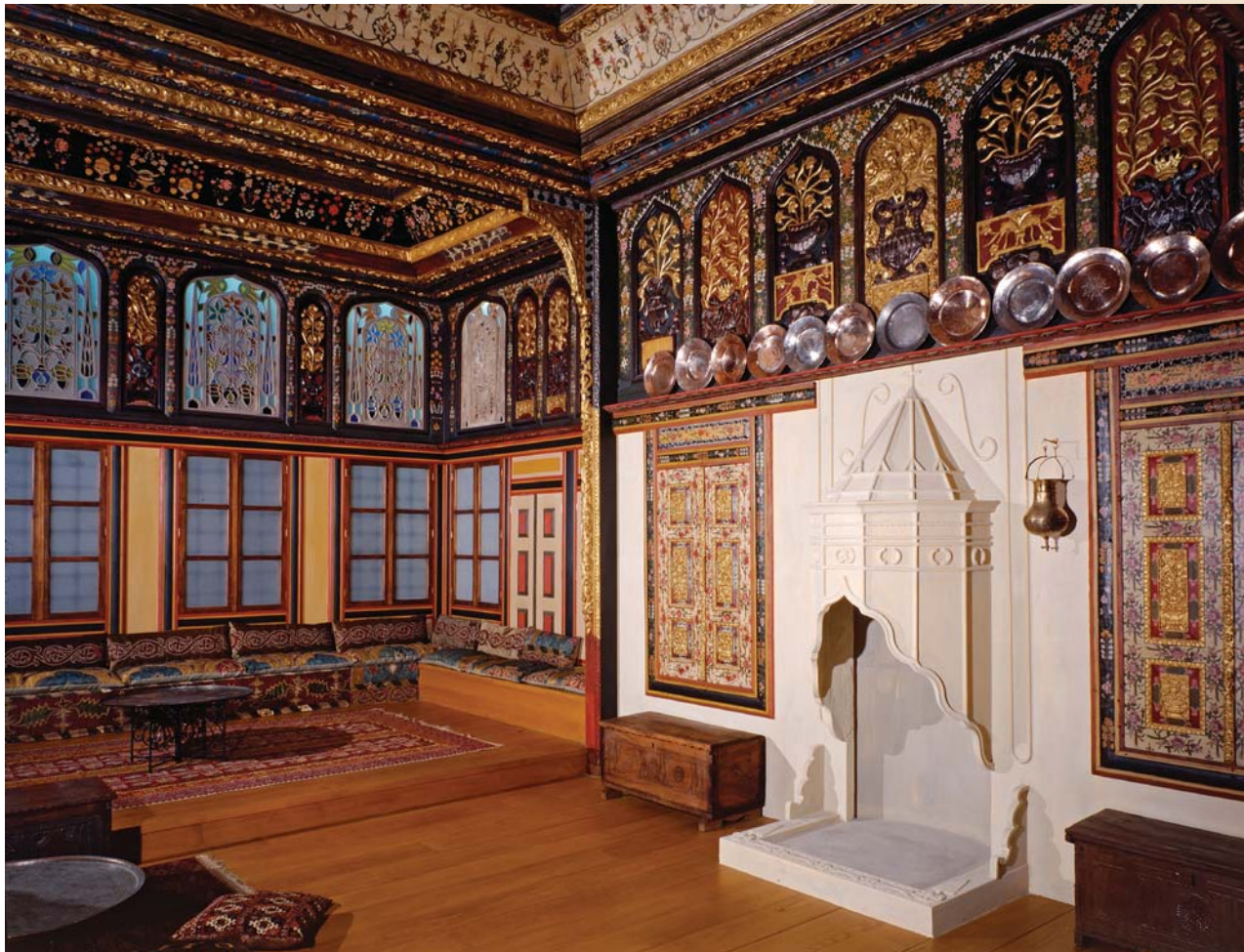
Αίθουσα υποδοχής από αρχοντικό της Κοζάνης, μέσα 18ου αιώνα.