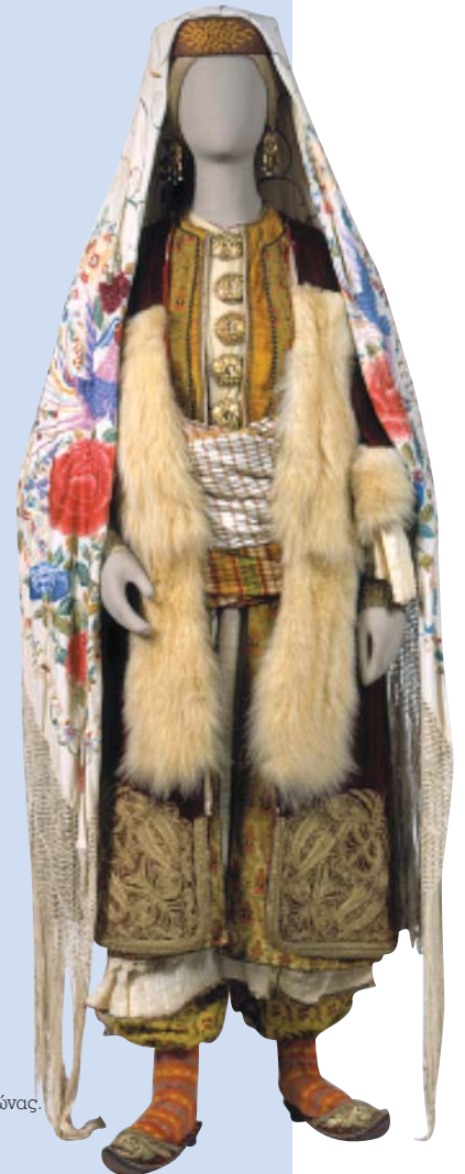
Νυφική φορεσιά από το Καστελόριζο, 19ος αιώνας.