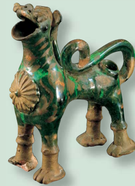
Αγγείο σε σχήμα λιονταριού από το Τσανάκ - Καλέ, 19ος αιώνας.