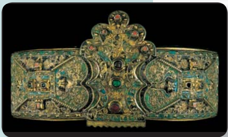
Πόρπη ζώνης από το Σουφλί της Θράκης που φέρει το όνομα ΚΩΣΤΑΝΤΗ στην κύρια όψη και τη χρονολογία 1798, επίχρυσο ασήμι με συρματερό διάκοσμο, ομόλοτο, κοράλια, υαλόμαζα.

Η συνέχεια μου επιφυλάσσει ένα ακόμη μυστήριο. Θα μπορέσω να το λύσω; Πρόκειται για μια ιστορία, σε δυο συνέχειες μάλιστα, "γραμμένη" με βελόνα και πολύχρωμες κλωστές πάνω σε δυο νυφικά μαξιλάρια από τα Ιωάννινα.