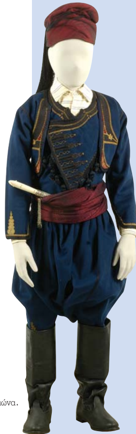
Αγορίστικη φορεσιά από την Κρήτη, αρχές 20ού αιώνα.