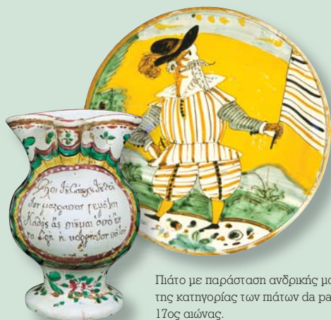
Πιάτο με παράσταση ανδρικής μορφής, της κατηγορίας των πιάτων da parata από την Ιταλία, 17ος αιώνας.