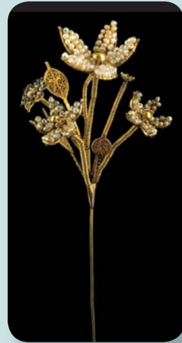
Καρφίτσα κεφαλόδεσμου σε σχήμα μπουκέτου λουλουδιών από τη Λευκάδα, α' μισό 19ου αιώνα, φύλλο χρυσού με συρματερό διάκοσμο, μαργαριτάρια.