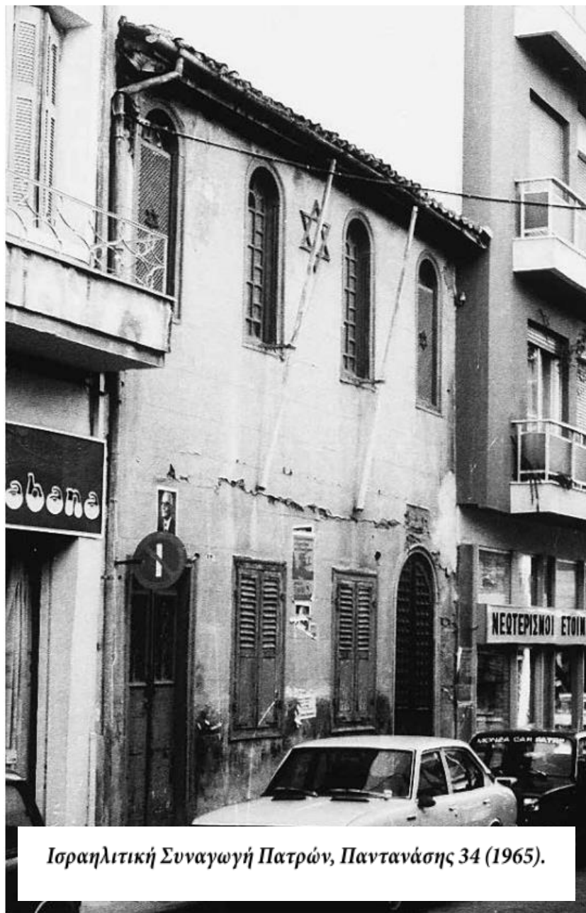
Ισραηλιτική Συναγωγή Πατρών, Παντανάσης 34 (1965).