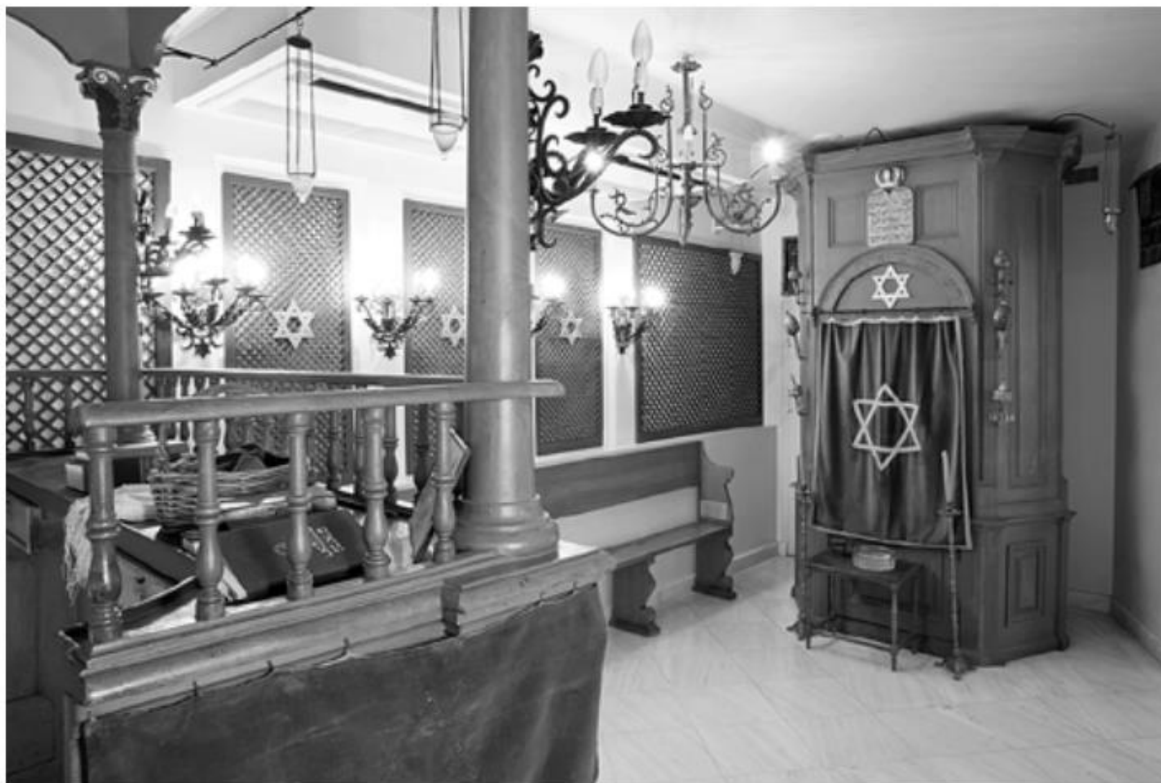
Το εσωτερικό της Συναγωγής των Πατρών, όπως εκτίθεται σήμερα στο Εβραϊκό Μουσείο της Ελλάδος.