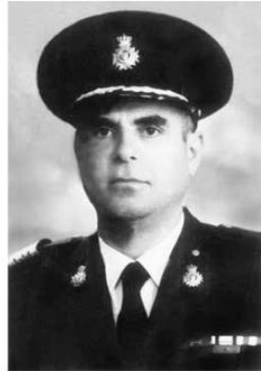
Αστυνομικός Διευθυντής Δημήτριος Μαρινάκης