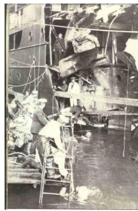
Επισκευή γερμανικού πολεμικού πλοίου στο λιμάνι της Θεσσαλονίκης