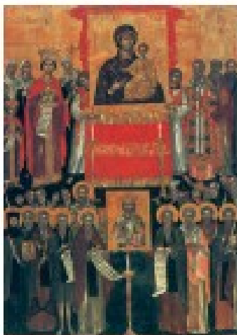
2. Η Αναστήλωση των εικόνων. (Φωτογρ. εικόνα 16ου αι., Μουσείο Μπενάκη)

Ο διχασμός αυτός κράτησε έναν περίπου αιώνα και είχε δυσάρεστες συνέπειες για όλους. Στη διάρκειά του πολλοί άνθρωποι έχασαν τη ζωή τους και άλλοι φυλακίστηκαν ή εξορίστηκαν. Ναοί και μοναστήρια έκλεισαν και πολλές εικόνες, ψηφιδωτά και έργα τέχνης καταστράφηκαν. Διαταράχτηκαν ακόμη οι σχέσεις ανάμεσα στο Βυζάντιο και τη Δυτική εκκλησία, η οποία τάχτηκε με το μέρος των εικονολατρών.