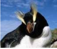
Πιγκουίνος των νησιών Όκλαντ