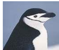
Πυγοσκελής της Ανταρκτικής