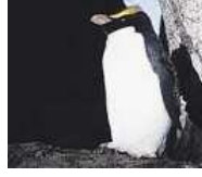
Πιγκουίνος του Φιόρντλαντ