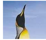
Βασιλικός Πιγκουίνος (King)