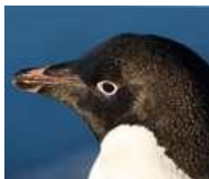
Πιγκουίνος της Αδελίας

Φωτογραφίες από διαφορετικά είδη πιγκουίνων: