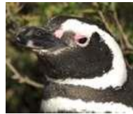
Πιγκουίνος του Μαγγελάνου