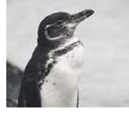
Πιγκουίνος των νησιών Γκαλαπάγκος