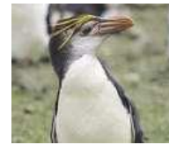
Βασιλικός Πιγκουίνος (Royal)

Οι μεγαλύτεροι σε μέγεθος πιγκουίνοι έχουν την ικανότητα να διατηρούν τη θερμότητα του σώματός τους πιο αποτελεσματικά και γι' αυτό μπορούν να ζήσουν σε ψυχρότερα κλίματα, σε αντίθεση με τους μικρότερους που εντοπίζονται στα εύκρατα ή και τροπικά κλίματα.