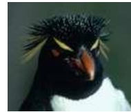
Νότιος Βραχώδης Πιγκουίνος