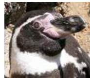
Πιγκουίνος του Χούμπολτ