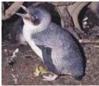
Μικρός Μπλε Πιγκουίνος