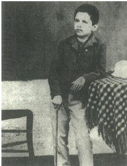
Ο ποιητής σε ηλικία 10 χρονών

Μετά την αποφοίτησή του από το γυμνάσιο εγκαταστάθηκε στην Αθήνα το 1875, όπου γράφτηκε στην Νομική Σχολή. Σύντομα όμως εγκατέλειψε τις σπουδές του αποφασισμένος να ασχοληθεί με τη λογοτεχνία. Το πρώτο του ποίημα το είχε γράψει σε ηλικία 9 ετών, μιμούμενος τα πρότυπα της εποχής του, «ποίημα για γέλια», όπως το χαρακτήρισε αργότερα ο ίδιος. Από το 1875 δημοσίευε σε εφημερίδες και περιοδικά διάφορα ποιήματα, φιλολογικά άρθρα, κριτικές και χρονογραφήματα. Το 1876 υπέβαλε στον Βουτσιναίο ποιητικό διαγωνισμό την ποιητική συλλογή Ερώτων Έπη , σε καθαρεύουσα, με σαφείς τις επιρροές της Α' Αθηναϊκής Σχολής. Η συλλογή απορρίφθηκε με το χαρακτηρισμό "λογιωτάτου γραμματικού ψυχρότατα στιχουργικά γυμνάσματα". Η πρώτη του αυτοτελής έκδοση ήταν το 1878 το ποίημα "Μεσολόγγι". Από το 1898 εκείνος και οι δύο φίλοι και συμφοιτητές του Νίκος Καμπάς (με τον οποίο μοιραζόταν το ίδιο δωμάτιο) και Γεώργιος Δροσίνης άρχισαν να συνεργάζονται με τις πολιτικές-σατιρικές εφημερίδες "Ραμπαγάς" και "Μη Χάνεσαι". Οι τρεις φίλοι είχαν συνειδητοποιήσει την παρακμή του αθηναϊκού ρομαντισμού και με το έργο τους παρουσίαζαν μια νέα ποιητική πρόταση, η οποία βέβαια ενόχλησε τους παλαιότερους ποιητές, που τους αποκαλούσαν περιφρονητικά "παιδαρέλια" ή ποιητές της "Νέας Σχολής".