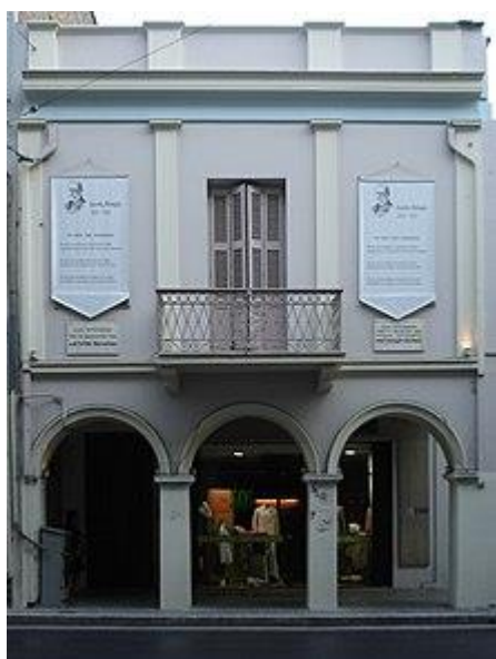
Το σπίτι του Παλαμά στην Πάτρα

Όταν ο ποιητής ήταν σε ηλικία 6 ετών έχασε και τους δύο γονείς του σε διάστημα σαράντα ημερών (Δεκέμβριος 1864 - Φεβρουάριος 1865). Στενοί συγγενείς ανέλαβαν τότε τα τρία παιδιά της οικογένειας, το μικρότερο αδερφό του η αδερφή της μητέρας του και εκείνον και το μεγαλύτερο αδερφό του ο θείος τους Δημήτριος Παλαμάς, που κατοικούσε στο Μεσολόγγι και ήταν εκπαιδευτικός. Εκεί έζησε από το 1867 ως το 1875 σε ατμόσφαιρα μάλλον δυσάρεστη και καταθλιπτική, που ήταν φυσικό να επηρεάσει τον ευαίσθητο ψυχισμό του, όπως φαίνεται και από ποιήματα που αναφέρονται στην παιδική του ηλικία.