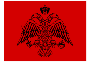
Η σημαία του Κροκόδειλου Κλαδά

Η οικογένεια Κλαδά, Έλληνες από την Χιμάρα της σημερινής Αλβανίας ζούσαν στην Μάνη, στην υπηρεσία των Παλαιολόγων. Μετά την Άλωση της Κωνσταντινούπολης, ο Κροκόδειλος Κλαδάς πολέμησε στο πλευρό των Βενετών εναντίον των Τούρκων. Όταν οι Βενετοί συνθηκολόγησαν με τους Τούρκους, ο Κλαδάς συνέχισε να αγωνίζεται μόνος του. Το 1490 οι Τούρκοι τον συνέλαβαν και τον σκότωσαν με μαρτυρικό θάνατο.