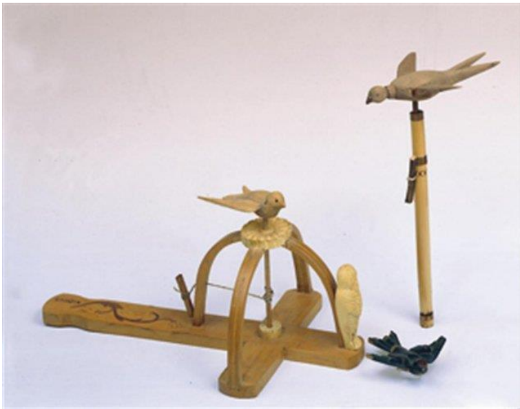
Εικόνα 1 Αντίγραφο Χελιδόνας στο Μουσείο Μπενάκη

. Από ημέρες πριν, τα παιδιά 7-12 ετών ετοιμάζονταν εντατικά γι' αυτή τη γιορτή. Η κάθε ομάδα έκανε μια ξύλινη χελιδόνα την οποία τοποθετούσε σε ένα μικρό «ξύλινο κλουβί» όπως φαίνεται στην εικόνα: