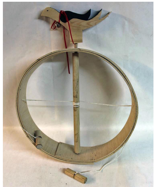
Εικόνα 2 Χελιδόνα από το λαογραφικό μουσείο στην Πελοπόννησο

Την κατασκευή της χελιδόνας σε κάποιες περιοχές την στόλιζαν με φύλλα κισσού, σε άλλες με ζουμπούλια ή άλλα λουλούδια της Άνοιξης.