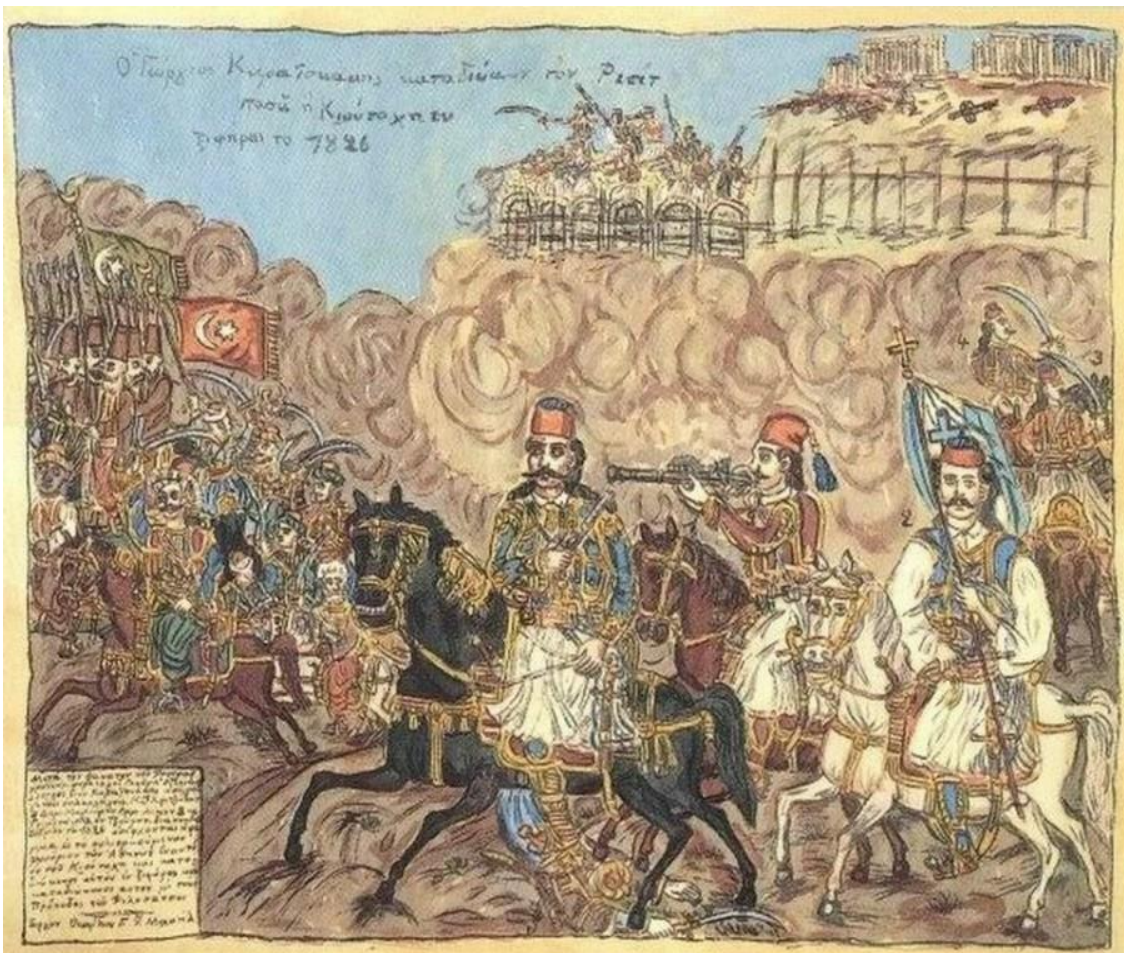
Δράσεις για τον εορτασμό των 200 χρόνων από την Επανάσταση του 1821