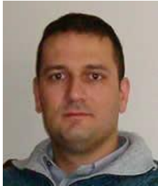
Ηλίας Αβραμίδης Μεθοδολογία Έρευνας