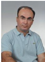
Φίλιππος Βλάχος Ψυχοβιολογία