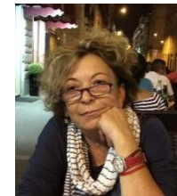
Λένα Γκανά Γραπτός Λόγος