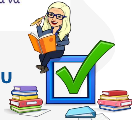
Τριανταφυλλιά Σύβακα Πρέσβειρα eTwinning Δυτικής Θεσσαλονίκης