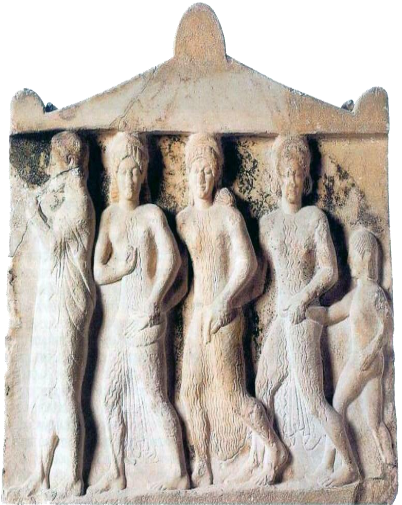
«Καλίκομοι κόραι Διός ωρχησαντ' ελαφρώς...» Μουσείον Ακροπόλεως.