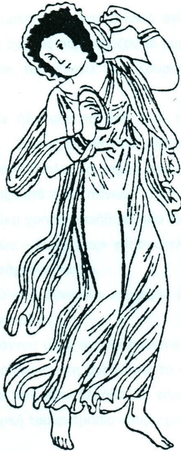
Χορεύτρια με κύμβαλλα. Από παράσταση αγγείου του 4ου αι. π.Χ.