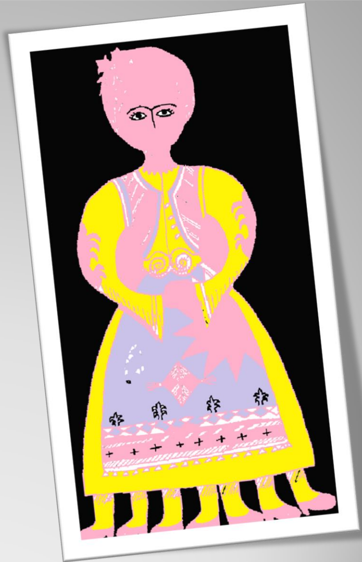
Παναγιώτα και Δήμητρα

Χρησίμευε πάντα ως ημερολόγιο για να μετράμε τις εβδομάδες από την Καθαρά Δευτέρα μέχρι τη Μεγάλη Εβδομάδα, καθώς η κυρά Σαρακοστή έχει 7 πόδια, ένα για κάθε εβδομάδα της περιόδου της Σαρακοστής.