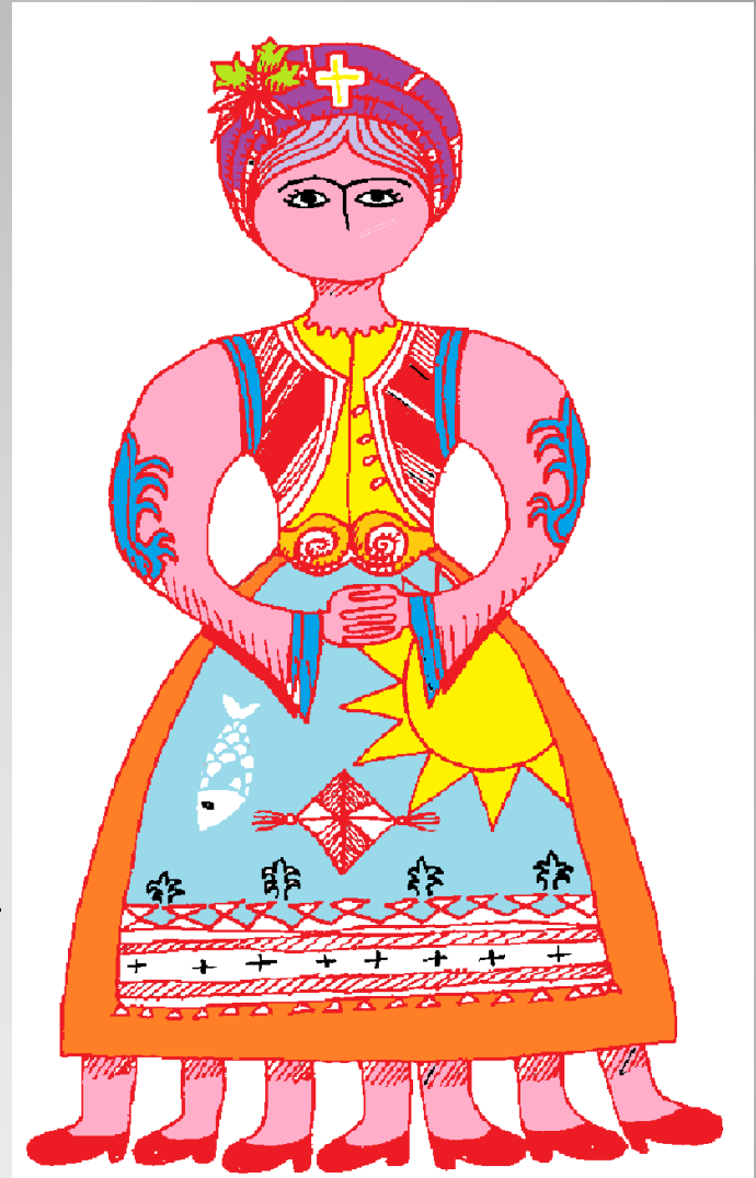
Αναστασία και Δήμητρα

Αλλού, πάλι, την έφτιαχναν από πανί και τη γέμιζαν με πούπουλα.