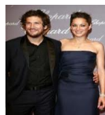
Marion Cotillard & Guillaume Canet