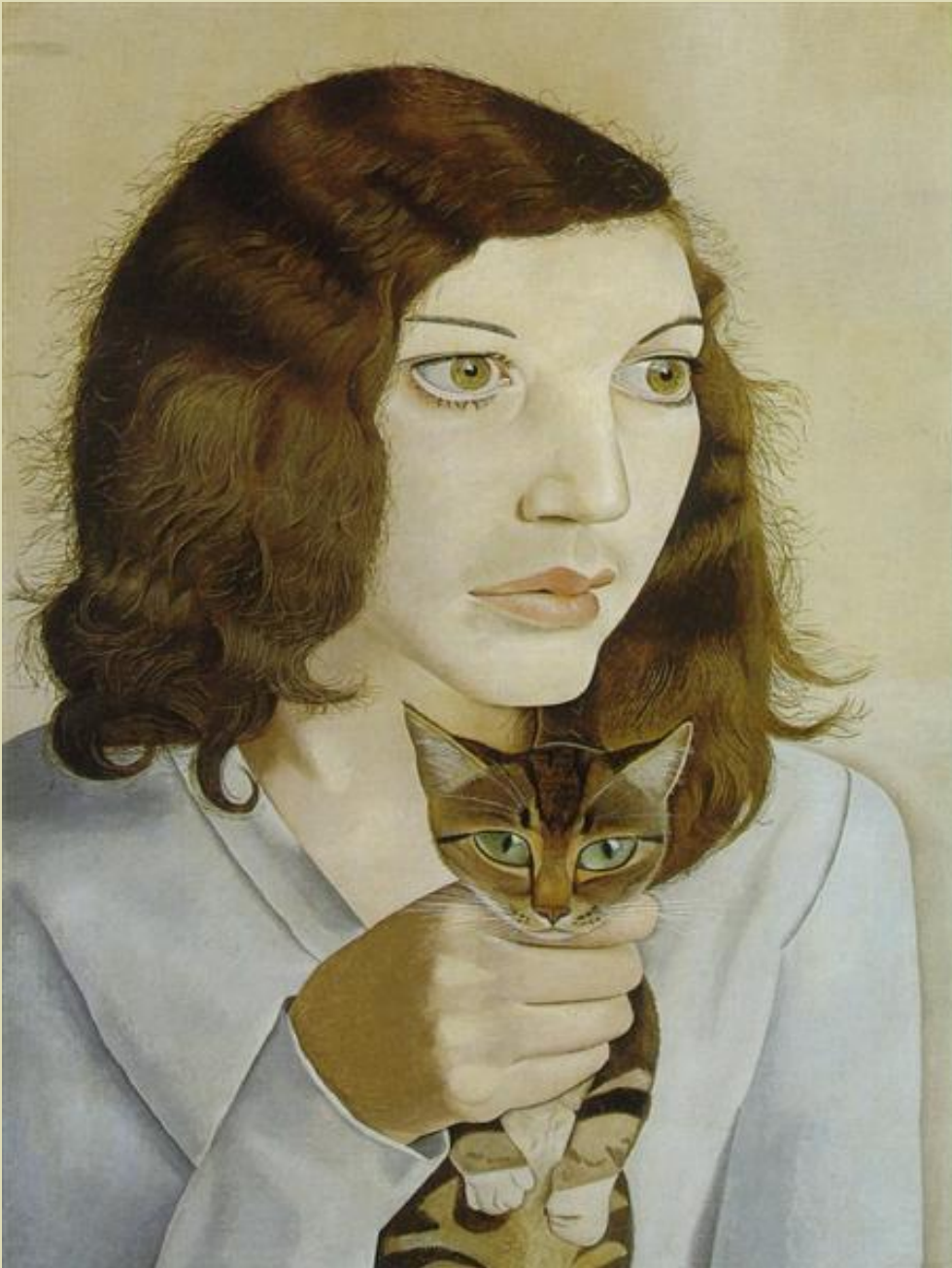
Lucian Freud Girl with a Kitten (1947)