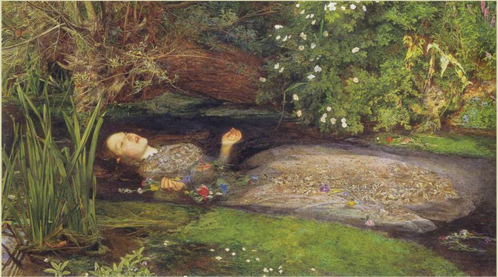
John Everett Millais Ophelia (1852)