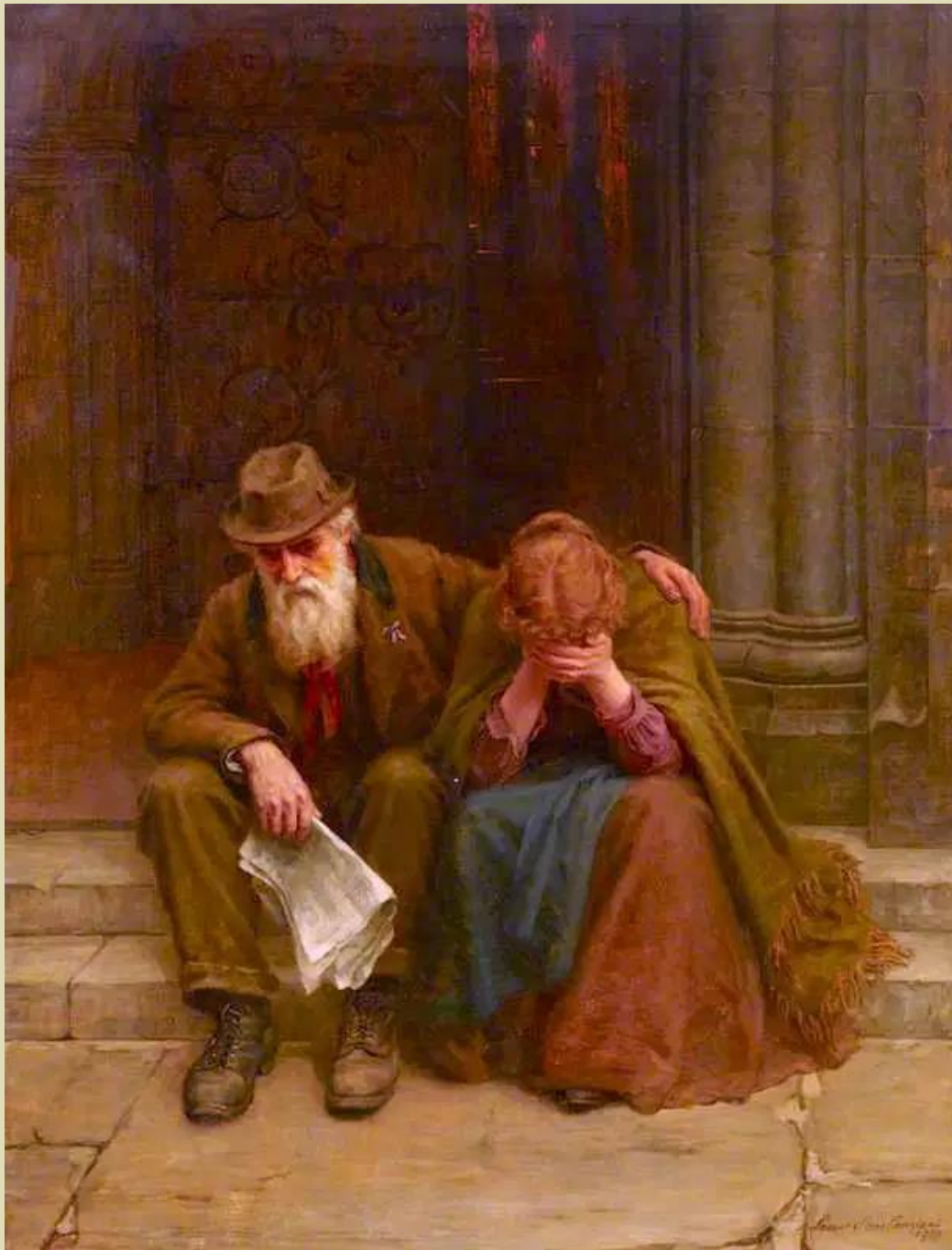
Louisa Starr Canziani War News (1900)