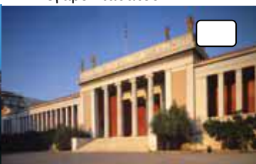
Εθνικό Αρχαιολογικό Μουσείο