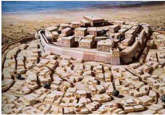
Η Τροία με τα τείχη της