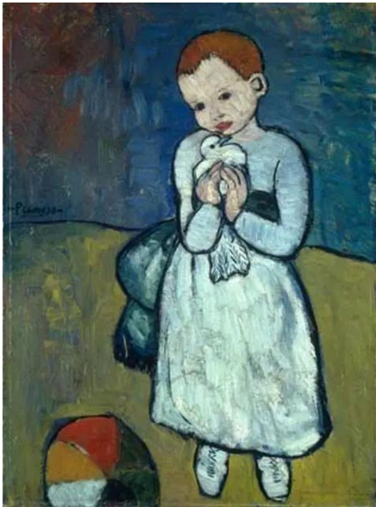
«Το παιδί με το περιστέρι» ~ Pablo Picasso