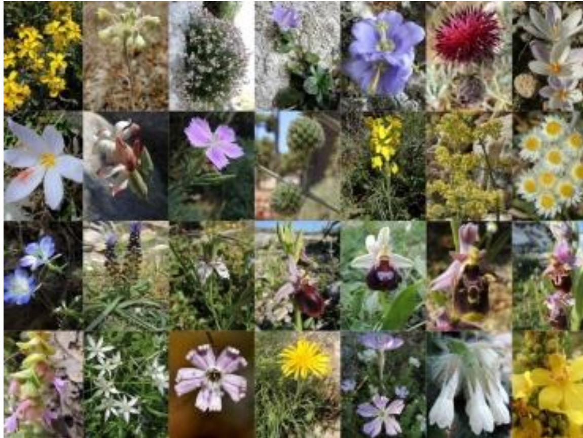
Η βλάστηση της Ελλάδας (κυρίως Μεσογειακή)