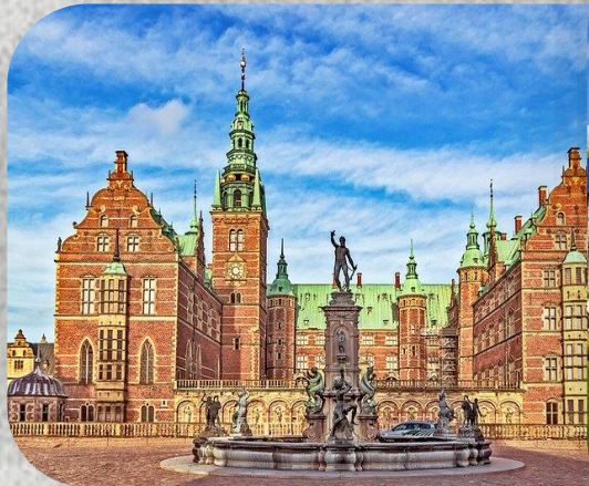
Κάστρο του Φρέντερικσμποργκ, Κοπεγχάγη