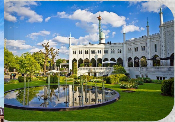
Κήποι Τιβόλι, Κοπεγχάγη