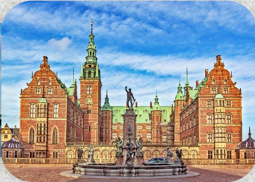
Κάστρο του Φρέντερικσμποργκ, Κοπεγχάγη