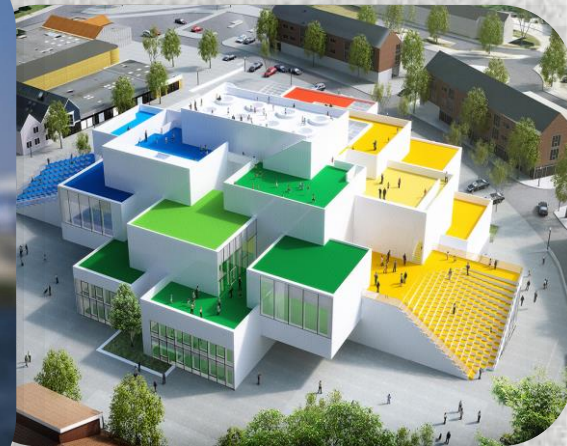
LEGO σπίτι, Μπιλούντ