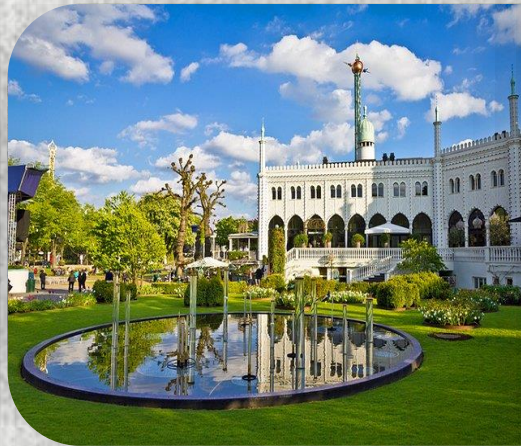
Κήποι Τιβόλι, Κοπεγχάγη