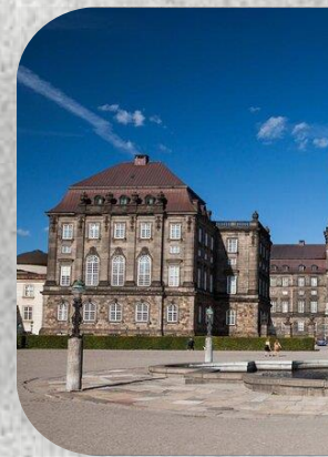
Ανάκτορο Κρόνμποργκ, Κοπεγχάγη