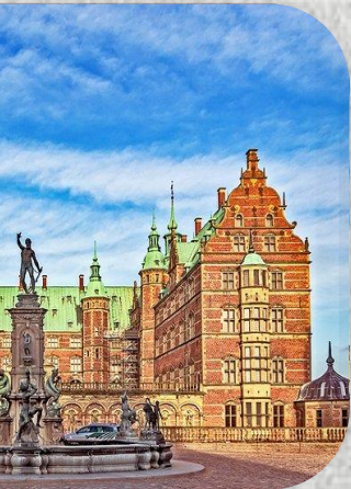
Νέο Νιερικσμποργκ, Κοπεγχάγη