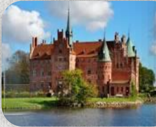
Το Κάστρο Egeskov