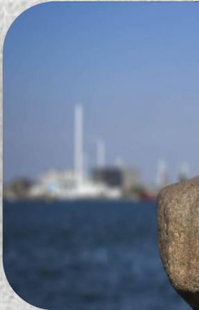
Η μικρή Π...