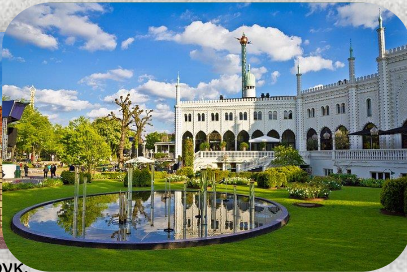
Κήποι Τιβόλι, Κοπεγχάγη