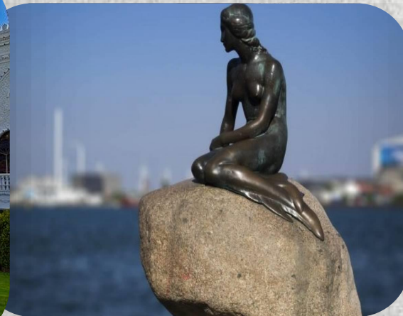
Η μικρή Γοργόνα