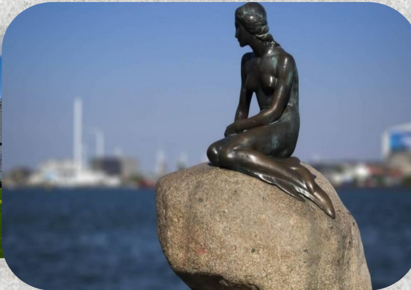
Η μικρή Γοργόνα