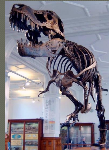
Σκελετός Τυραννόσαυρου στο Μουσείο του Μάντσεστερ