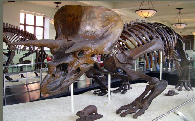
Ο σκελετός του