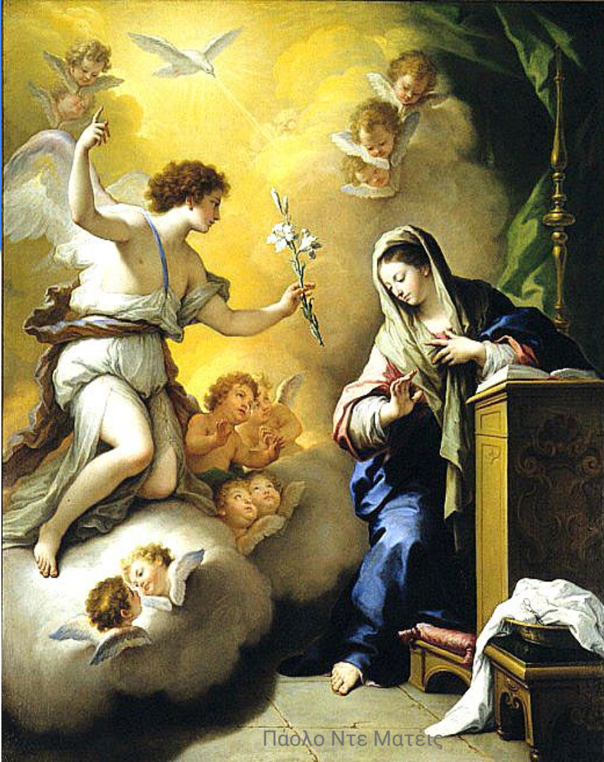
Πάολο Ντε Ματέις