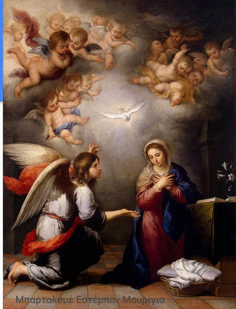
Μπαρτολομέ Εστέρπαν Μουρίγιο