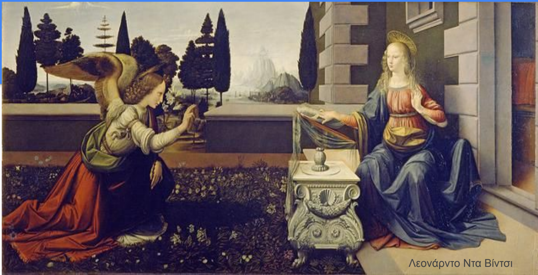
Λεονάρντο Ντα Βίντσι