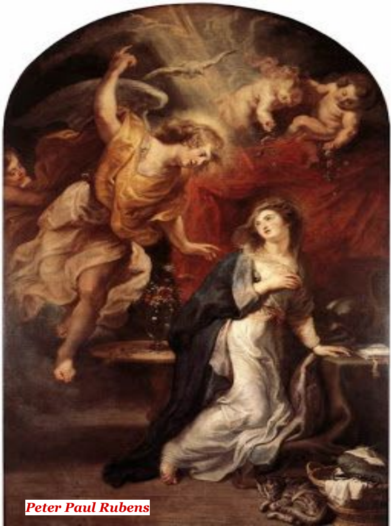
Peter Paul Rubens