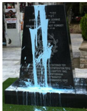
21 Ιουνίου 2015, Μνημείο Ολοκαυτώματος, Καβάλα