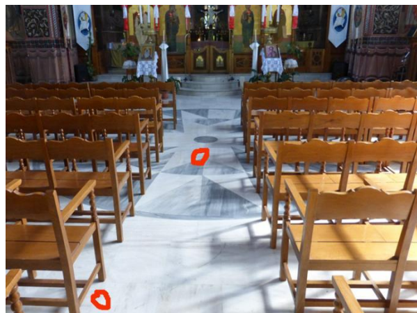
Τα σημεία που βρέθηκαν οι πέτρες.