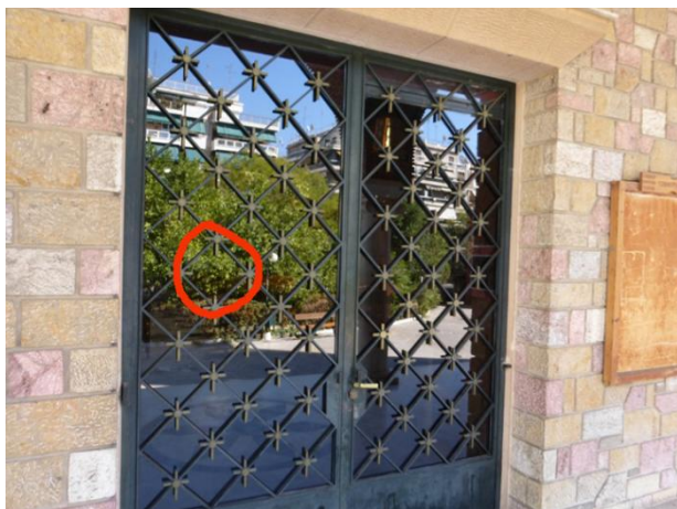
Το σημείο της πόρτας από όπου εισήλθε η πέτρα στο εξωτερικό του ναού.

Ημ/νία συμβάντος: 16/17 Ιουνίου 2015 (βλ. ανωτέρω ενότητα II.B.2)