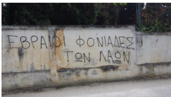
6-7 Ιουνίου 2015, Εβραϊκό Νεκροταφείο, Καβάλα