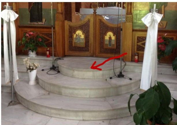
Τα σκαλιά του Ιερού όπου έγραψαν με μαρκαδόρο την φράση «ο Αλλάχ είναι μεγάλος» στην αραβική.