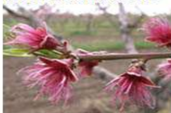
Ροδακινιά / Νεκταρινιά