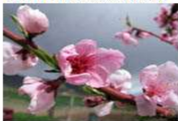
Ροδακινιά / Νεκταρινιά