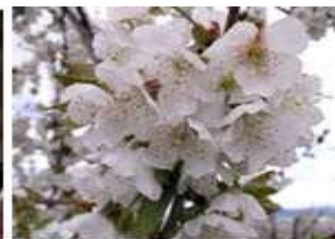
Κερασιά / Βυσσινιά