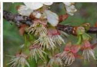
Κερασιά / Βυσσινιά