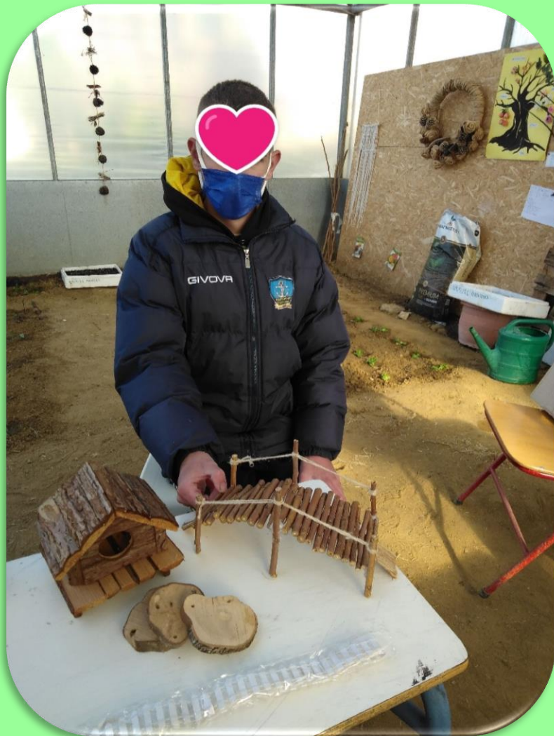
Τα υλικά της μικρογραφίας κήπου λίγο πριν την τοποθέτηση στον κορμό