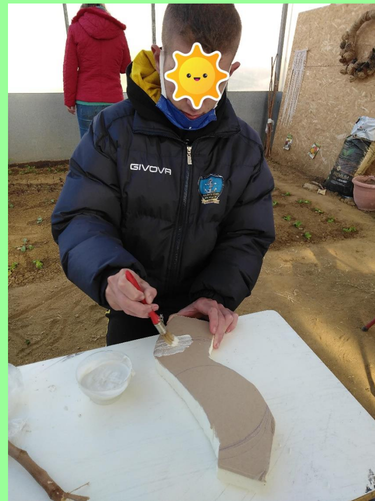
Αφρώδες υπόστρωμα για την κατασκευή του μονοπατιού. Τοποθετήθηκε κόλλα από τον μαθητή