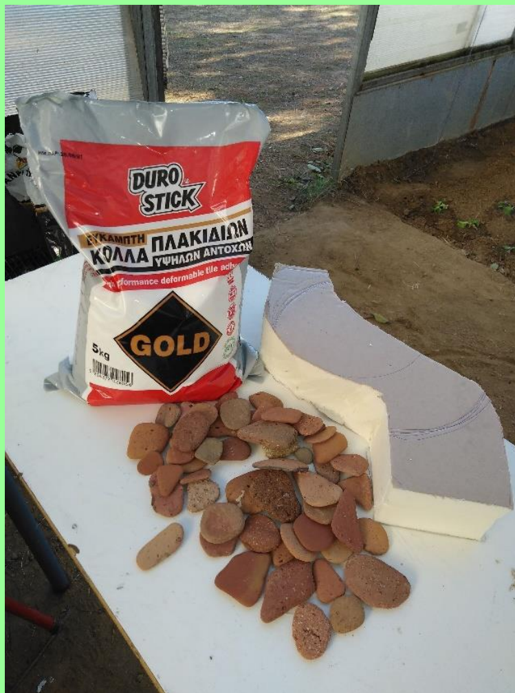
Κεραμικά στοιχεία και κόλλα πλακιδίων για τη δημιουργία του μονοπατιού