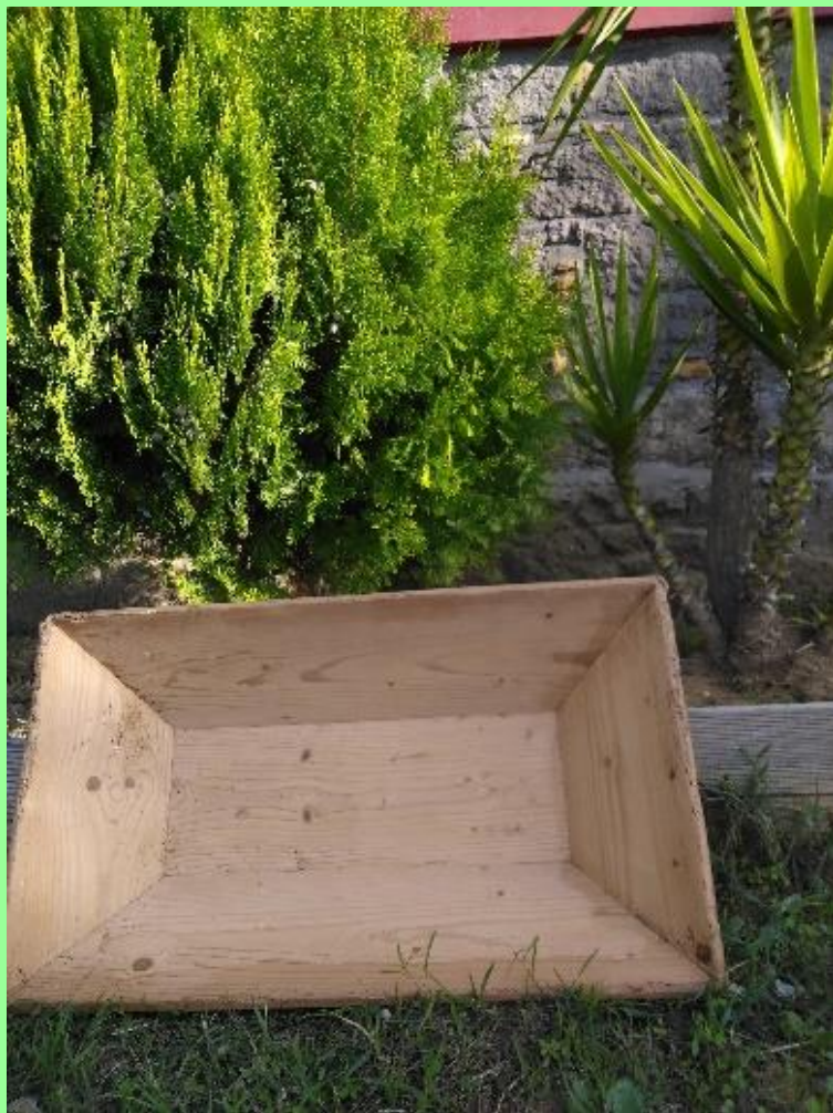
Η σκάφη ζυμώματος