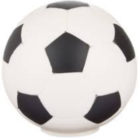
Μπάλα ποδοσφαίρου 15,60 ευρώ