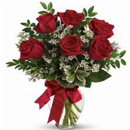
1 Μπουκέτο τριαντάφυλλα -19 ευρώ