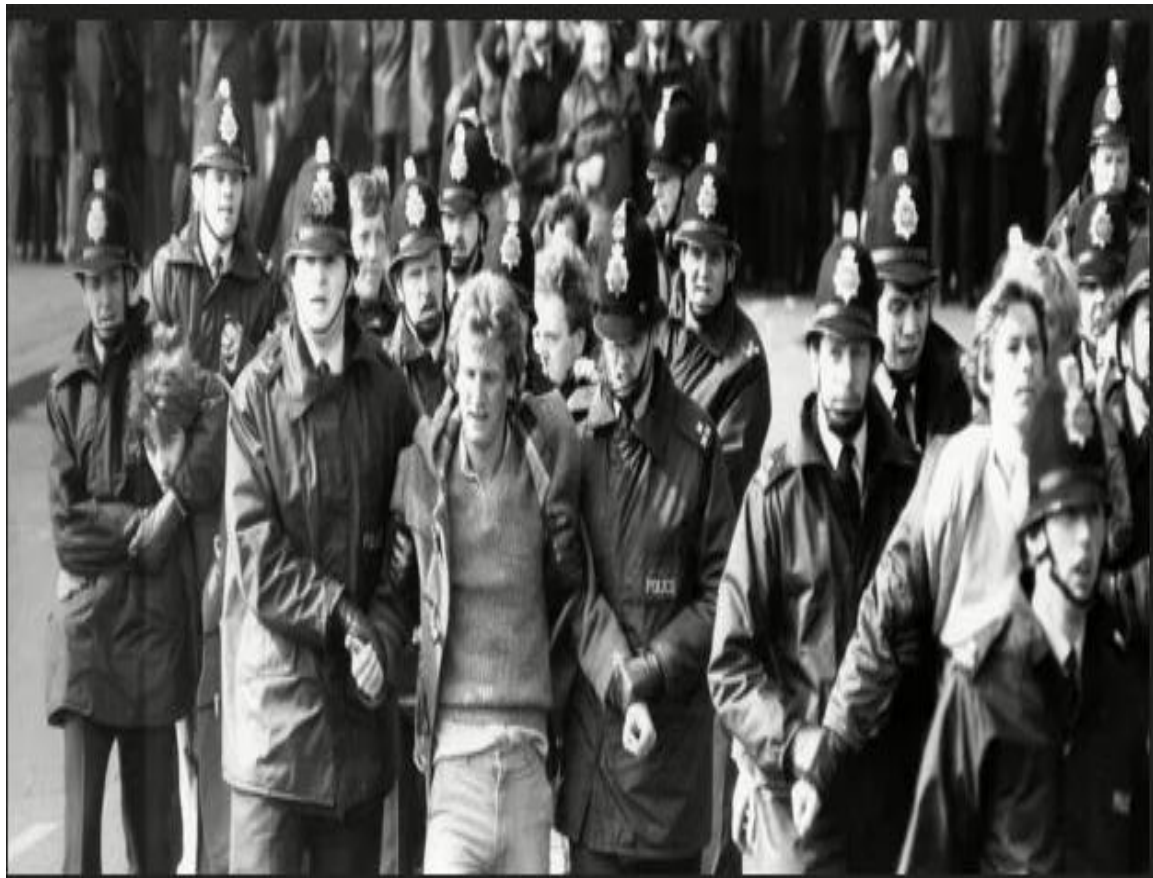
Απεργία ανθρακωρύχων στη Βρετανία-1984

Τι άλλο θα ήθελες να μάθεις για τη φωτογραφία;