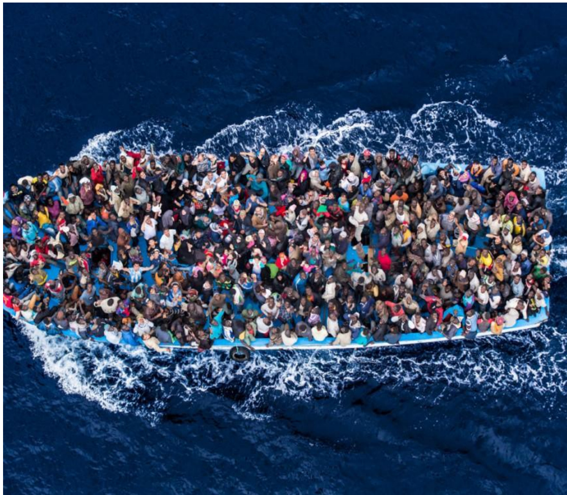
Πρόσφυγες στη Μεσόγειο -2016

Τι άλλο θα ήθελες να μάθεις για τη φωτογραφία;