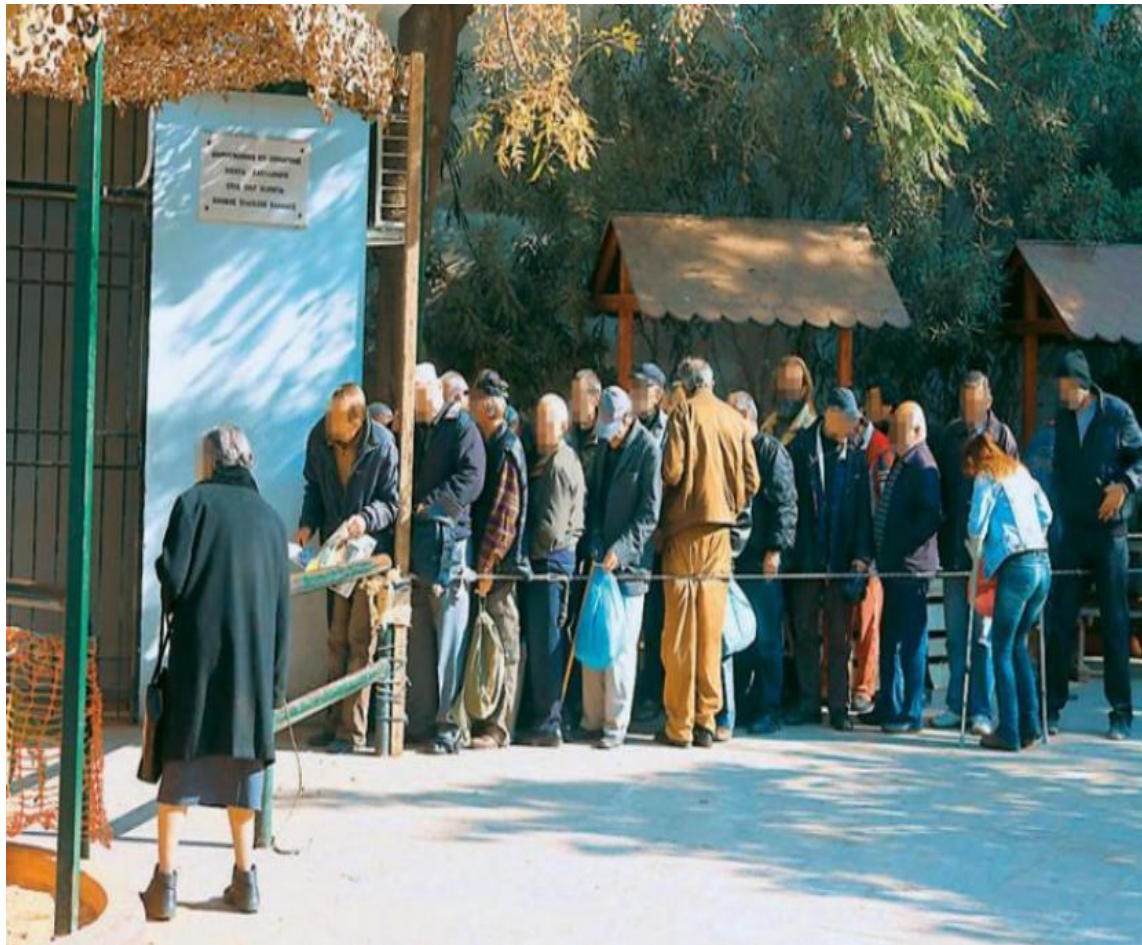
Άστεγοι στην Αθήνα που περιμένουν για φαγητό -2012

Τι άλλο θα ήθελες να μάθεις για τη φωτογραφία;