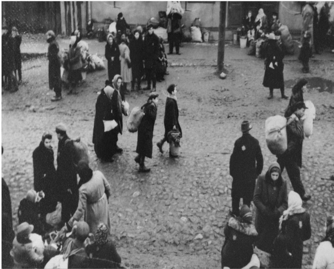
Γκέτο στη Βαρσοβία - 1940

Τι άλλο θα ήθελες να μάθεις για τη φωτογραφία;