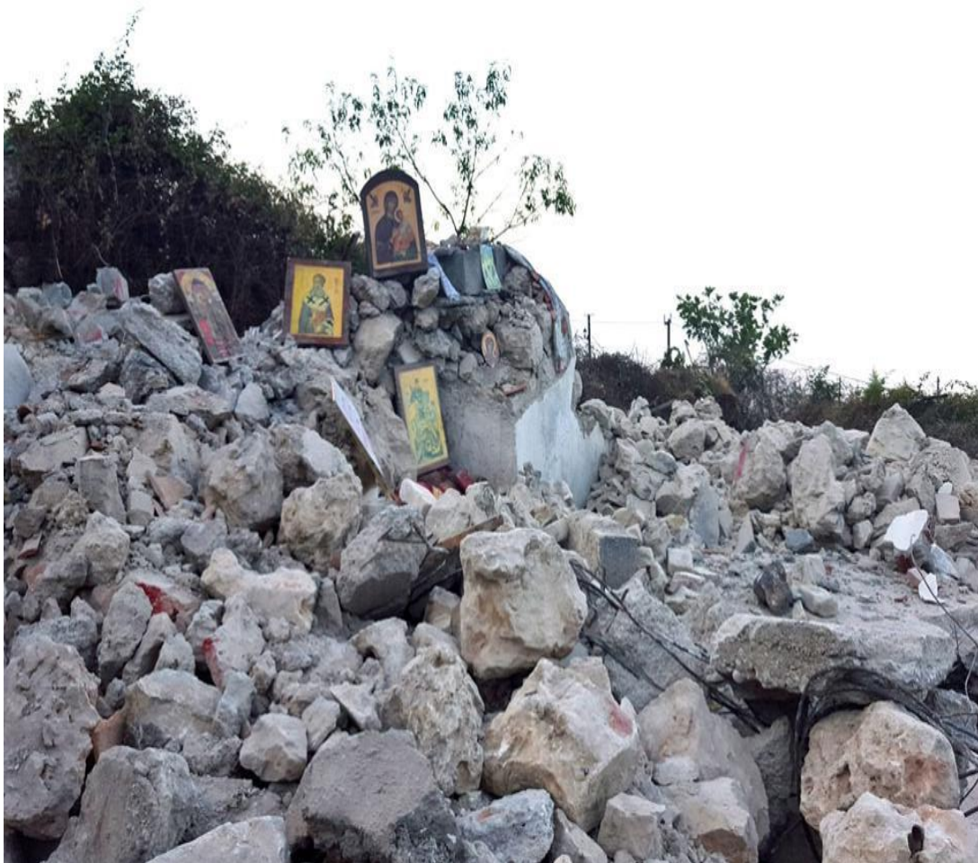
Καταστροφή του Ναού του Αγίου Αθανασίου στην Αλβανία -2015

Τι άλλο θα ήθελες να μάθεις για τη φωτογραφία;