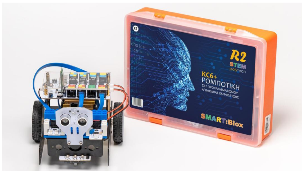
Εικόνα 2: